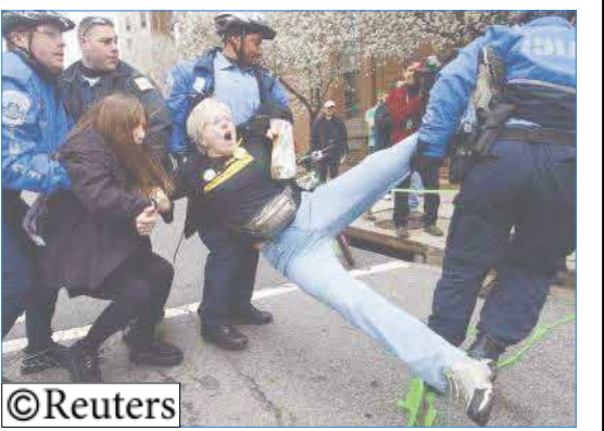
الشرطة الامريكية تعتقل المتظاهرين

اعتقال 200 في واشنطن خلال مظاهرات مناهضة للحرب