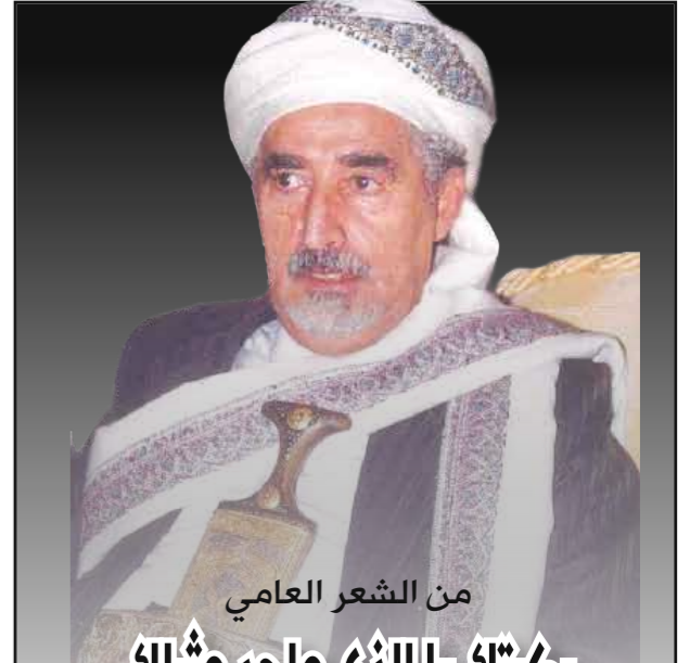
من الشعر العامي

21 مارس .. إذا كان هو يوم الأسرة فإن المجذوب قد شاركها فيه، وهو الأب الخنون ورب الأسرة الكريمة السودانية / اليمنية.. فهو كان منا والينا، ولم يتركنا إلا إلى القبر.. وفي (21) مارس من العام الماضي 2007م. عام مضى يا أيها (السوماني) الجميل والرجل الأصيل، عام مضى وأنت الذي قلت ذات مرة في إحدى قصائدك عن زميلك وأستاذنا المرحوم عباس الأمين عام 1984م شهر سبتمبر شهر وفاته: