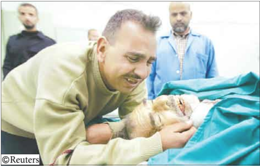
أحد القتلى الفلسطينيين من قبل قوات الاحتلال الاسرائيلي