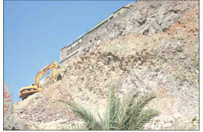
مدرسة أبناء السلاطين