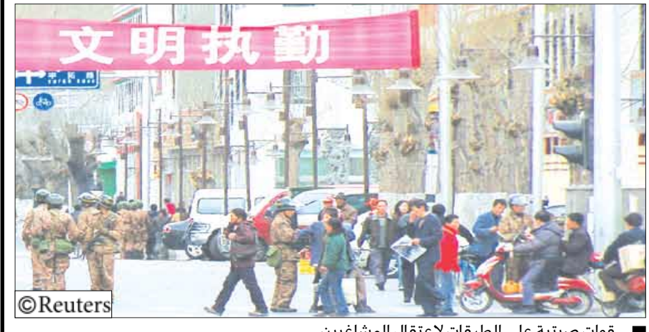
قوات صينية على الطرقات لاعتقال المشاغبين

أثناء متفرقة من الضفة الغربية زعمت أنهم «مشتببه بصلتهم بالارهاب» واقتادتهم للاستجواب دون أن تذكر ما إذا كانت لهم انتماءات تنظيمية حسب ما أورده صحيفة «بيديسوت حسب ما أورده» الإسرائيلية على موقعها الإلكتروني. وفي سياق متصل ذكرت الإذاعة الإسرائيلية العامة أن الجيش الإسرائيلي أمر الجنود بإطلاق الرصاص على فلسطينيين لتجنب وخطف جنوده، حتى لو تعرضوا للخطر. وأفادت الإذاعة بأن قائد وحدة للاحتياط منتشرة على امتداد قطاع غزة نقل هذه التوجيهات تحسبا لأي عملية اختطاف مثل التي تعرض لها الأسير الإسرائيلي جلعاد شاليط في يونيو 2006. يذكر أنه في عملية اختطاف شاليط لم يطلق زملؤه النار على الخاطفين بسبب الفوضى التي حصلت آنذاك. وأوضحت الإذاعة أن هدف الجيش من وراء هذه الأوامر أن يتجنب «باي ثمن» اختطاف العسكريين الذين تطلب عمليات تبادل أسرى. وفي تعقيب على الخبر رفض الجيش الإسرائيلي التعليق، موضحا أنه «ليس من عادته تقديم معلومات عن الأوامر التي تصدر للجنود».