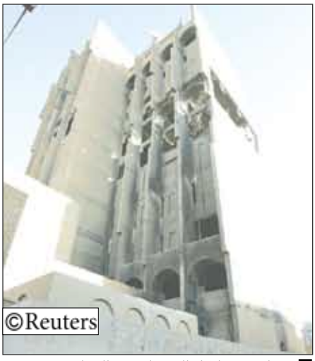
جانب من اضرار الهجمات في العراق

بدوية على حاجز تفتيش في بغداد فأصابوا ثلاثة من الصحة ومدنيا واحدا بجراح. وقد شهدت الساعات الـ24 الماضية هجمات متفرقة كان أعنفها ببلد روز بمحافظة ديالى حيث قتل أربعة أشخاص بينهم شرطيان وأصيب 12 آخرون في هجوم نفذته انتحارية. على صعيد آخر تعهد رئيس الوزراء العراقي نوري المالكي بدمج قوات مجالس الصحة في حي الأعظمية ضمن المؤسسات الأمنية. وقال المالكي أثناء مشاركته في احتفالات المولد النبوي في مسجد الإمام أبو حنيفة النعمان «سنعمل على تسهيل كل الصعاب وفتح كل الدوائر والمؤسسات المغلقة، واستقبال ابنائنا الذين وقفوا بحزم في مواجهة هذه التحديات». يشار إلى أن مجالس الصحة البالغ عددها نحو 135 التي تشكلت بدعم مادي أميركي لمحاربة شبكة القاعدة تضم ما لا يقل عن 80 ألف مقاتل غالبتهم من العرب السنة.