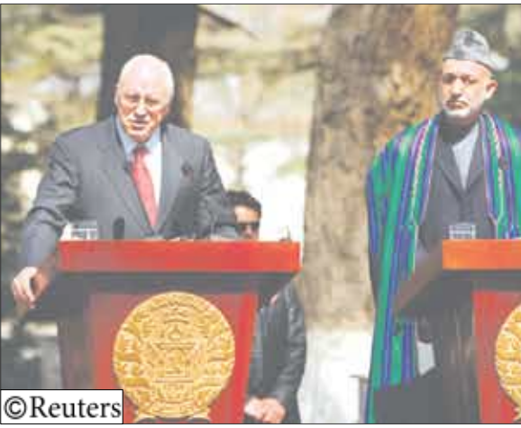
نائب الرئيس الأمريكي تشيني مع الرئيس الافغاني حامد كرزاي

وأضاف تشيني في مؤتمر صحفي في العاصمة الأفغانية كابول حيث قام بزيارة لم يعلن عنها «تركت قوة المعاونة الأمنية الدولية أثرا هائلا في البلد وستطلب أمريكا من حلفائها في الحلف التزاما أكبر في المستقبل». ومضى يقول «كل الدول الحرة لها مصلحة في أمن وديمقراطية أفغانستان». ولقوة المعاونة الأمنية الدولية نحو 43 ألف جندي يحاربون مقاتلي طالبان الذين أعادوا تنظيم صفوفهم منذ أن أطلقت قوات بقيادة الولايات المتحدة والقوات الأفغانية بهذه الحركة بعد هجمات 11 سبتمبر عام 2001 واستأنفت شن هجماتها قبل عامين. وتشترك القوات البريطانية والكندية والندركية في أغلب القتال في جنوب وشرق