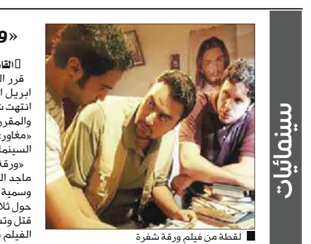
لقطة من فيلم ورقة شفرة