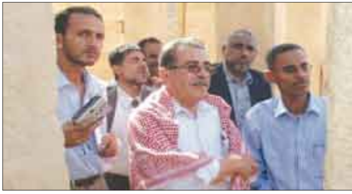
وزير الثقافة في زيارة للمعلم الأثرية بمآرب / سيات

أثري من الأبقار في دولة قطر وبعثات أثرية أخرى. وحث وزير الثقافة الجهات المختصة والقائمة على الآثار في مآرب بضرورة استثمار المواقع الأثرية التي تم الإنتهاء من ترميمها واستغلالها من خلال رسوم وتذاكر الزوار والسياح... والتفكير في مشاريع تنموية يمكن تسويقها للسائح أثناء زيارته لتلك المواقع كالحرف اليدوية وغيرها من الموروث الشعبي والثقافي الذي تميز به المدينة. إلى ذلك تفقد وزير الثقافة ومعه محافظ المحافظة للتصوير النهائية لافتتاح المكتبة العامة بمآرب والتي تحتوي حالياً على أكثر من ٣٠٠٠ ألف عنوان لكتب ثقافية وعلمية. وأكد الوزير المفضل ضرورة دعم المكتبة بأجهزة الحاسوب والآلات اللازمة ووجه برغبته بـ ٧٠٠٠ عنوان من الكتب المتنوعة لوزارة الثقافة.