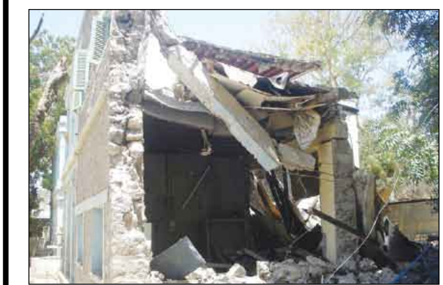
تتبع الخناتة والقبحض عليهم لينالوا جزء ما اقترفوه من جريمة في حق المجتمع.

□ صنعاء / جميل الجديدي: أدان المؤتمر الشعبي العام الحادث الإرهابي الجبان الذي تعرضت له مدرسة السابع من يوليو بأمانة العاصمة أمس والذي أسفر عن إصابة (13) طالبة وخمسة جنود وتسبب في إثارة الرعب في أوساط الفتيات اللاتي كن يتلقين تعليمهن في المدرسة . واعتبر المؤتمر الشعبي العام في بيان تلقت صحيفة «14 أكتوبر» نسخة منه بهذا الخصوص أن هذا الحادث الإجرامي البشع يتنافى مع قيم ديننا وعقيدتنا الإسلامية ومع أخلاق مجتمعنا ووصف من قاموا بهذا العمل الجبان بأنهم أعداء الحياة وأعداء الأمن والاستقرار والتنمية وأن ضمايرهم ميمتة نزع منها قيم الإنسانية، وأنهم يحملون أفكاراً ظلامية متطرقة وشاذة وليس لديهم أي وازع ديني أو أخلاقي. وأضاف: أن أمالهم ستخيب ولن يستطيعوا إيقاف مسيرة العلم والنهضة والبناء والتقدم . ودعا المؤتمر الشعبي العام الأحزاب والتنظيمات السياسية ومنظمات المجتمع المدني والخيرين من أبناء الوطن إلى إدانة هذا العمل الإجرامي ومواجهة أولئك الظالميين الحاقدين ، مطالباً الأجهزة الأمنية بسرعة