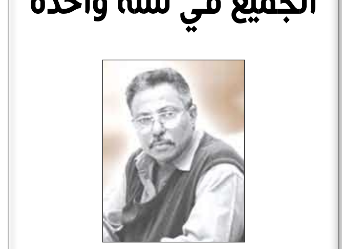
إقبال علي عبدالله

وقفت اللجنة العامة للمؤتمر الشعبي العام - أعلى هيئة قيادية في الحزب الحاكم الذي يحظى بغالبية شعبية في الوطن - في اجتماعها أمس الأول ، أمام قضايا استثنائية هامة بالنسبة للمواطنين الذين منحوا أصواتهم - بكل حرية ودون ضغط من أي جهة - لهذا الحزب ومرشحيه في الانتخابات الرئاسية والبرلمانية والمحلية. وكانت الأوضاع الاقتصادية وارتفاع الأسعار بعضاً من أبرز هذه القضايا التي وقفت أمامها اللجنة العامة في اجتماعها الذي رأسه فخامة الرئيس/ علي عبدالله صالح ، رئيس الجمهورية وحضور عدد من الإخوة الوزراء والمسؤولين في الجهات المعنية ، إلى جانب قضايا وطنية هامة مثل التعديلات الدستورية ومستقبل الحوار مع الأحزاب والتنظيمات السياسية وغيرها من القضايا.