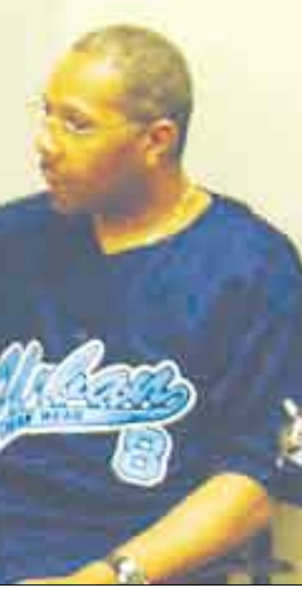
الفحص الطبي قبل الزواج

زوجته، وبعد لحظات من خلوتهما الشريفة داخل غرفة النوم صرخت الزوجة وسقطت على الأرض مغشياً عليها، فتم استدعاء الطبيب للمنزل ليكتشف أن العروس مصابة بالقلب، وفي حالة سينة ولا ينصح لها بالزواج، وهي في هذه الحالة حافظة على حياتها، وبدلاً من أن تكون ليلة زفاف كانت ليلة انفصال العروسين، بسبب هذا المرض.