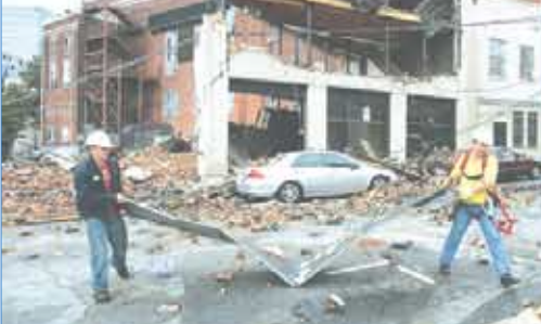
رافعة تسقط على مبنى في نيويورك.

نيويورك/14 أكتوبر/رويترز - أعلن مايكل بلومبيرج رئيس بلدية نيويورك إن رافعة عملاقة سقطت وحطمت مبنى سكنيا في مانهاتن وقتلت أربعة من عمال البناء وأصابت أكثر من عشرة أشخاص آخرين بجروح. وأضاف أن الرافعة «دمرت تماما بشكل أساسي» منزلا مؤلفا من أربعة طوابق وبه حانة بالطابق السفلى وألحقت أضرارا بثلاثة مبان أخرى. وكانت الحانة مغلقة في ذلك الوقت.