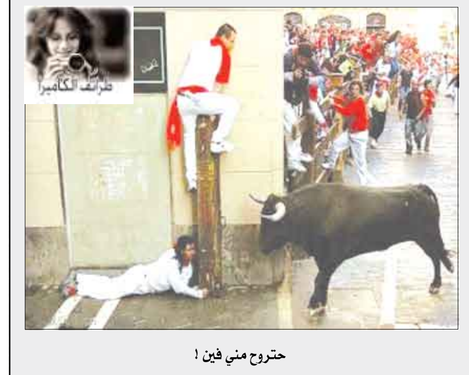
حترج مني فين!