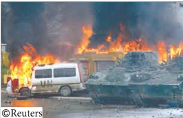
جانب من الاشتباكات بين قوات الأمم المتحدة والصرب