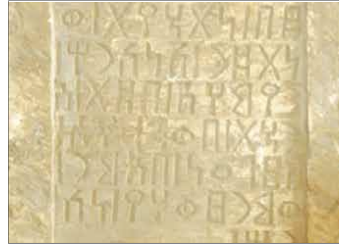
نقش حميري

يذكر أن الكتاب يقع في 267 صفحة، وهو بمثابة دراسة تجمع بين العمل الإعلامي والسياسي والعمل الأكاديمي، وذلك من خلال تقديم معلومات غزيرة عن المجتمع الإسرائيلي سياسيا، اقتصاديا، انثروبولوجيا، ديمغرافيا، وظيفيا وناقشاتها وتحليلها بشكل علمي ويعيد عن التصعب والانحياز، وذلك من أجل إبراز الحقائق وقراءة الأحداث في الدائل الإسرائيلي قراءة متأنية للاستفادة منها في التعامل مع الشخصية الإسرائيلية.