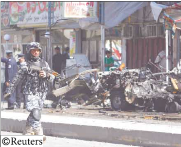
جندي بريطاني في العراق