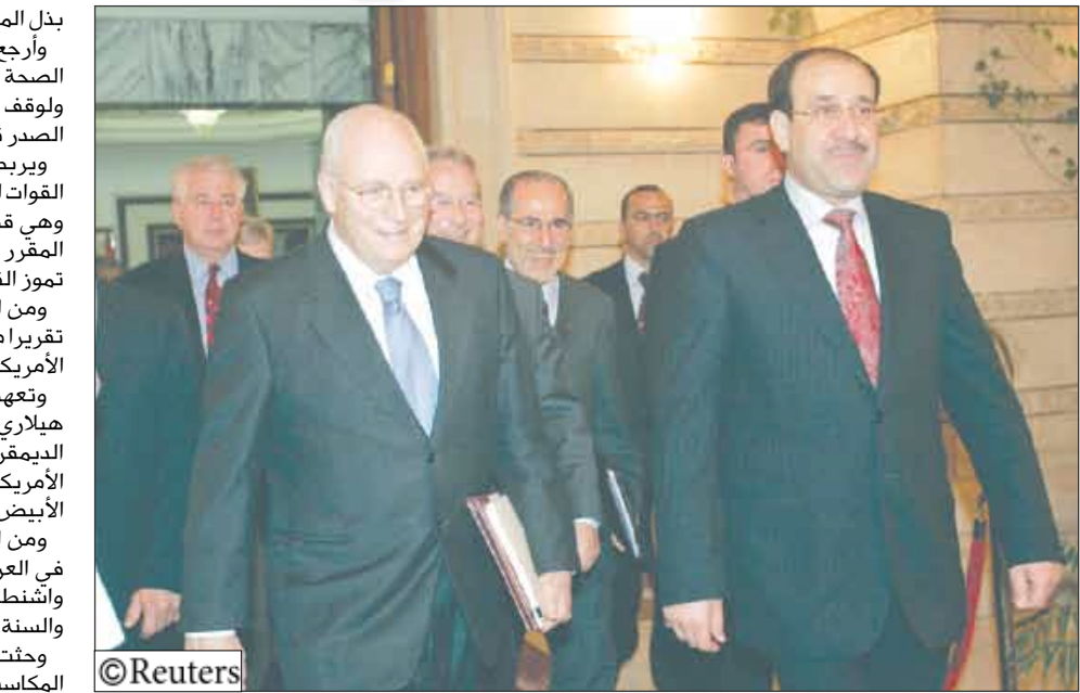
رئيس الحكومة العراقية نوري المالكي مع نائب الرئيس الأمريكي

ورغم أنه أقر بأن زعماء مثل رئيس الوزراء البريطاني جوردون براون والرئيس الفرنسي نيكولا ساركوزي قد يجدان في هذه الرحلة فرصة لتقييمه كرئيس محتمل فقد قال مكين إنه لا يقوم بهذه الجولة بصفتها مرشحا. وهذه هي الزيارة الثالثة لللعراق منذ الغزو الذي قادته الولايات المتحدة للعراق في مارس عام 2003. وأيد مكين وهو طيار سابق في سلاح البحرية أسر في حرب فيتنام غزو العراق لكنه انتقد بشك صريح الكيفية التي تدار بها الحرب قبل بدء نشر 30 ألف جندي إضافي العام الماضي في إطار الاستراتيجية الجديدة. وقال مكين في إشارة إلى زيادة القوات لجنود أمريكيين في الموصل في شمال العراق «أنا سعيد بالقول بأن الأمريكيين هم أكثر تفهما لنجاح إستراتيجية زيادة القوات»، ومن غير المتوقع أن يلتقي تشيني ومكين خلال وجودهما في العراق. وأجرى مكين منذ وصوله الى العراق يوم الأحد محادثات مع المالكي وزعماء آخرين. وبالإضافة إلى الموصل التي يعتبرها القادة الأمريكيون المعقل الأكبر للقاعدة في الحضر فقد تم حديثا في محافظة الأنبار الغربية والتي كانت يوما من أخطر المحافظات العراقية. وأظهرت لقطات تلفزيونية مكين وقد أحاط به جنود أمريكيون وهو يشترى مشروبا غازيا في سوق في حديثة.