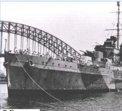
صورة غير مؤرخة للسفينة الحربية الأسترالية اتش ام ايه ايس سيدني (H) في سيدني عقب عودتها من البحر المتوسط.

كانبيرا (رويترز) - عثرت استراليا أول أمس على حطام سفينة حربية تعود للحرب العالمية الثانية غرقت بجميع أفراد طاقمها وعددهم 645 فردا عقب معركة شرسة مع سفينة ألمانية لينتهي بذلك أكبر لغز عسكري بهذا البلد بعد أكثر من 66 عاما. وبعد يوم من نجاح الباحثين في تحديد موقع حطام السفينة الألمانية اتش اس كي كورموران HSK Kormoran قبالة الساحل الغربي الأسترالي أعلن رئيس الوزراء كيفين رود أن الباحثين عثروا أيضا على حطام السفينة الحربية الأسترالية اتش ام ايه ايس سيدني HMAS Sydney التي غرقت بنيران السفينة الألمانية.