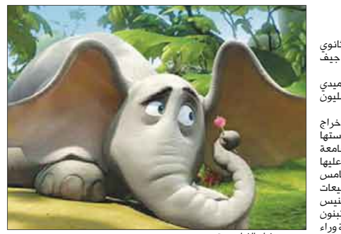
من فيلم دابل هورن

وكان قد طلبهما بالمصروفات ومقابل أنعاب المحاماة الفعلية ، وهو الامر الذي انتهى بالصلح بين بولنت وقتساء روتانا ، ليبدأ الطرفان اجتماعات ستفضي إلى انطلاق مشاريع جديدة في المستقبل القريب.