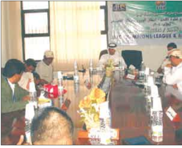
خلال المؤتمر الصحفي