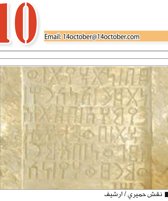
نقش حميري / ارشيف

لوس انجليس 14 أكتوبر رويترز تصدر فيلم الرسوم المتحركة الجديد «الفيل هورتون Dr. Horton Hears a Who». إيرادات الأفلام بأمریکا الشمالية مسجلا 45.1 مليون دولار. ويقوم بالأداء الصوتي للفيلم جيم كاري وستيف كاريل ويخرجه جيمي هيوارد وستيف مارتينو. وتراج عن الصادرة في الأسبوع الماضي إلى المركز الثاني فيلم المغامرات والحركة «عشرة الألف سنة قبل الميلاد 10000 BC» بإيرادات 16.4 مليون دولار. وتدور قصة الفيلم الذي يخرجه روفالد اميريتش ويقوم ببطولته كامبلا بيلى وكليف كيرتز حول ملحمة عن فترة ما قبل التاريخ تحكي رحلة صياد يتعقب نوعا من الفيلة التي عاشت بالعصور القديمة تسمى الماموث في أرض مجهولة بهدف تأمين مستقبل قبيلته. واحتل المركز الثالث فيلم الحركة الجديد «لن أترج Never Back Down» لشين فرايس وأجر هيرد وسجل 8.6 مليون دولار.