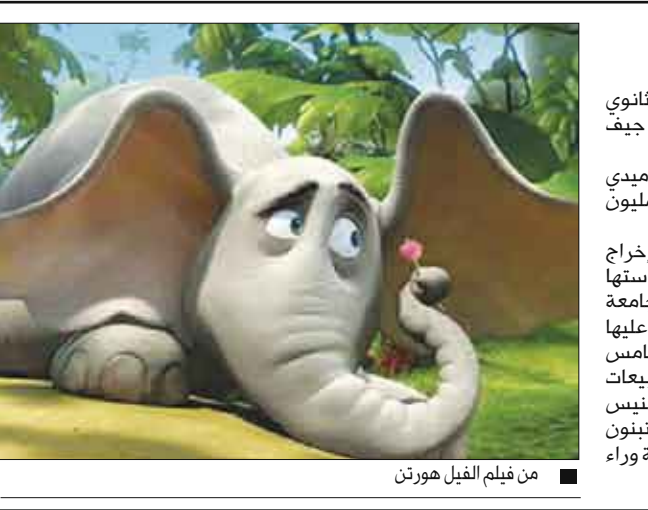
من فيلم الفيل هورتون

وقد جاء شطب وسحب جميع تسوية الخلاف وتجديد العقد بينهما، حيث تقدم بولنت بالمذبة حليلة بولنت ودفاع الأمير الوليد بن طلال للمحكمة ما يفيد بأنه قد تم الصلح بين الطرفين لتقوم المحكمة بنسحب الدعوى التي اقامها الأمير الوليد ضد حليلة بولنت وبقناة الراي، والتي كان قد رفعها مطالباً بولنت بالالتزام بنصوص عقدها من قبل روتانا الذي ينص على إنتاج جميع أعمالها الفنية وعدم العمل على أي قناة تليفزيونية أخرى. وكان دفاع الأمير الوليد طالب في دعواه كلا من بولنت وبقناة الراي بأن يؤدبا قيمة نصيب حليلة من حق الأداء العلني في «فوازير حليلة».. والإعلانات المرتبطة بهذا العمل، وندب خبير حسابي للإطلاع على عائدات التسويق والإيرادات ومقابل الإعلانات التجارية المترتبة على «فوازير حليلة» واحتساب قيمة نصيب حليلة والزام قناة الراي بأدائه لمؤسسة روتانا. وكان قد طالبها بالمصروفات ومقابل أنعاب المحاماة الفعلية، وهو الامر الذي انتهى بالصلح بين بولنت وقناة روتانا، لبدأ الطرفان اجتماعات ستفضي إلى انطلاق مشاريع جديدة في المستقبل القريب.