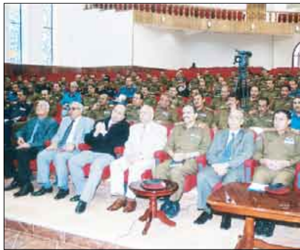
السماعي في محاضرة أمام الطاقم التعليمي في كليات الأكاديمية العسكرية

ولفت محافظ البنك المركزي إلى أهمية هذه المحاضرة التي تصب في إطار برنامج بناء القدرات المعرفية لدى القوات المسلحة في جانب من أهم الجوانب الاقتصادية وهو الجانب النقدي والمصرفي . ونوه السماعي بأنه لن يكون هناك نمو وازدهار ورخاء ما لم تكن هناك قوة تحمي هذه المنجزات وتدافع عنها وأنها ستهلك في الكون إذ أنه لا مكان للضعفاء .