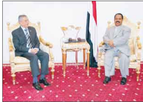
رئيس مجلس النواب مع السفير السوري

انتخابه رئيساً لمجلس النواب وكذا أشاد رئيس مجلس النواب يحيى على الراعي بمستوى علاقات التعاون الأخوي المتنامية بين الجمهورية اليمنية والجمهورية العربية السورية في كافة المجالات. وأكد رئيس مجلس النواب لدى لقائه أمس السفير السوري بصنعاء عبد الغفور صابوني ، على أهمية الارتقاء بالتعاون البرلماني بين البلدين والشعبين الشقيقين ، لاسيما تفعيل نشاط وأداء جمعية الأخوة البرلمانية اليمنية السورية وتبادل الخبرات والتجارب المكتسبة لدى برلماني البلدين . وكان السفير السوري نقل تهاني هيئة رئاسة مجلس الشعب السوري وكافة أعضاء مجلس الشعب إلى الأخ يحيى على الراعي بمناسبة