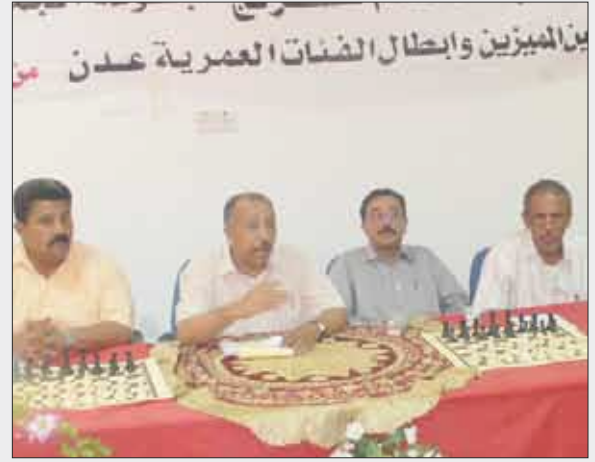
لقطة من البطولة