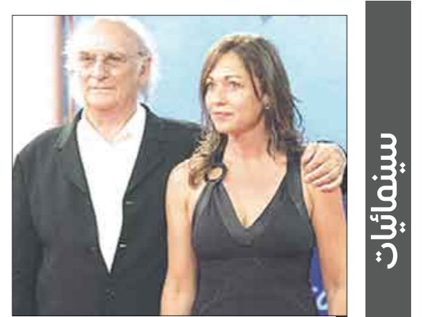
المخرج كارلوس ساورا

الدار البيضاء / منوعات : ينظم نادي «مارثيل للسينما والثقافة» من 18 إلى 22 يونيو/حزيران المقبل الدورة الثامنة لـ «مهرجان مرثيل للسينما المغربية والسينما الإسبانية وأمريكا اللاتينية للفيلم القصير» ويتضمن برنامج هذه الدورة، التي تترأس لجنة تكريمها أنا أريبطا المدير العام لأكاديمية الفنون بإسبانيا، مسابقة رسمية للفيلم القصير وأخرى للفيلم الوثائقي، وذلك بحضور عد من الشخصيات المهتمين بالفن السابع من بينهم مديرة المركز السينمائي المكسيكي ماريانا ستافينهاكاين فاركس. وضمن الأنشطة الموازية للمهرجان ستنتظم مائدة مستديرة حول «آليات التعاون المغربي في مجال السينما» بمشاركة مختصين من المغرب وإسبانيا، كما سيتم بالمناسبة تكريم الممثل المغربي يونس مكري والمخرج العالمي كارلوس ساورا، إضافة إلى تكريم سينما جزر الكناري بحضور وفد يترأسه مدير الخزنة السينمائية للمنطقة. ويتعتبر كارلوس ساورا الذي سيتم تكريمه خلال هذه الدورة