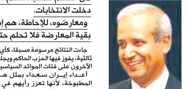
عبد الرحمن الراشد