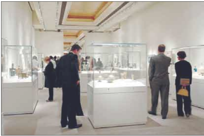
معرض «فن الإسلام»