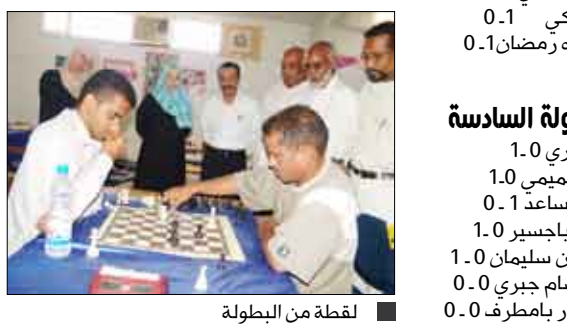
لقطة من البطولة