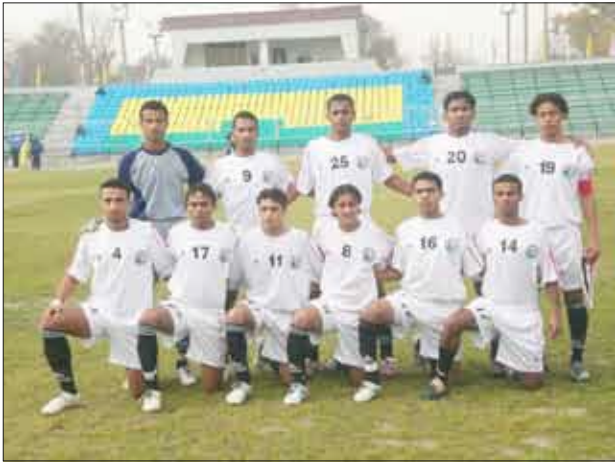
المنتخب الوطني للشباب