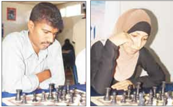
لقطة من البطولة