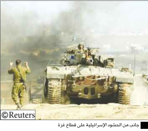
جانب من الحشود الإسرائيلية على قطاع غزة