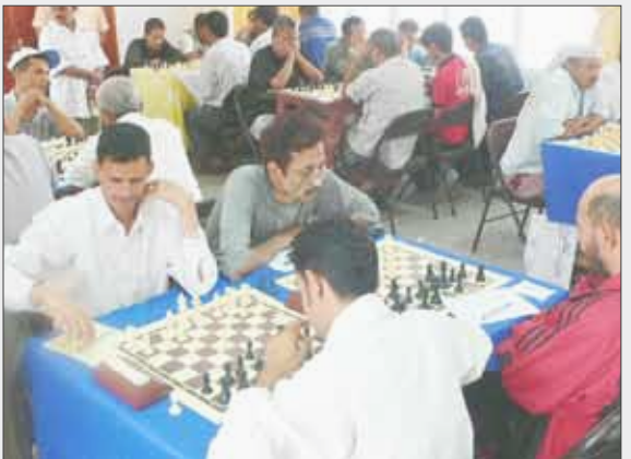
لقطة من البطولة