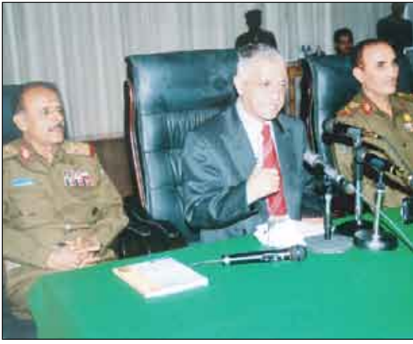
السماعي في محاضرة أمام الطاقم التعليمي في كليات الأكاديمية العسكرية