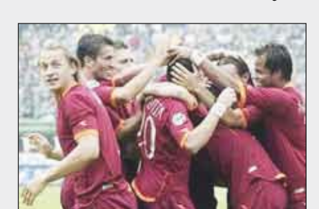
14 أكتوبر / متابعات / وكالات :

وعلى ملعب «سان سيرو»، يستضيف إنتر ميلان حامل اللقب باليرمو الثامن، أملاً النهوض بعد أسبوع مضطرب بدأ بخروجه من دوري الأبطال إثر خسارته على أرضه أمام ليفرول الإنجليزي صفر - 1 (صفر - 2 ذهاباً). ثم إعلان مديره روبرتو مانشيني أنه سيترك منصبه في نهاية الموسم قبل أن يفي الرئيس ماسيمو موراتي ما ورد على لسان مديره الذي قال: «أحياناً يقول المرء أشياء لا يريد فعلاً حدوثها. أنا ملتزم مع إنتر». ويطلع يعرف مانشيني ولاعبوه أن عليهم التركيز جيداً للمحافظة على الأفضلية التي تفصلهم عن روما رغم المشاكل الدفاعية التي ستبذل الكولومبي إيفان كوربورا والأرجنتيني والتر سامويل والبرازيلي ماركوسيل على خط الظفر.