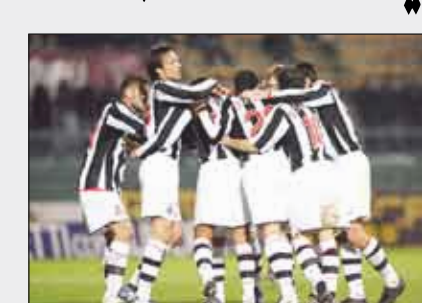
إنتر - باليرمو

وعلى ملعب «سان سيرو»، يستضيف إنتر ميلان حامل اللقب باليرمو الثامن، أملاً النهوض بعد أسبوع مضطرب بدأ بخروجه من دوري الأبطال إثر خسارته على أرضه أمام ليفرول الإنجليزي صفر - 1 (صفر - 2 ذهاباً). ثم إعلان مديره روبرتو مانشيني أنه سيترك منصبه في نهاية الموسم قبل أن يفي الرئيس ماسيمو موراتي ما ورد على لسان مديره الذي قال: «أحياناً يقول المرء أشياء لا يريد فعلاً حدوثها. أنا ملتزم مع إنتر». ويطلع يعرف مانشيني ولاعبوه أن عليهم التركيز جيداً للمحافظة على الأفضلية التي تفصلهم عن روما رغم المشاكل الدفاعية التي ستبذل الكولومبي إيفان كوربورا والأرجنتيني والتر سامويل والبرازيلي ماركوسيل على خط الظفر.