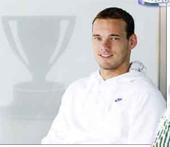
14 أكتوبر / متابعات / وكالات :

أكد لاعب وسط نادي ريال مدريد الإسباني ويسلي شنيدر أن بلاده ستكون محظوظة للغاية لو كان راؤول هولندياً، مؤكداً أنه سيحظى على الدوام بثقة المدير الفني للمنتخب المحلي. وقال اللاعب الهولندي خلال مقابلة مع صحيفة (أس) الرياضية الإسبانية أن غياب راؤول عن بطولة الأمم الأوروبية سيكون خسارة كبيرة للمنتخب الإسباني وجماهيره على حد سواء: «في الحقيقة لا أفهم سبب استبعاد راؤول من المنتخب الإسباني، فهو لاعب مؤثر جداً وأعتقد أن إسبانيا ستخسر الكثير من رونقها إذا لم يشارك راؤول في بطولة أمم أوروبا المقبلة». وأشار شنيدر إلى أن هولندا ستكون محظوظة في حال كانت تملك لاعباً كراؤول في منتخبها، بقوله: «أتمنى لو يمكننا إشراك راؤول في المنتخب الهولندي، وأنا واثق تماماً لو أتاحت لنا فرصة فعلية لتحقيق ذلك فسيفكر راؤول دون شك أحد العناصر الأساسية في الفريق» وتابع «وأكرر ما أقوله دائماً أن راؤول يعد رمزاً من رموز كرة القدم العالمية والإسبانية على وجه الخصوص ويستحق حقاً تمثيلها في بطولة أمم أوروبا المقبلة».