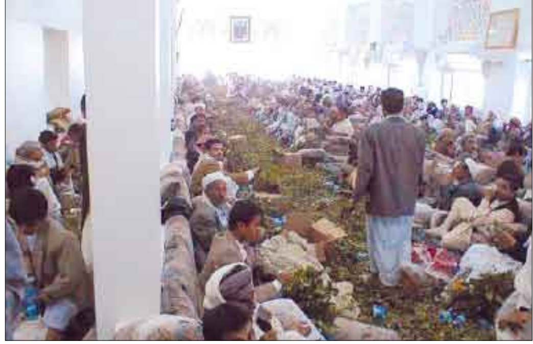
مخزونا في أحد مبارز القات

لا اندم حين لاينفغ الندم. الأخت (ه.ر.ق.) قالت أنا موظفة كنت اجتمع أنا وبعض الصديقات إلى الصديقات عند واحدة من الصديقات مثل يوم الخميس عندي ويأتي دور كل واحدة منهن لنخزن عندها مثل المريض الذي يعانى من وهكذا ولا اخفي عليك بأنني كل يوم مع زوجي بمشاكل بسبب هذا القات والذي يعضبه أكثر لمانا ذهبت أخزن عند الصديقات هو الذي علمني القات وولعني به والأنا يثور ويغضب وهو السبب في ذلك وفي أعد الأيام ضاع طفلي الصغير الذي يبلغ من العمر 4 سنوات الذي خرج أخوه الذي يكبره بعامين (ست سنوات) وخرج الجميع يبحث عنه فوجناه في آخر الحسي لوحده وهو لايعرف يتكلم وفزعنا جميعاً وقررت أن لأخزن الأي في البيت وأطفالي حولي يلعبون كما تشاهدينهم الآن. الأخت (ش.ن.ر.) قالت أنا ربة بيت لا أعمل أخزن كلما سمحت لي ظروف لشراء القات دون تحديد أيام معينة