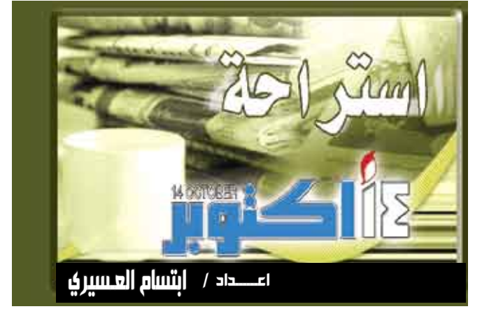
اعداد / إبتسام العسيري

تندن / متابعة : ذكرت دراسة أن إعطاء الأطفال فيتامين «د» يمكن أن يقلص احتمال إصابتهم بالسكري من النوع الأول عندما يكبرون. وبينت دراسة حديثة أن تناول الأطفال للادوية التي تحتوي على هذا الفيتامين يمكن أن يخفف معدل إصابتهم بالمرض بنسبة 30 بالمائة مقارنة بنظرائهم الذين لا يأخذونها. وقالت هيئة الاذاعة البريطانية، بي بي سي، إن فريقاً طبيياً من مانشستر اطلع على خمس دراسات حول تأثير الفيتامين على الصحة حيث تبين له أنه كلما كانت الجرعة أكبر وتناولها، أي الفيتامين، منتظماً كان احتمال الإصابة بمرض السكري من النوع الثاني أقل.