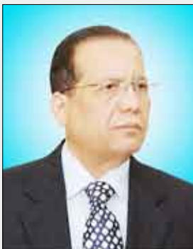
عبد القادر باجمال

الفلاني يحتاج إلى معالجات وهناك رؤية للمعالجة من قبل المعارضة نحن مستعدون لمناقشتها دون جدال، لكن تطرح شعارات هلامية ، سياسية ليست محددة بوضع معين. وناشد نائب رئيس الجمهورية في ختام كلمته الدول الأعضاء في المنظمة إلى تجاوز القضايا الخلافية ذات الطابع الثنائي وإعطاء أهمية قصوى ليس لإيراز هوية المنظمة وتكاتف وتضامن الدول الإسلامية الأعضاء فيها فحسب بل ومن أجل إبرازها على الساحة السياسية والاقتصادية والاجتماعية الدولية موحدة قوية تمتلك شواهد المصداقية والقدرة على الشراكة في صنع لقرارات الدولية .