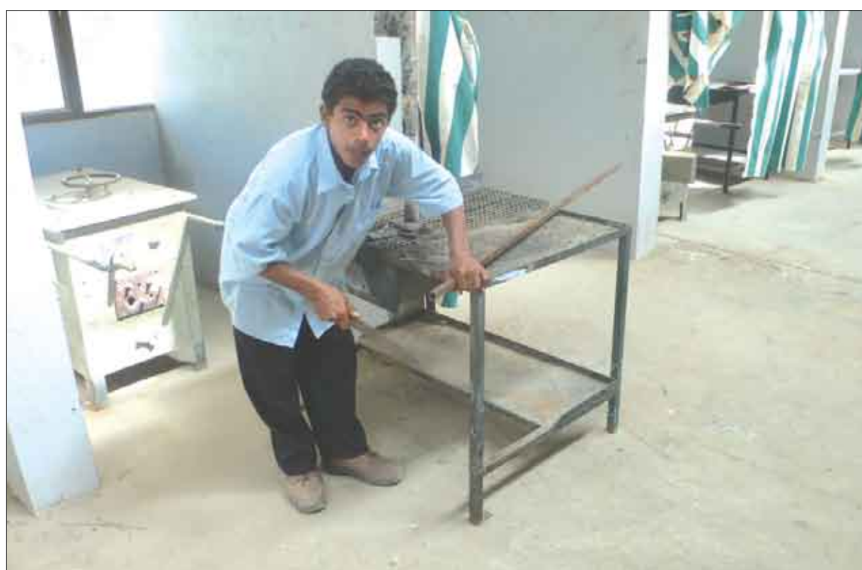
طالب من قسم اللحام