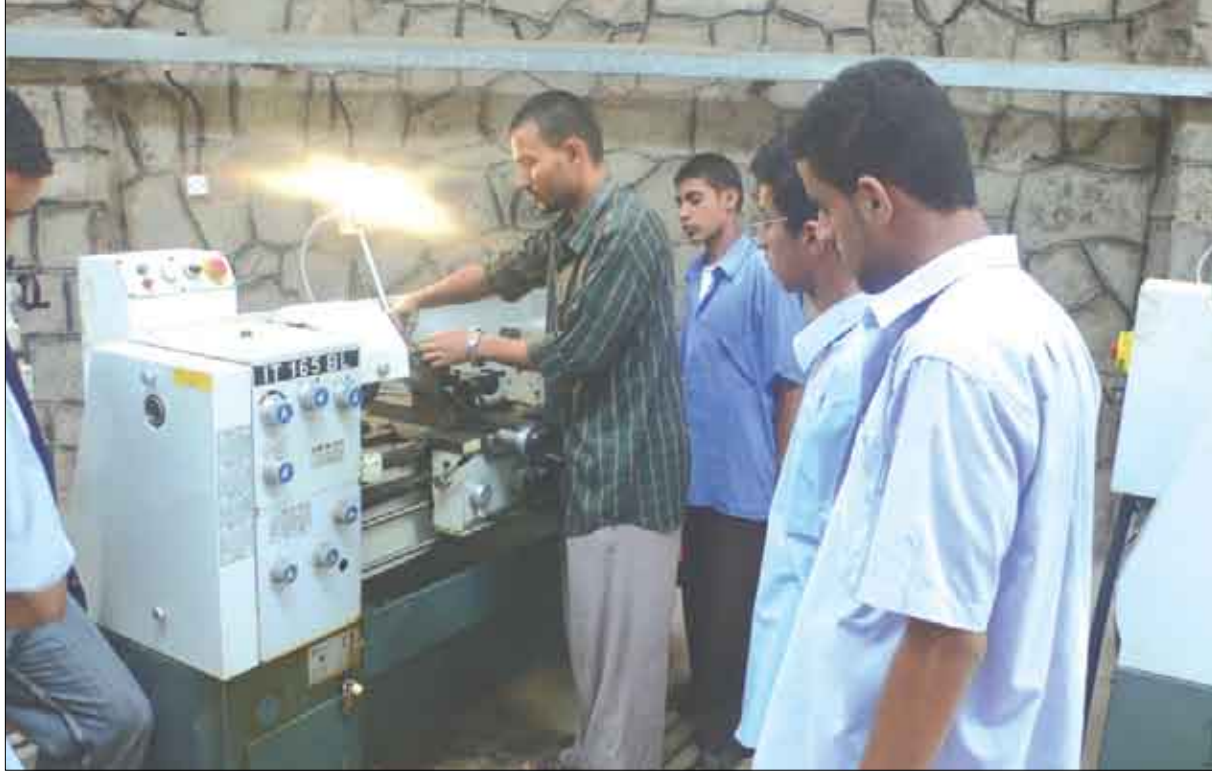
طلاب قسم الخراطة

الحكومة على التعليم الفني باعتباره من مكونات التنمية الشاملة وتسعى إلى توسيع الشراكة مع القطاع الخاص ويواصل الدكتور إبراهيم حجري وزير التعليم الفني والتدريب المهني حديثه قائلاً: