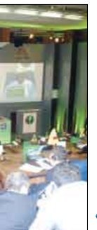
الرئيس الصومالي يعبر عن تقديره لمواقف الرئيس علي عبدالله صالح تجاه محنة الشعب الصومالي

دكار/سبأ: التقى الأخ عبد ربه منصور هادي نائب رئيس الجمهورية أمس فخامة الرئيس الصومالي عبد الله يوسف احمد وذلك على هامش أعمال القمة الإسلامية الـ 11 المنعقدة بالعاصمة السنغالية دكار. جرى خلال اللقاء بحث الأوضاع في الصومال وآخر مستجداته، وكذا ما يهم الأمن في القرن الأفريقي وما يتعلق بذلك في القمة الإسلامية. وقد عبر الرئيس الصومالي خلال اللقاء عن تقديره الكبير لفخامة الرئيس علي عبد الله صالح رئيس الجمهورية لمواقفه المبدئية والنبيلة تجاه محنة الشعب الصومالي من أجل الأمن والاستقرار. تبنيت منظمة المؤتمر الإسلامي في ختام أعمالها أمس الجمعة في العاصمة السنغالية دكار، مشروع الميثاق الجديد للمنظمة، كما أدانت في بيانها الختامي الهجوم الإسرائيلي على غزة ونشر الرسوم المسيئة للنبي محمد صلى الله عليه وسلم. ونددت القمة الإسلامية في بيانها الختامي بـ «الحملة العسكرية الإسرائيلية الجارية والمتنامية ضد الشعب الفلسطيني التي تواصل من خلالها إسرائيل القنوة المحتلة ارتكاب انتهاكات خطيرة لحقوق الإنسان وجرائم حرب». ودعا البيان المجتمع الدولي إلى الضغط على إسرائيل «قوة الإحتلال، لكي تنهي فوراً حصارها وعقابها الجماعي للشعب الفلسطيني».