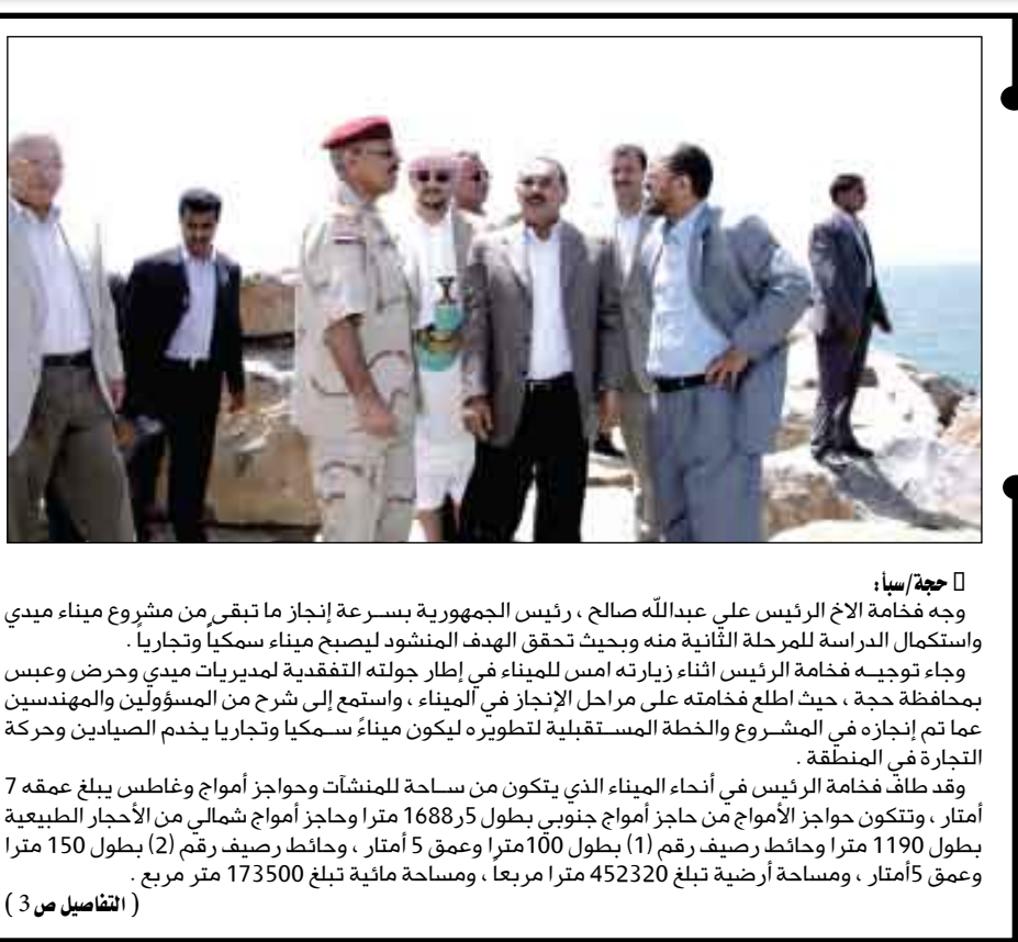
وجه فخامة الأخ الرئيس على عبدالله صالح، رئيس الجمهورية بسرعة إنجاز ما تبقى من مشروع ميناء ميدي واستكمال الدراسة للمرحلة الثانية منه وبحيث تحقق الهدف المنشود ليصبح ميناء سمكيا وتجاريا.

وجاء توجيه فخامة الرئيس أثناء زيارته أمس للميناء في إطار جولته التفقدية لمديريات ميدي وحرص وعيس بمحافظة حجة، حيث اطلع فخامته على مراحل الإنجاز في الميناء، واستمع إلى شرح من المسؤولين والمهندسين عما تم إنجازه في المشروع والخطة المستقبلية لتطويره ليكون ميناء سمكيا وتجاريا يخدم الصيادين وحرمة التجارة في المنطقة.