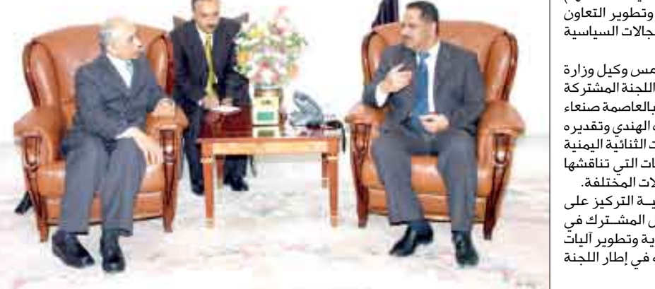
أكد الدكتور علي محمد مجور رئيس مجلس الوزراء أن الزيارة المرتقبة لفخامة الأخ الرئيس على عبدالله صالح رئيس الجمهورية إلى جمهورية الهند الصديقة ستسهم بشكل كبير في تعزيز علاقات الصداقة وتطوير التعاون المشترك بين اليمن والهند في كافة المجالات السياسية والاقتصادية والثقافية.

جاء ذلك أثناء لقاء الأخ رئيس الوزراء أمس وكيل وزارة الخارجية الهندية التي تعقد اجتماعاتها حاليا بالعاصمة صنعاء الذي نقل للأخ رئيس الوزراء تحيات نظيره الهندي وتقديره العالي للنمو المستمر الذي تشهده العلاقات الثنائية اليمنية الهندية. وتم أثناء اللقاء تناول الموضوعات التي تناقشها الدورة الحالية للجنة المشتركة في المجالات المختلفة.