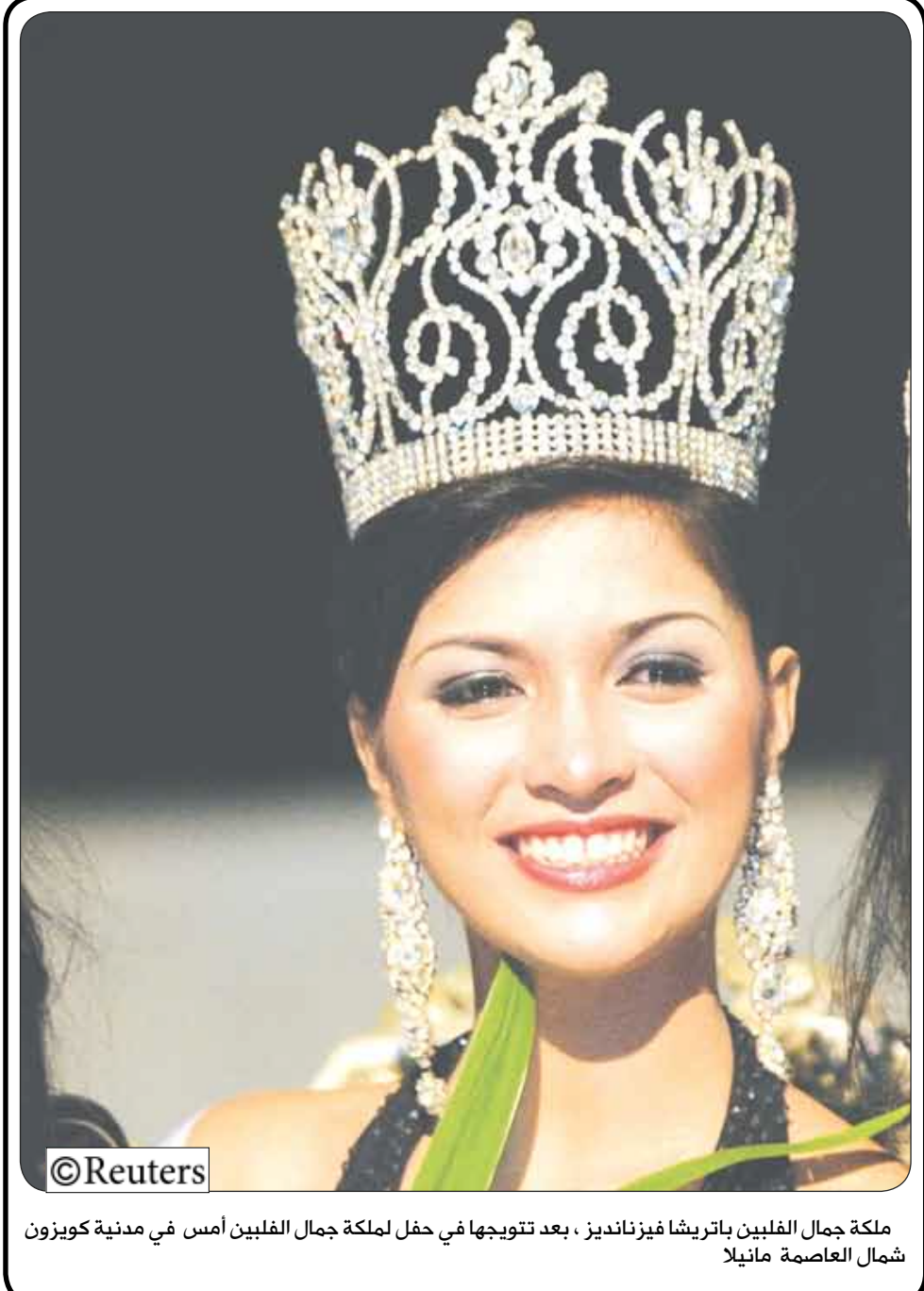
ملكة جمال الفلبين باتريشا فيز نانديز ، بعد تتويجها في حفل ملكة جمال الفلبين أمس في مدينة كويزون شمال العاصمة مانيلا

الضالع / منى الحضوري: أكد الأخ محمد صالح عبد الرحمن مدير عام مكتبات السياحة بمحافظة الضالع أن مؤشرات دعم وتنشيط الحركة السياحية بمحافظة الضالع إيجابية وفعالة مشيراً إلى أنه سيتم تنفيذ خطة العمل للعام الجاري 2008م كترجمة عملية للبرنامج الانتخابي لفخامة رئيس الجمهورية وفي إطار توصيات اللقاء التشاوري لقيادات العمل السياحي وبارشرف وتوجيه السلطة المحلية ووزارة السياحة . حيث سيتم إنشاء استراحة سياحية في الضالع على الخط العام. صنعاء - الضالع - عدن . وأوضح مدير عام السياحة بالضالع أن إنشاء هذه الاستراحة جاء بناء على توجيهات وزير السياحة لإنشائها واستكمال الدراسات والتصاميم الخاصة بها.