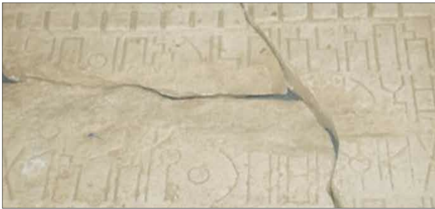
■ آثار يمنية