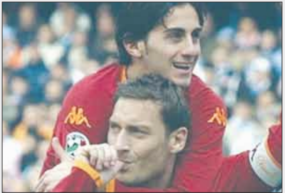
روما / متابعة / وكالات:

واصل روما الوصيف ضغطه على إنتر ميلان المتصدر وحامل اللقب في الموسم الماضي عندما تغلب على ضيفه نابولي 2-0 يوم أمس الأحد في المرحلة السابعة والعشرين من الدوري الإيطالي لكرة القدم. ويكرز روما، المنتشي ببلوغه الدور ربع النهائي لمسابقة دوري أبطال أوروبا على حساب ريال مدريد الإسباني، بالتسجيل منذ الدقيقة الثانية عبر سيموني بروتو، وعزز القائد فرانيسكو توتي التقدم بهدف ثانٍ من ركلة جزاء في الدقيقة 49 رافعاً رصيده إلى 13 هدفاً على لائحة الهادفين. وعزز روما موقعه في المركز الثاني برصيد 58 نقطة معيدا الفارق إلى 6 نقاط بينه وبين الأنتر الذي تغلب على ضيفه ريجينا التاسع عشر قبل الأخير بنتيجة ذاتها السبت في اقتتاح المرحلة.