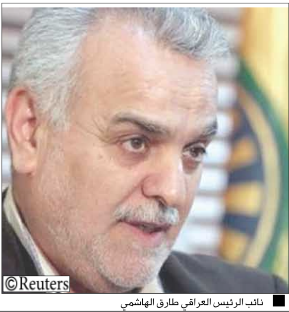
نائب الرئيس العراقي طارق الهاشمي

قال طارق الهاشمي نائب الرئيس العراقي أمس الأحد ان الخلافات مع رئيس الحكومة نوري المالكي ما زالت قائمة وان اللقاءات الأخيرة «لم تكن في تقري وجهات النظر» مع الجانبين.