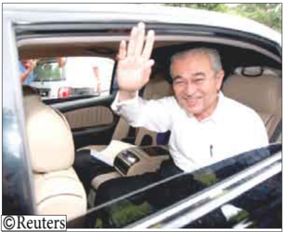
رئيس وزراء ماليزيا عبد الله بدوي

على الحكومة، وتابعت «ائتلاف باريسان الوطني يحكم منذ فترة طويلة وجان الوقت لمنع آخرين الفرصة». ويواجه عبد الله مستقبلا سياسيا غامضا وأصيب مساعوه بالذهول ولكنهم غير راغبين في الاعتراف بضرورة استقالته.