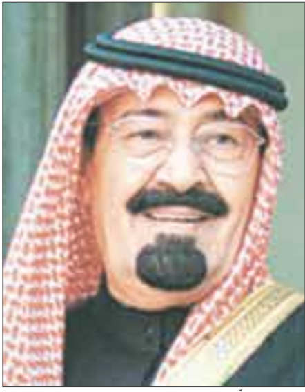
الملك عبد الله بن عبد العزيز

وابتكاراتهم لدعم تحول المملكة نحو اقتصاد المعرفة باعتبارهم ذخيرة الوطن للرقى والتقدم وسلاحه لاقتحام المستقبل. وأوضح أن «ابتكار 2008» يأتي في سياق سعي المملكة للدوب والمستمر لتوطيد المعرفة واستثمارها وتحول الابتكارات والأفكار إلى منتجات وعمليات ذات مردود اقتصادي وبعد اجتماعي من أجل دعم التنمية بشكل شامل ومستدام مشيراً إلى أهمية المعرض والشعار الذي يحمله وهو ( تنمية الابتكار لخدمة التنمية) على اعتبار أن وجود بيئة محفزة للإبداع تقوم على استثمار الأفكار والمواهب بشكل منهجي سلس يمدد الطريق لتحقيق ما نصبو إليه من تنمية وتقدم». وأكد أن «ابتكار 2008» يعد واحداً من أبرز الأحداث التي تشهدها المملكة خلال العام 2008، حيث يتزامن مع السعي الجاد من قبل العديد من الأجهزة الحكومية ومؤسسات المجتمع المدني في المملكة إلى نشر ثقافة المعرفة والتحول إلى مجتمع معرفي مبدع، في وقت تجري الاستعدادات لبدء أعمال جامعة الملك عبد الله للعلوم والتقنية كما يتم حالياً تنفيذ الخطة الوطنية للعلوم والتقنية والتطوير الكبير الخاصة بالجامعات السعودية، ما يدفع المملكة إلى أن تكون دولة معرفية تقنية متطورة مرتكزة على خطط تركز على أعداد كبيرة من العناصر الشابة الموهوبة المبتكرة تنضم بروح قيادية كبيرة من جهة أخرى أكد أمين عام المؤسسة ورئيس اللجنة المنظمة للمعرض الدكتور خالد بن عبد الله السبيتي أن رعاية خادم الحرمين الشريفين الملك عبد الله بن عبد العزيز آل سعود رئيس المؤسسة حفظه الله، المعرض تعد تشريفاً لكل موهوب وموهوبة، ومخترع ومخترعة، كما أنه يمثل دعماً حقيقياً للموهوبين والمخترعين والمبتكرين.