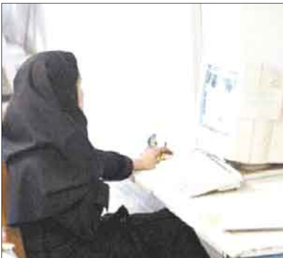
تدريب وتأهيل على الحاسوب

العملية أو النظرية خاصة وأن هناك تطورا مضطربا وسريعا على المستوى العالمي ، لذلك لا بد من أن يكون المدرب مؤهلا حتى يواكب هذا التطور ، والملاحظ إلى حد ما أن كثير من الدورات تذهب للعاملين الإداريين ويفترض أن تكون للعاملين في الميدان وبحسب التخصصات ، وأنا كمدرّب ميداني لم أحصل على دورة واحدة بالرغم من نزول استمارات ورفعنا ، ولكن لم تلمس شيء ، ونتمنى أن نحصل على دورات في المستقبل .