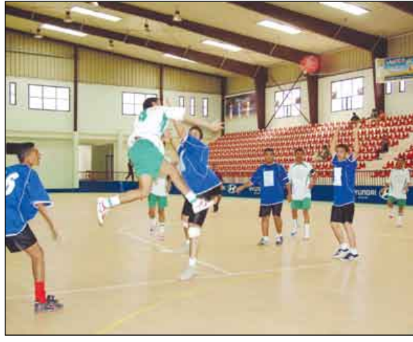
لقطة لكرة اليد

بالأمانة - هلال الحديدية - شباب البيضاء). في حين ضمنت المجموعة الثانية كل من (اتحاد سيئون - شرارة لبح - سلام معبر - اتحاد إب - شروق تعز) . وفي مباريات اليوم الأول للبطولة فاز اتحاد سيئون على فريق اتحاد إب بنتيجة (26 / 15) . كما تغلب 22 مايو صنعاء على تضامن المكلا بـ/18 نقطة مقابل 16 نقطة، في حين خسر الشروق من تعز أمام السلام من معبر بنتيجة (14 / 22) وفوز الفجر على هلال الحديدية 9 / 19 وفوز الجلاء مئة عدن على شباب البيضاء 12 / 15 .