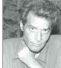
■ الشاعر/نجيب سرور

من غير قصد يمنح كتاب « نادر» عن ثلاثية نجيب محفوظ كثيراً من الثقة والأمل للكتاب الشبان الذين يتجاهلهم النقاد طويلاً إذ يقول مؤلفه الشاعر المصري الراحل نجيب سرور أن قوة لا تستطيع إلغاء الكاتب الحقيقي بدليل بقاء أعمال محفوظ رغم محاولات تهميشه وتجاهله.