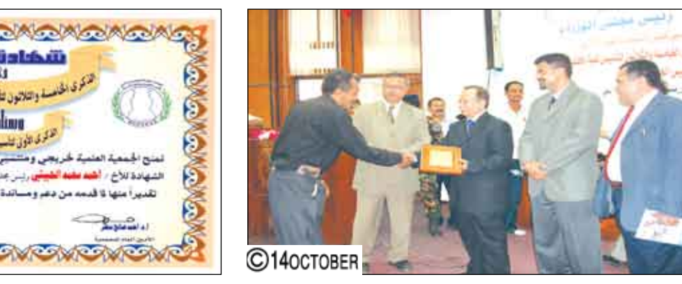
مدير أمن محافظة عدن