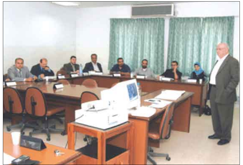
تدريب وتأهيل على المصارف