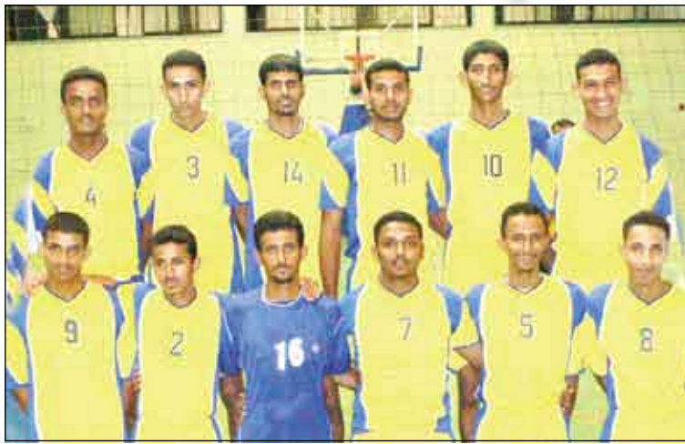
مباريات الجولة العاشرة : الخميس 13 مارس : 1 - الميناء X الشعلة 2 - أهلي الغيل X الشرطة 3 - هلال السويدي X سيئون 4 - شباب القطن X اتحاد حضرموت الجمعة 14 مارس : 1 - الصقر X أهلي الحديدية

بالقرب، وبات الشرطة مهددا بشيخ الهبوط لأول مرة بعد ابتعاد أبرز لاعبيه، عن الفريق وفي مقدمتهم قائده السابق عادل الداني. وظهر جلياً وجود رغبة قوية من فريق الصقر الذي عزز صفوفه هذا الموسم ببعض أفضل اللاعبين من الأندية الأخرى للمنافسة على اللقب، وهو في المركز الثالث، خلف شباب القطن الذي حقق اللقب في الموسم قبل الماضي لأول مرة، ثم أخفق في أول حملة للدفاع عن لقبه أمام أهلي الحديدية في الموسم الماضي وما زال يفرض نفسه في المقدمة. وفيما يلي ترتيب فرق الدوري قبل بدء مباريات الإياب: 1 - الشعلة : 18 نقطة (+ 142) 2 - شباب القطن : 16 نقطة (+ 114) 3 - الصقر : 16 نقطة (+ 97) 4 - اتحاد حضرموت : 15 نقطة (+ 58) 5 - أهلي الحديدية : 14 نقطة (+ 75) 6 - الميناء : 13 نقطة (- 45) 7 - سيئون : 12 نقطة (+ 3) 8 - هلال السويدي : 12 نقطة (- 146) 9 - الشرطة : 10 نقاط (- 146) 10 - أهلي الغيل : 9 نقاط (- 177)