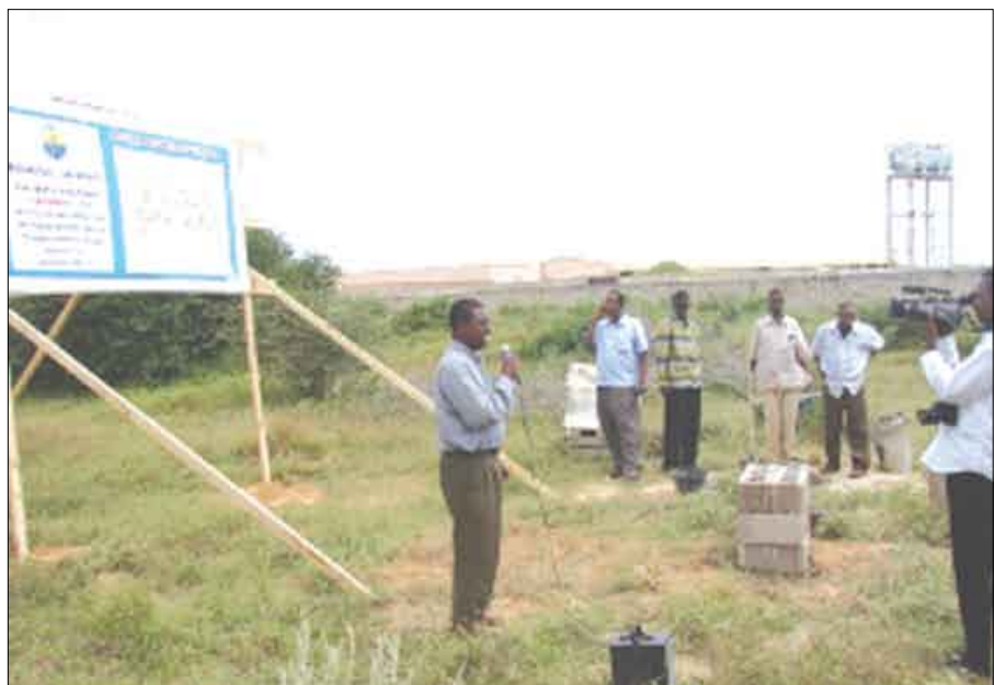
تدريب على الزراعة