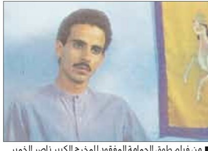
■ في فيلم ملوق الحمامة المقفول للمخرج الكبير ناصر الخمير

والتي هذا المهرجان الصغير الخاص بالسينما التونسية في باريس بينما يبدو مهرجان بينالي السينما العربية في معهد العالم العربي مهدداً كثيراً بعدما نشأت «بانوراما السينما المغربية» التي تنظم هذا العام في نيسان/أبريل 2008 دورتها الثالثة.