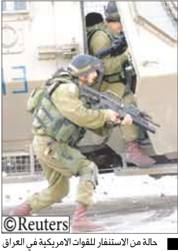
حالة من الاستنفار للقوات الأمريكية في العراق

لإذاعة الجيش الإسرائيلي ان «الشرطة أبقث على حالة الاستنفار خصوصا في القدس وتملك معلومات حاليا عن استعدادات لاعتداءات محددة لكن يجب علينا أن نأخذ في الاعتبار خطر ان يعزز هذا الاعتداء (في القدس الغربية) من دوافع ارتكاب عمليات إرهابية أخرى.»