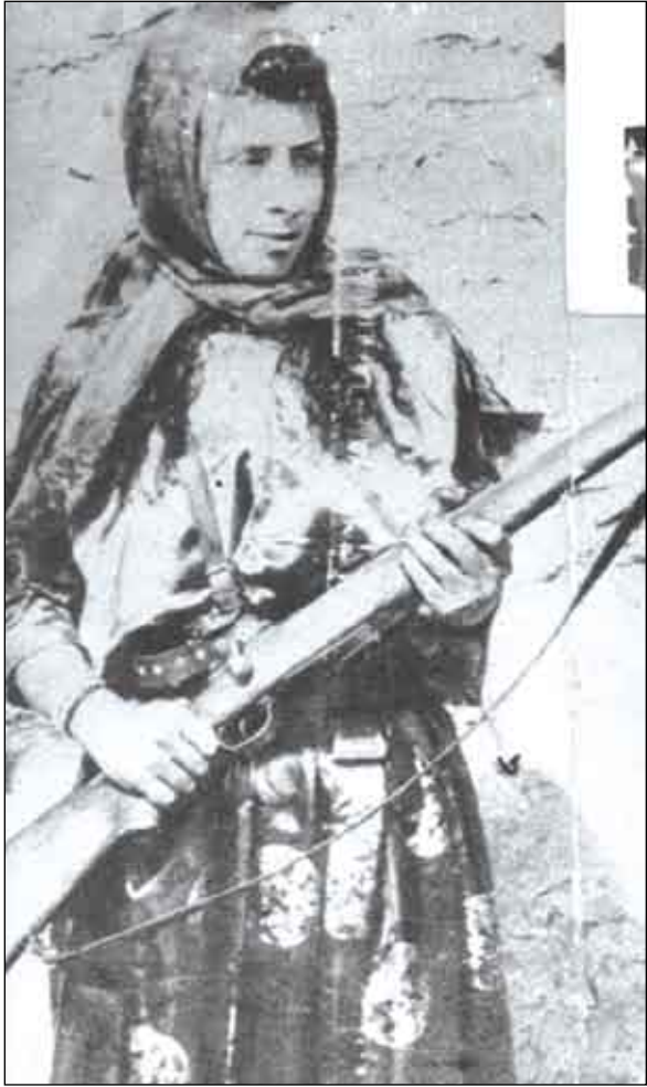
المرأة اليمنية أثناء الكفاح المسلح

يكون لها دور فعال وإيجابي وأن يكون لها ثقل ثقافي وأن يكون لها إسهام في تحقيق المساواة، لاسيما أن المرأة مثل الرجل يحتفل بهذه المناسبة لأنها عاملة تعمل لخدمة الوطن والبلد ولأنها كيان لا يستطيع الرجل العمل دونها، لذلك يجب أن لا يضيع المجال على المرأة في العمل الثقافي، والعمل على المطالبة بحقوق العاملة بشكل عام، ولذلك نتمنى المزيد من الاهتمام بشؤون المرأة كونها تعمل بصدق وضمير .