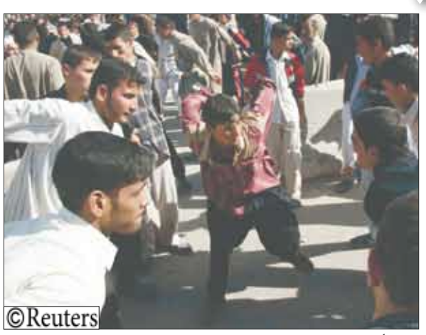
أحدى الطقوس الشيعية