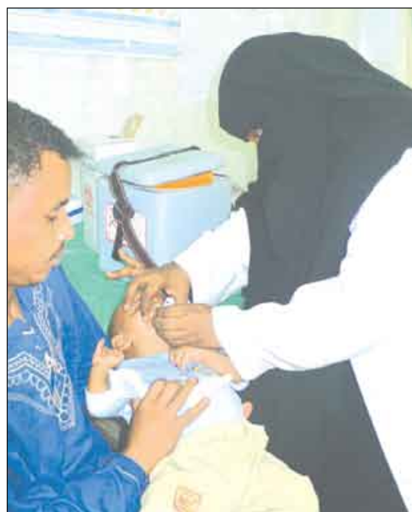
المرأة في المجال الصحي

الثامن من مارس يوم عظيم بالنسبة لنا كنساء وهو اليوم الذي يعطي للمرأة تميزا تشعر فيه بأنها أخذت جزءا من حقوقها على مستوى الساحة العملية وأن لها دورا إيجابيا فعلا ونحن نشكر كل من يدعم المرأة في كل المجالات وأصبح للمرأة شأنها في إدارة شؤون الحياة العامة ولاغربة أن للمرأة دورا عظيما قد يفوق دور الرجل وخصوصا في تربية وتنشئة الأجيال وطبيعة الحياة سواء في الأسرة أو المجتمع. وقد وصلت المرأة إلى الكثير من الطموحات التي كانت بالأمس حلما واليوم أصبحت حقيقة وذلك برعاية فخامة الأخ الرئيس علي عبدالله صالح الذي بدوره أعطى كل الاهتمام والأولوية للمرأة، حيث تمكنت المرأة من ممارسة الأنشطة على كافة المستويات الاجتماعية والاقتصادية والسياسية) وغيرها من الجوانب الهامة في حياتها، وأصبحت اليوم استاذة وكتورة وممرضة وعاملة بل وصلت إلى السلطة المحلية والسلطة التنفيذية واليوم يسعدنا أنه أيضا تم تعيين أكثر من امرأة في مجال القضاء، وهذا إنما يعكس مستوى الوعي الفكري والمعرفة النوعية التي وصل إليها الشعب اليمني بالإضافة إلى الكثير من الطموحات التي تحققت .. فالمرأة لها وجود لا يستطيع أي إنسان أن يتجاهله، وكما هو معروف فإن أي بلد ومجتمع لا يمكنه النهوض والتنمية دون أن يكون هناك كيان اسمه المرأة فالمرأة تتمنى في هذه المناسبة أن