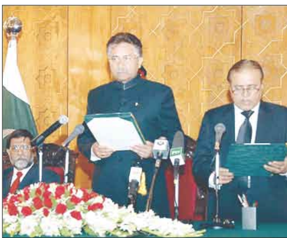
مشرف خلال الدعوة لانعقاد البرلمان الجديد

كل الأطراف إلى العمل معاً. تجدر الإشارة إلى أن مشرف أصدر قراراً في نوفمبر الماضي بتفكيك كيان وتعيينه قائداً للجيش بعد تنحيه من هذا المنصب. وفي هذا السياق أقر حزب الشعب إعلان اسم مرشحه لمنصب رئيس الوزراء، لكن زعيم الحزب أصف علي زرداري أمرل بينظير بوتو غير مؤهل لأنه لا يشغل مقعداً برلمانياً. ويتوقع على نطاق واسع أن يتولى المنصب نائب زعيم الحزب مشرف علي فهميم، ويجري حزب الشعب محادثات ائتلاف مع حزب نواز شريف الذي أطاح به مشرف في انقلاب عام 1999. وأثارت التقلبات السياسية التي تشهدها البلاد قلقاً دولياً بشأن مخاطر الاستقرار في الدولة التي تمتلك أسلحة نووية، بعدما شهدت باكستان منذ منتصف 2007 حملة تفجيرات انتحارية دامية.