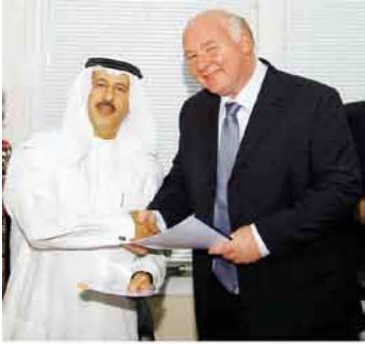
مركز التميز والتطوير المؤسسي يوقع ميثاقاً مع كويست للاستشارات شعار مجلس التعاون