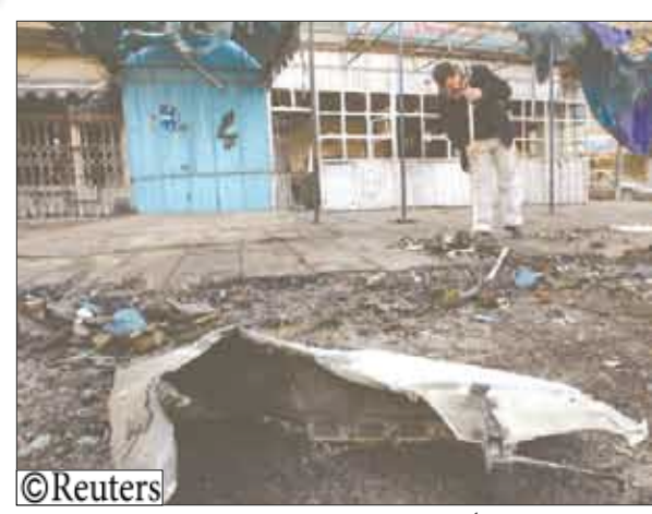
تنظيف مسرح إحدى العمليات الانتحارية