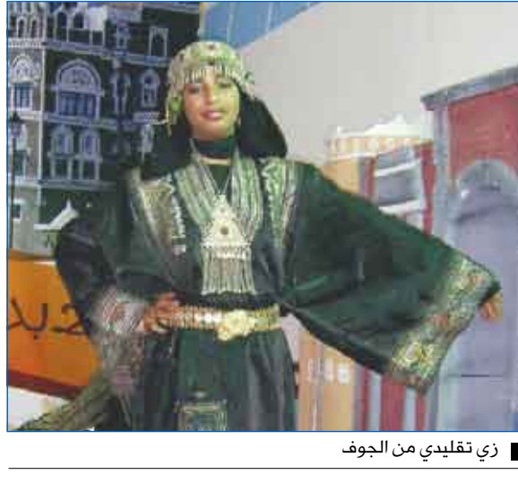
زي تقليدي من الجوف

أما في جناح الأزياء الشعبية فيكتشف الزائر أسراراً حيث كان يعيش الأجداد الزخرفة في بيوتهم وأزيائهم ويعكس الفن المعماري والزخرفة الدقيقة لليمني والأزياء الشعبية وتطريزها حب اليمنيين للجمال والادراكهم الفطري بمقومات وعناصر فنون الزخرفة