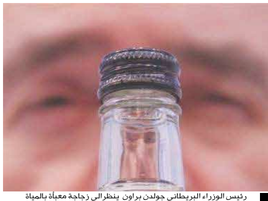
رئيس الوزراء البريطاني جوردن براون ينظر إلى زجاجة معبأة بالمياه

لندن / 14 أكتوبر / رويترز: لن تقدم مياه الشرب المعبأة في زجاجات أثناء اجتماعات الحكومة البريطانية وذلك بمقتضى سياسة لحماية البيئة أطلق عليها « مياه الصنبور فقط».