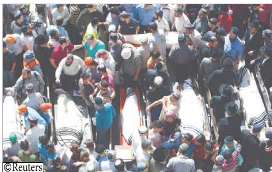
جانب من القتلى اليهود للعمليات الانتحارية

إطلاق نار من سلاح الي استخدمه المسلح حين اقتحم مكتبة المدرسة. ومدرسة مركز هاراب هي قاعدة إيديولوجية لحركة الاستيطان اليهودي في الأراضي الفلسطينية. وعرف سكان من القدس الشرقية المهاجم باسم علي أبو العظيم. ورفرت رايات حماس وجماعات إسلامية أخرى على منزله بعد ما اتضح أنه عملية انتحارية. وأقرت الحكومة الإسرائيلية إنها لن تتحرف عن مفاوضات السلام رغم الغضب الشعبي. غير أن راديو الجيش الإسرائيلي نقل عن أفي ديتشر وزير الأمن الإسرائيلي قوله أنه يتعين إبعاد الفلسطينيين العدوانيين من القدس إلى الضفة الغربية. وأدان الرئيس الإسرائيلي شمعون بيريس الهجوم