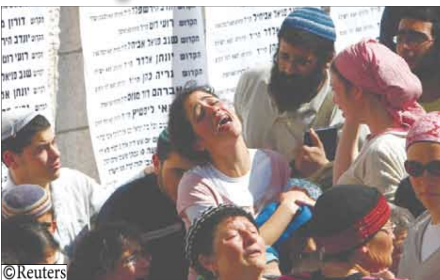
حالة من الازدحام في الشارع الاسرائيلي