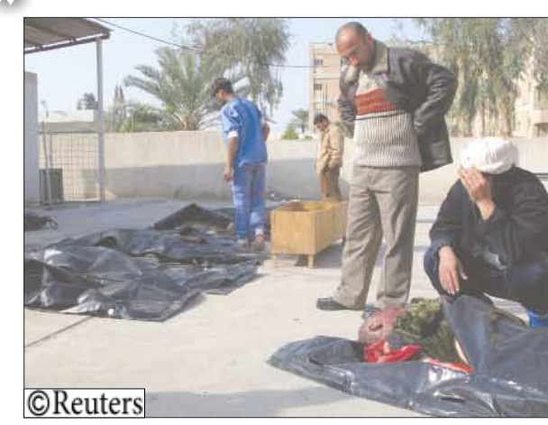
جانب من قتلى التفجيرات في بغداد

عبوتين ناسفتين قرب منزل أحد عناصر الشرطة في منطقة النبي شيت وسط المدينة، وفق ما ذكرت مصادر الشرطة. وتأتي هجمات الموصل في وقت ارتفع فيه عدد ضحايا التفجيرات المتعاقبين اللذين وقعوا في حي الكرادة التجاري المزدهم وسط بغداد مساء أمس الأول إلى 68 قتيلاً ونحو 130 جرحياً بينهم العديد من الأطفال والنساء وقوات الأمن. وأوضح المتحدث باسم حطة بغداد الأمنية العميد قاسم الموسوي أن الانفجارين اللذين نتابعا بفارق دقائق ووقعا في منطقة تتوسط شارع العطار في حي الكرادة التجاري، متهما «إرهابيي شبكة القاعدة باستهداف المدنيين الأبرياء». وأفاد شهود العيان بأن أشلاء المتضررين تناثرت في أرجاء المكان وأن واجهات الجدران والمحال والمباني دمرت جراء