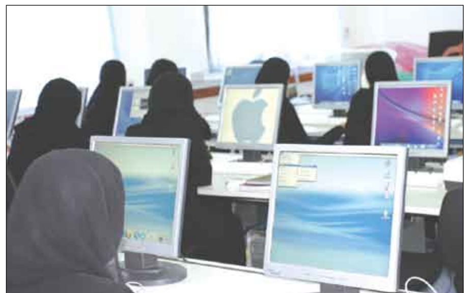
المرأة تواكب العصر في مجال الكمبيوتر

30 مقعدا في مجلس النواب للمرأة لاتكفي ولا بد لها أن تحصل على المزيد والمزيد من مواقع صنع القرار وأتمنى في القريب العاجل أن تحصل على حقبة القضاء والاقتصاد وغيرها من الحقائب أي إلى جانب حقيبتي الشؤون الاجتماعية والعمل