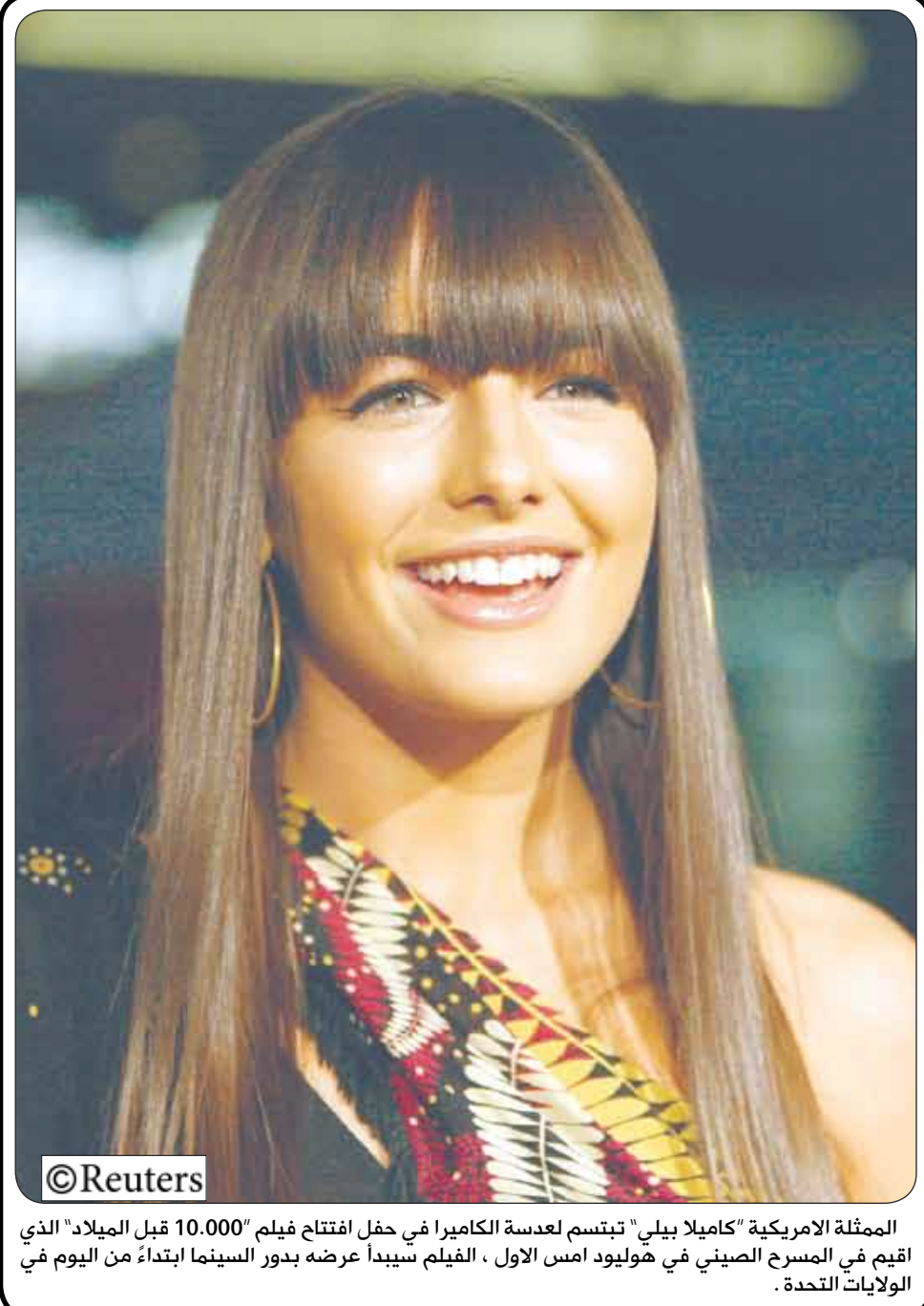
الممثلة الامريكية "كاميلا بيلي" تبتسم لعدسة الكاميرا في حفل افتتاح فيلم "10.000 قبل الميلاد" الذي اقيم في المسرح الصيني في هوليود امس الاول ، الفيلم سيبدأ عرضه بدور السينما ابتداءً من اليوم في الولايات المتحدة .

بقية الأجنحة العربية والأجنبية المشاركة في المعرض. ويجسد جناح اليمن في تصميمه وديكور الهندسي شكل مجسم ضخم لبوابة اليمن الشهيرة، وواجهات مدينة صنعاء التاريخية القديمة بطابعها المعماري الخاص، وكل ما تشي به من عزة وشموخ، والتي تمتد عمرها إلى تاريخ تشييد مدينة صنعاء القديمة في عهد سام بن نوح عليه السلام. وكان جناح اليمن الواقع على مساحة 200 كم 2 ، بمثابة محطة مهمة ورئيسية لعقد اللقاءات والمباحثات وربط علاقات جديدة وعقد صفقات واتفاقيات عمل مهمة للبعوض، واستراحة للبعوض الآخر، وتزخر بالجديد والممتع للكثيرين من هواة المعرفة والجديد والشيق من تراث الشعوب ورصيدها الحضاري والثقافي والتاريخي والإنساني. واتسع الجناح لمجاميع كبيرة من زوار المعرض من مختلف