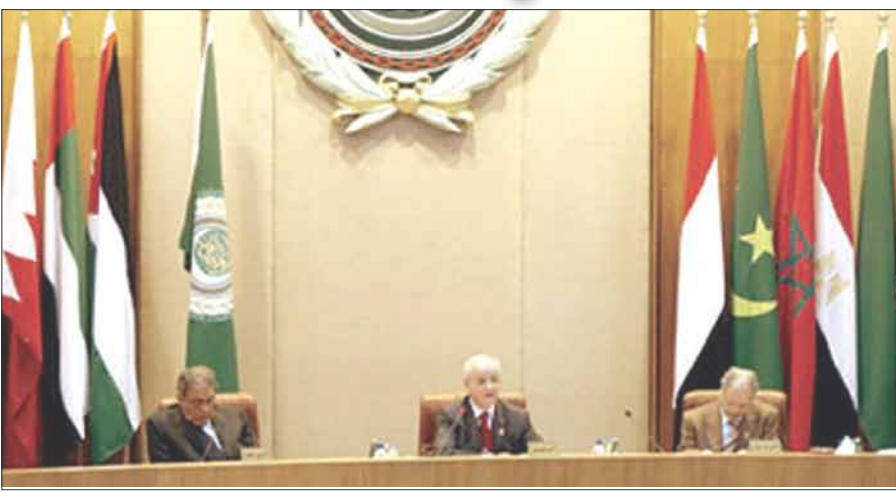
اجتماع وزراء الخارجية العرب

الوزراء اللبنانيين في وقت تعيش فيه البلاد فراغا رئاسيا.