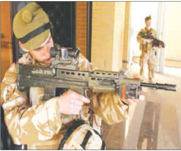
بعض من جنود التحالف في العراق