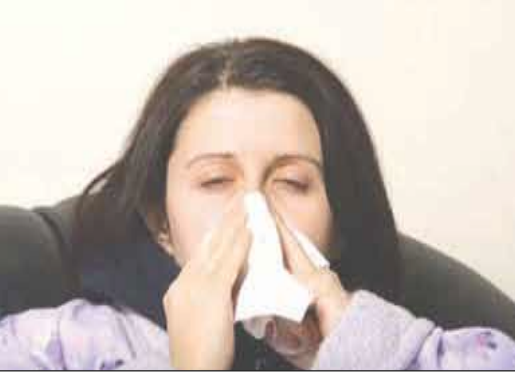
الأنفلونزا في الشتاء