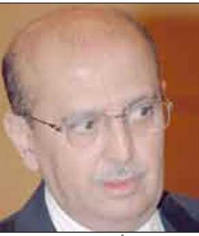
الدكتور / أبو بكر القربي

و دعمه بالمزيد في مرحلة الخطة الخمسية الرابعة والتي ستبدأ في عام 2011م وكذا دفع مزيد من الاستثمارات الخليجية إلى اليمن وأضاف أن هذا الاجتماع المشترك قد فتح آفاقاً للتعاون في المجالات الأمنية مع دول الخليج على مستوى التعاون القائم بين اليمن ومجلس التعاون. وكان الاجتماع المشترك لوزراء خارجية مجلس التعاون وقال القربي في تصريح لوكالة الأنباء اليمنية (سبأ) لدى عودته إلى صنعاء أمس أن هذه توجهات قيادة دول مجلس التعاون وأخيه فخامة الرئيس علي عبدالله صالح