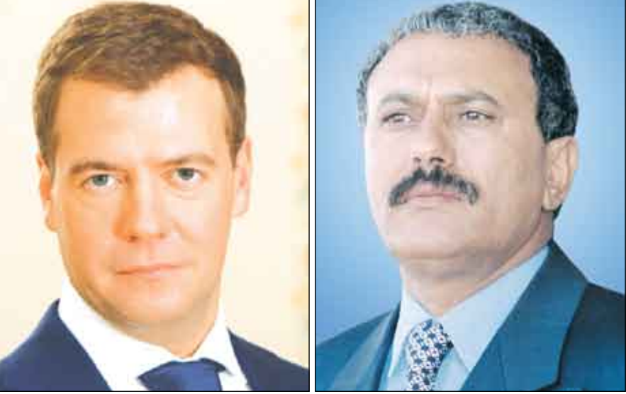
صالح / سبأ

بعث فخامة الأخ الرئيس علي عبدالله صالح رئيس الجمهورية برقية تهنئة لفخامة الرئيس الروسي الجديد جاء فيها: فخامة الرئيس دميتري ميدفيديف الأكرم يسرني أن أبعث إلى فخامتكم باسمي شخصياً وباسم شعب الجمهورية اليمنية بأطيب التهاني وأصدق الأمنيات بمناسبة انتخابكم رئيساً لجمهورية روسيا الاتحادية وفوزكم بثقة الشعب الروسي الصديق الذي عبر عن إرادته الحرة في اختياركم لقيادة التحولات وهماصلة مسيرة التطور والنهوض في بلدكم التي بدأها فخامة الرئيس فلاديمير بوتن. وتعزير دور روسيا الاتحادية كقوة قطبية فاعلة في تحقيق التوازن الإسترأجي في العالم.