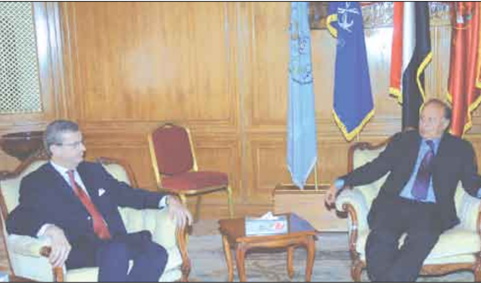
نائب الرئيس لدى استقباله مدير شركة «توتال»

أكد الأخ عبدربه منصور هادي نائب رئيس الجمهورية الدعم الكامل لشركة توتال للاستكشافات النفطية والغازية في مهامها من أجل التوسع في مجالات استثماراتها وتشمل مختلف المناطق. وأعرب نائب رئيس الجمهورية خلال لقائه أمس مدير الشركة / ايف لوي داغياغيج / عن أمله في أن توسع الشركة مجالات استثماراتها لتشمل إنتاج الطاقة الكهربائية سواء في مجال حقول النفط والغاز أو على مستوى توليد الطاقة. وأضاف أن شركة توتال لديها طموحات أكبر بالإنتاج الغازي وبما يتجاوز 100 ألف برميل يومياً للعمل على المستوى الإقليمي وتوسيع مجالات الإنتاج بصورة متزايدة... منها في هذا الصدد إلى أن طموحات الشركة ونتائج أعمالها جيدة جداً ومحل