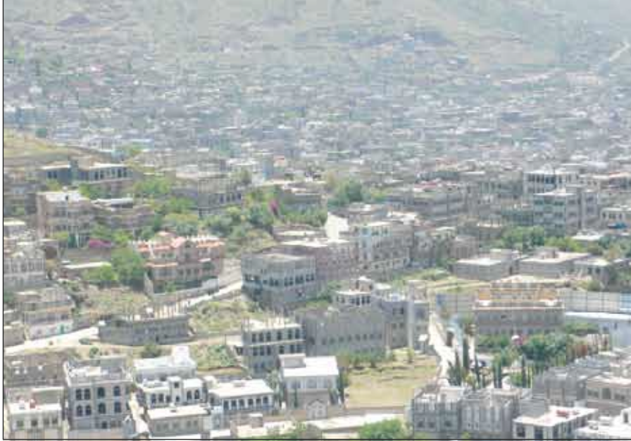
جانب من إب