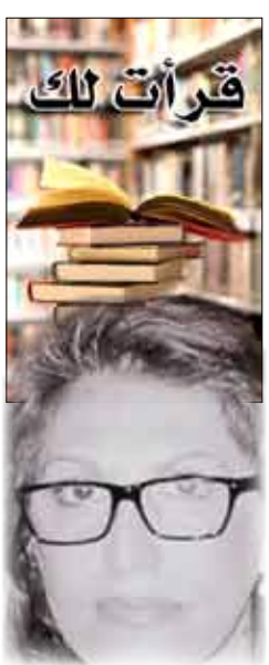
الشاعرة العراقية شعباد جبار