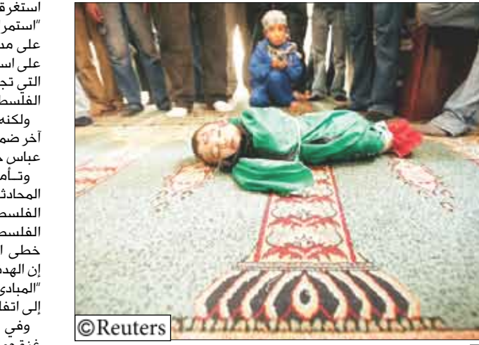
رضيع اخر ضحايا القصف الاسرائيلي

إلى أن شن عملية برية كبرى في قطاع غزة ليس وشيكا قاتلا إن قتل إسرائيل مع النشطاء "عملية طويلة" وأنه ليس هناك "صيغة سحرية" لوقف الهجمات الصاروخية عبر الحدود. وقال عاملون في المجال الطبي إن ستة فلسطينيين منهم خمسة على الأقل من النشطاء قتلوا في هجمات جوية أمس الخميس في قطاع غزة. وأطلقت حماس يوم الأربعاء الماضي صاروخا على بلدة سدبروت الحدودية بعد مقتل خمسة من كبار أعضاء الحركة في غزة جوية إسرائيلية استهدفت سياراتهم مما أسفر عن مقتل مدني إسرائيلي وهو أول إسرائيلي يقتل منذ مايو. وقال الجيش الإسرائيلي إن 21