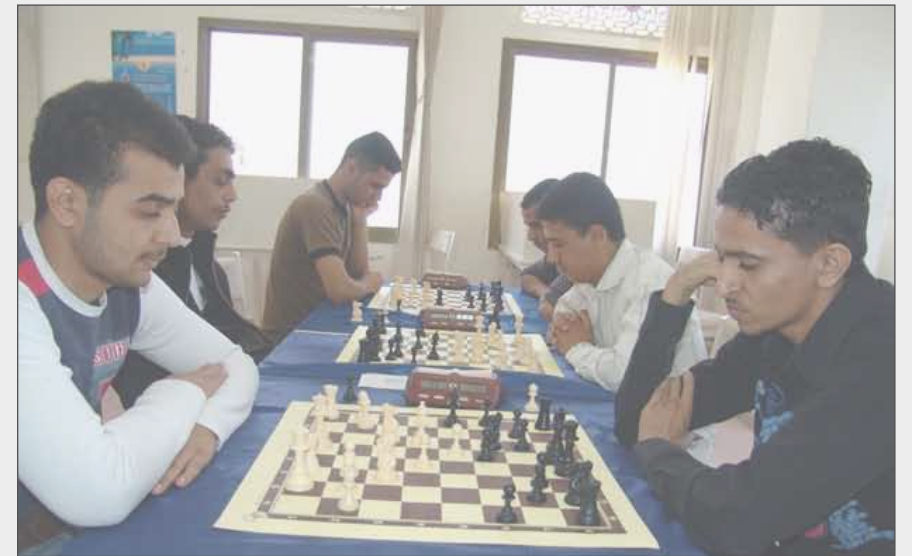
تعز / نعايم خالد