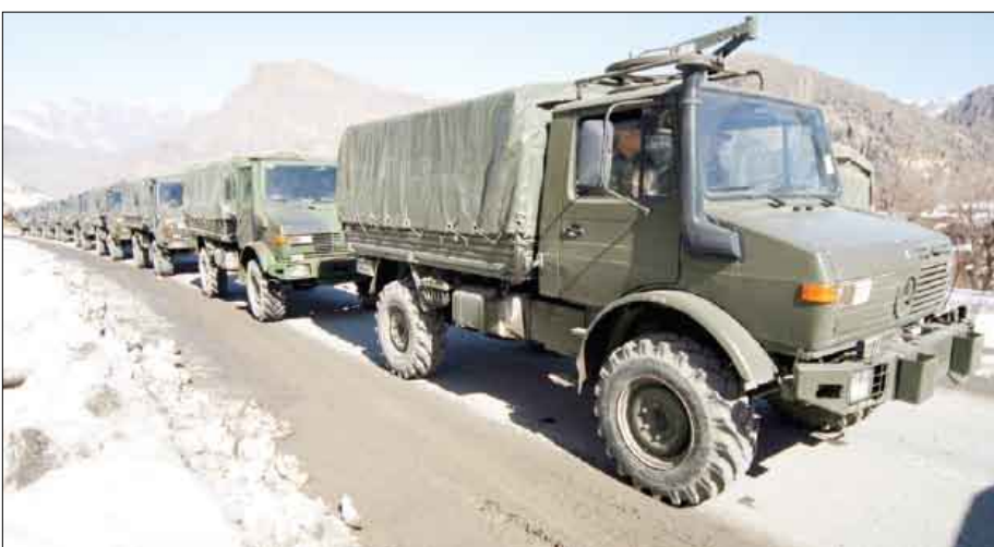
جانب من حشد القوات التركية على الحدود العراقية

لكنها قالت إن الطيران والمدفعية واصلا لعمليات القصف. يشار إلى أن 37 ألف قتيل سقطوا منذ بدء حزب العمال الكردستاني سعيه عام 1984 لتأسيس وطن مستقل للأكراد، وقد وضعت تركيا والاتحاد الأوروبي والولايات المتحدة الحزب على لائحة المنظمات الإرهابية. وفي المقابل أشارت آخر حصيلة أصدرها حزب العمال الكردستاني الأربعاء الماضي إلى مقتل 108 جنود أترك، دون تحديد عدد القتلى في صفوفه. كما قال الجيش التركي إنه دمر 312 من مواقع حزب العمال وإن المدفعية قصفت 523 هدفا منذ