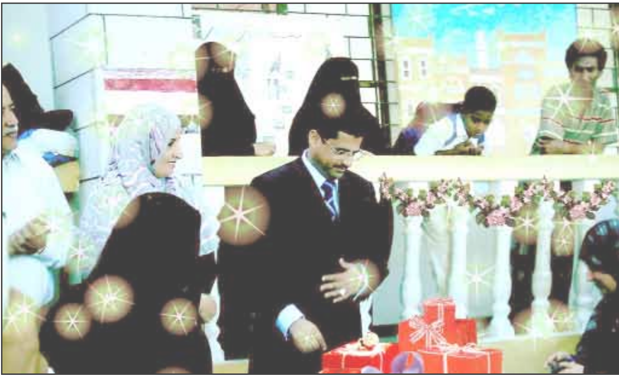
من الحفل في مدرسة فاطمة الزهراء

النجاحات التي حققتها أثلجت صدورنا فدافنوها عليها