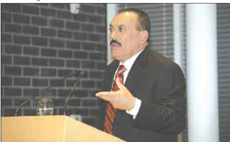
رئيس الجمهورية أثناء ألقاء محاضرته

أكد فخامة الأخ الرئيس علي عبدالله صالح رئيس الجمهورية أن الوحدة اليمنية قامت على الحرية والديمقراطية ومشاركة المرأة واحترام حقوق الإنسان وحرية الصحافة، وقال: هذه المبادرة كانت تمثل خطوة غير مألوفة في المنطقة وذلك جاءت الأحداث والأزمات التي واجهتها اليمن خلال الأعوام 92 - 93 - 94 ولكن بحمد الله ترسخ نظام الجمهورية اليمنية. جاء ذلك في المحاضرة الهامة التي القاها فخامة الأخ الرئيس الجمهورية مساء أمس في العاصمة الألمانية - برلين - أمام عدد من الفعاليات السياسية والثقافية والأكاديمية ورجال الأعمال والسفراء العرب والأجانب. وتناولت المحاضرة العلاقات اليمنية الألمانية ونتائج مباحثات فخامته مع المسؤولين الألمان، بالإضافة إلى تناول منجز الوحدة اليمنية وتحقيقها بالطرق السلمية والتطورات السياسية والاقتصادية والثقافية والاجتماعية في اليمن بالإضافة إلى العديد من التطورات الإقليمية والدولية.