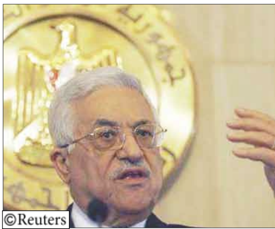
الرئيس الفلسطيني محمود عباس

ووشددت إسرائيل حصارها على قطاع غزة في يونيو بعد أن تغلبت حماس على قوات حركة فتح الموالية للرئيس الفلسطيني وسيطرت على القطاع الذي يسكنه 1.5 مليون فلسطيني. وترفض السلطة الفلسطينية الحوار مع حماس قبل أن تعود عن "انقلابها". ورحب عباس بمبادرة يمنية جديدة أطلقها الرئيس اليمني علي عبد الله صالح للحوار بين حركتي فتح وحماس لتعود حماس عن الانقلاب وأن يتم إجراء انتخابات نيابية مبكرة. وقال عباس إن الكفاح المسلح ليس خيارا الآن بسبب عدم قدرة الفلسطينيين عليه وعلى أشرف إلى إمكانية تغيير الأمور في المستقبل. وأضاف "في الوقت الحالي أنا ضد الكفاح