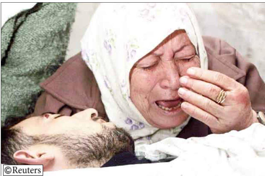
ام تبكي ابنتها

تلك الصواريخ التي تطلق.. وما هي إلا ألعاب نار.. ولكنها في النهاية تقتل مدنيين إسرائيليين. وأضاف "ولكننا في الوقت ذاته ندين كل التبولات الإسرائيلية داخل غزة وقتل المدنيين الفلسطينيين وتمجير منازلهم ومنعهم من التمتع بحياة طبيعية". وفي بلدة نابلس بالضفة الغربية قال مسؤول في مستشفى وسكان إن القوات الإسرائيلية قتلت اثنين من الناشئة في غزة على مخيم بلاطة للاجئين. وقالت المتحدثة باسم الجيش الإسرائيلي إن الجنود فتقوا النار بعد أن رصدوا رجلا مسلحا يهددهم.