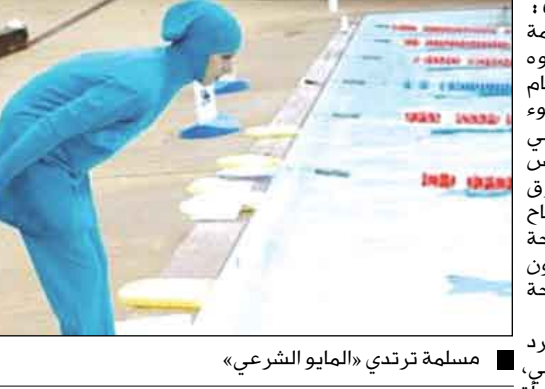
مسلمة ترتدي «المايوه الشرعي»

كانت ترتدي ملابس السباحة الخاصة بالنساء المسلمات أو «المايوه الشرعي» الذي يعرف أيضاً بـ «البركيني»، مفادرة حوض سباحة هانزيباد في مدينة زول، عاصمة إقليم أوفيرجيسيل على بعد 120 كيلومتراً شمال شرقي أمستردام. وكان مجلس بلدية زول قد قرر الليلة قبل الماضية بأن يسمح للسباحات يرتداء ال «بركيني»، الذي يغطي معظم الجسد ويظهر فقط الوجه والقدمين واليدين، غير أن مسؤولي حمام سباحة هانزيباد أصروا الثلاثاء 26 - 2008، على عدم السماح بارتداء «البركيني»، قائلين أن تلك الملابس لا تتماشى مع القواعد الخاصة بملابس السباحة المسموح بها التي حددها مسؤولو حمامات السباحة.