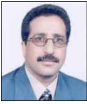
الدكتور / عبدالسلام الجوفي

أكد الدكتور عبدالسلام محمد الجوفي وزير التربية والتعليم أن الوزارة أنهت من إنجاز المرحلة الثانية لعام 2007 مودلك بمقر المنظمة الدولية للبن العالمية المتحدة البريطانية. وقع وتأتي التصديق سفير اليمن لدى المملكة المتحدة محمد طه مصطفى، وبحضور الأمين العام للمنظمة نيسور أوسوريو. ويهدا تعتبر الجمهورية اليمنية الدولة الأولى الموقعة على الاتفاقية، وتتوقعها تبدأ اليمن خطوات قانونية وتشريعية للتصديق عليها وإيداع وثائق التصديق لاحقا لدى المنظمة في موعد أقصاه 30 سبتمبر 2008م. وتشير مصادر المنظمة الدولية للبن إلى أن اليمن تنتج ما يقدره 250 ألف (عبوة 60 كيلو) سنويا من البن عالي الجودة ومن أفضل الأنواع المرغوبة في سوق البن العالمي.