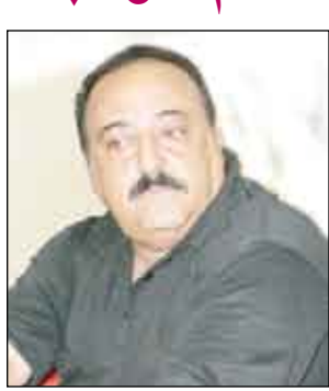
سالم صالح محمد

قال الأستاذ سالم صالح محمد رئيس اللجنة الوطنية لمعالجة الظواهر الاجتماعية السلبية وحماية الوحدة الوطنية إن اجتماعا ستعقده اللجنة الأسبوع المقبل يضم رؤساء ومفكري اللجان الفرعية لمناقشة التقارير والرؤى المقدمة إلى اللجنة حول مجمل القضايا الوطنية. وأضاف سالم صالح: إن اللجنة ستعد تقريرا شاملا للمقترحات والتوصيات التي من شأنها معالجة مختلف تلك القضايا وتقديمه إلى فخامة رئيس الجمهورية لبلت فيه. وأكد مستشار رئيس الجمهورية في