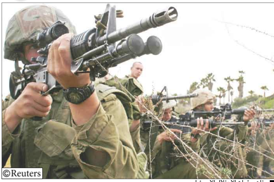
تأهب قوات الاحتلال الإسرائيلي