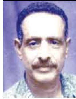
محمد عبد الجليل

حرب 1994م، كانت وبالأعلى الشعب اليمني، فكل التديعيات التي نعيشها اليوم، هي نتيجة منطقية لها، وكان بالإمكان تلافي هذه التديعيات، لو عالجنا أسبابها بعيداً عن توصيات البنك والنقد الدوليين، وبعيداً عن أي ضغوطات أو وصايا من أي جهة كانت، لاسيما وأن إنتاج النفط والغاز والمعادن النفيسة جاء بعد الوحدة لضمان استقرار الكيان الوطني الجديد والكبير كما كان موعداً له أن يكون، بالإضافة إلى التوسع في استغلال الأراضي للزراعة والاستفادة المثلى من الثروة السمكية في بلادنا الغنية بها، ولكن ذلك كله لم يحدث للأسف.