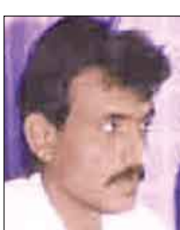
فضل علي مبارك

عندما قال أجدادنا الأقدمون حكمتهم "إن الإنسان عدو نفسه" لم يذهبوا بعيداً في ظلم الإنسان، بقدر ما قالوا حقيقة تجسدت معانيها في مضامين الواقع اليومي المعاش لهذا الحيوان الناطق من خلال جملة وقائع تفرز هذا السلوك والتصرفات التي تنم عن أن الإنسان عدو نفسه في كثير من جوانب حياته..