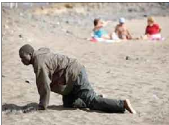
مهاجر أفريقي متعب يذبح بعد وصوله شاطئاً، تاراجاً في أسبانيا

لم يعد الأمر مقصوراً على الوافدين من دول الشرق الآسيوي، أو من المحيط العربي المجاور للخليج، فأصبحت الهجرة تحدث بين دول الخليج الصغيرة،