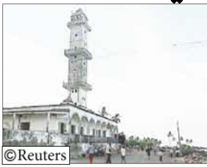
جزر عاصمة القمر

انفصال أي أرض إفريقية... وقال «شيء ما سيحدث في الأيام القادمة». وتوقع جزر القمر أمام الساحل الشرقي لإفريقيا وتحفظ جزرها بقدر من الحكم الذاتي من خلال قيادة محلية بموجب بنود اتفاق السلام لعام 2001 وتشترك أيضا في رئيس وطني يتولى الرئاسة بصورة دورية. وتعرضت جزر القمر التي يبلغ تعداد سكانها 700 ألف نسمة لنحو 19 انقلابا أو محاولة انقلاب منذ استقلالها عن فرنسا في عام 1975. وكان يسكنها البحارة العرب في البداية منذ ألف عام ثم أصبحت في وقت لاحق ملاذا للقرصنة.