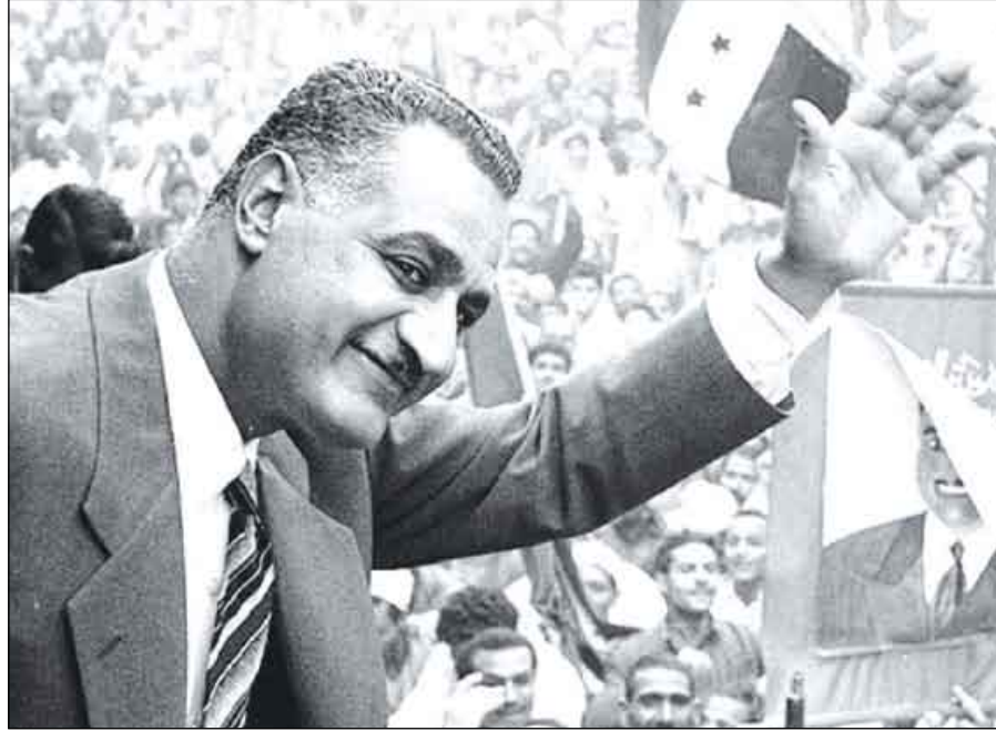
الزعيم جمال عبدالناصر تستقبله الجماهير

وشدد علي أنه نتيجة لذلك شارك المرأة في انتخابات 7591 وكان بذلك انتصار لمسيرة المرأة المصرية ولم يقتصر الأمر علي ذلك بل قرر عبدالناصر أن تدخل المرأة لأول مرة الوزارة فأمر بتعيين الدكتور حنيفة أبو زيد كوزيرة للشئون الاجتماعية