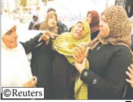
ام تيكى ابنها الشهيد

والأب لتسعة أبناء- هو تضخم في عضلة القلب، فيما أشارت مصادر أخرى إلى وفاته إثر إصابته بسكتة دماغية. على صعيد آخر اقترح وزير البنى التحتية الإسرائيلي بنيامين بن إيعازر الإفراج عن القيادي البارز في حركة التحرير الوطني الفلسطيني (فتح) مروان البرغوثي المسجون في إسرائيل، وذلك لتحقيق تقدم في عملية السلام مع الفلسطينيين. وأشار الوزير أمام تجمع في تل أبيب إلى أن البرغوثي هو الوحيد من قادة فتح الذي يتمتع برصيد شعبي يتيح له إقناع شعبي بتوقيع اتفاق مع إسرائيل. وكان بن إيعازر اقترح في سبتمبر الماضي مبادلة البرغوثي بالجندي الإسرائيلي الأسير جلعاد شاليت.