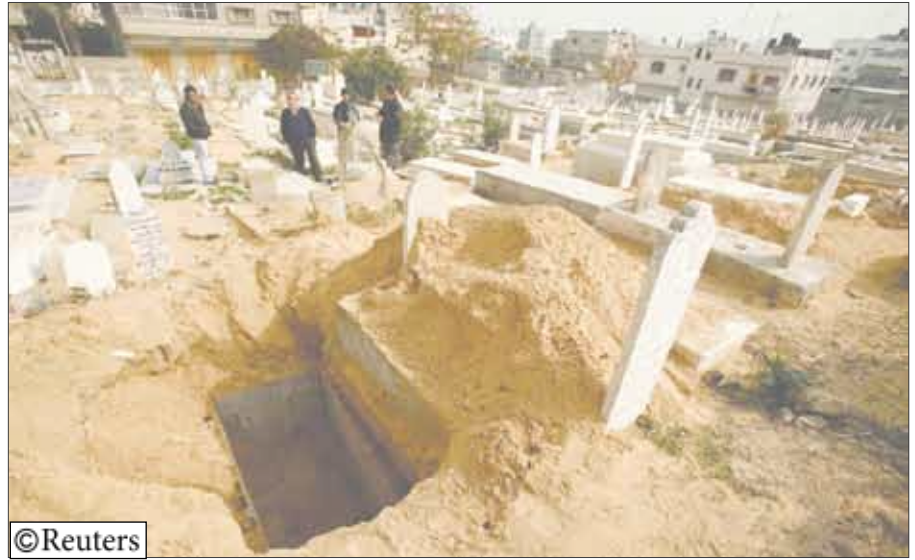
إحدى المقابر الفلسطينية في الأراضي الفلسطينية

بدره اعتبر العضو العربي الكنيست النائب جمال زحلقة أن ليس لديها الحق بالتصرف بأوقاف المسلمين لأنها لجنة عينت بقرار حكومي ولم تنتدب أو تنتخب من المسلمين في البلاد. وأضاف زحلقة أن المقابر لا تباع ولا تشتري، ولا أحد يخلو هؤلاء ببيع المقبرة أو أوقاف المسلمين المقدسة.