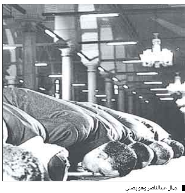
جمال عبدالناصر وهو يصلي

تشكل القضية السكانية أحد أبرز المشاكل التي تواجه عملية التنمية في دول العالم... وأن التزايد المستمر في عدد سكان تلك الدول يشكل حجر الزاوية في الاقتصاد وأيضا ارتفاع معدلات الإنجاب الذي هو أكبر التحديات لعملية التنمية وسببا أساسيا لتنامي معدلات الفقر.. وكذلك زيادة الطلب على القطاع الخدمي خصوصا الصحة والتعليم.. وأن هذه المعضلة السكانية ستكون لها آثار وانعكاسات سلبية على الموارد الطبيعية والاقتصادية.. وتشير احصائية إلى أن عدد السكان في بلادنا ينمو بنسبة 3و6 بالمائة وهي أعلى نسبة نمو في العالم وقد يزداد سنويا إذا لم تكن هناك معالجات لتحديد النسل ونوعيته ويمثل هذا أبرز تحدي يواجه عملية التنمية بأبعادها المختلفة وبخاصة في المجالات الاجتماعية والاقتصادية والصحية والتعليمية رغم أحقية الإنسان عليها باعتبارها ركن أساسية لبناء المجتمع.