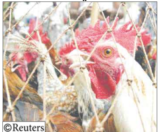
دجاج يعرض في أحد أسواق داكا

قال مسؤولون في بنجلادش إن أنفلونزا الطيور استفحلت في مقاطعة جديدة رغم عمليات الإعدام الضخمة من جانب السلطات لمحاربة التفشي القاتل مما يرفع عدد المقاطعات المتضررة إلى 44 من أصل 64 مقاطعة. وقال مسؤولو صحة الحيوان أمس الأحد إن التفشي الأخير لسلسلة اتش 5 من 1 أنفلونزا الطيور رصد في مونشيجاني على بعد 60 كيلومترا من داكا فيما عاود الفيروس الظهور في عدة مقاطعات أخرى.