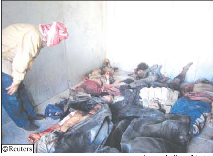
شهداء الهجوم الانتحاري جنوب بغداد

كربلاء/بغداد 14 أكتوبر/رويترز: قالت الشرطة العراقية إن مهاجما انتحاريا استهدف مجموعة من الشيعة في طريقهم لإحياء أربعينية الإمام الحسين وقتل 40 شخصا منهم نساء وأطفال جنوبي بغداد أمس الأحد.