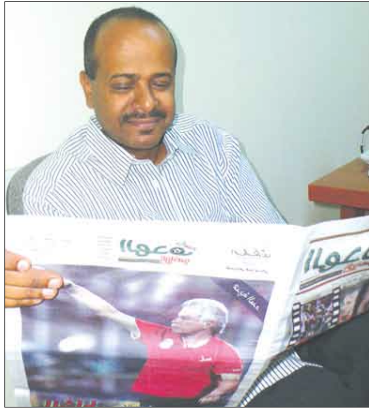
... والخليفي يبذل اعجابيه بالهدف الرياضي