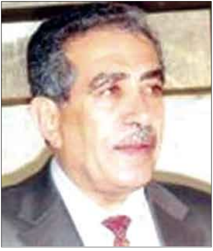
د. ابوبكر المفليح وزير الثقافة