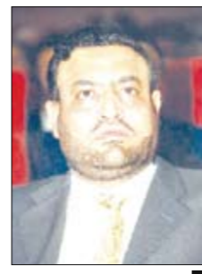
محمد عبد الوهاب وزير الشباب والرياضة

وقد ناقش الاجتماع الموسع الذي عقد بوزارة الشباب والرياضة التحضيرات الجارية لإقامة فعاليات مهرجان الحسينية السنوي للفروسية الذي سيقام بالحديدة خلال الفترة من ٢٥