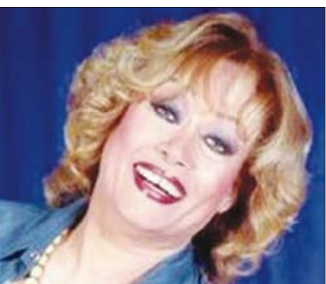
الفنانة هالة فاخر