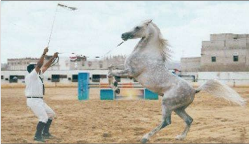
صورة من مهرجان الحسينية - سيات نت. (رشيف)