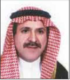
وزير الصحة السعودي

(شرق) سعة200 سرير بتكلفة إجمالية تبلغ80 مليون ريال وكذلك إنشاء ثلاثة مستشفيات جديدة تتمثل في مستشفى الولادة والأطفال بمنطقة تبوك (شمال) سعة200 سرير بتكلفة إجمالية120 مليون ومستشفى المجموم بسعة100 سرير بتكلفة80 مليون ريال. ويضاف إلى ذلك إنشاء مستشفى غرب الرياض بسعة300 سرير بتكلفة200 مليون ريال بالإضافة إلى إنشاء برج طبي بمستشفى الأمل لصحة النفسية بالطائف (غرب) سعة500 سرير بتكلفة إجمالية قدرها350 مليون ريال.