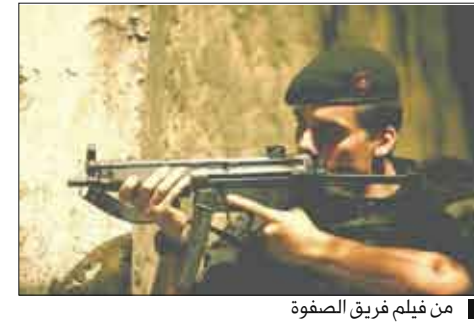
من فيلم فريق الصفوة

فاز الفيلم البرازيلي «فريق الصفوة» يوم السبت الماضي بجائزة الدب الذهبي بمهرجان برلين السينمائي عن أحسن فيلم مما سيستمر على الأرجح جلا بشأن قرار لجنة التحكيم. ويصور الفيلم الذي حقق بالفعل إقبالا كبيرا على مشاهدته في البرازيل الفساد والعنف.