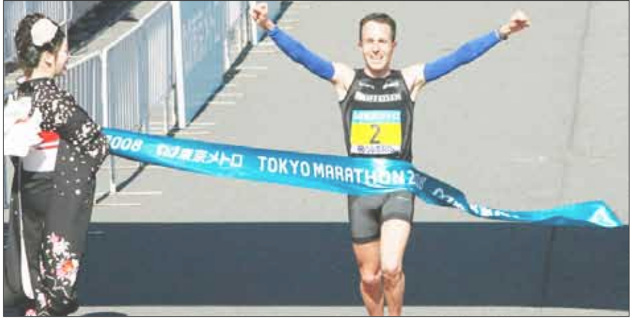
السويسري فيكتور روثلين