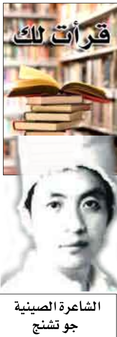
الشاعرة الصينية جو تشنج

كان ببطء يصعد بقلوب كثيرين يترك بالخلف طالب تذهب لون الدم مات الآن تحت جبال جرائد يرقد ومن الصعب التخمين فالكلمات بلا حصر مثل تجمع نمل يتناقش كيف سيمنع أن يُبعث ثانية!