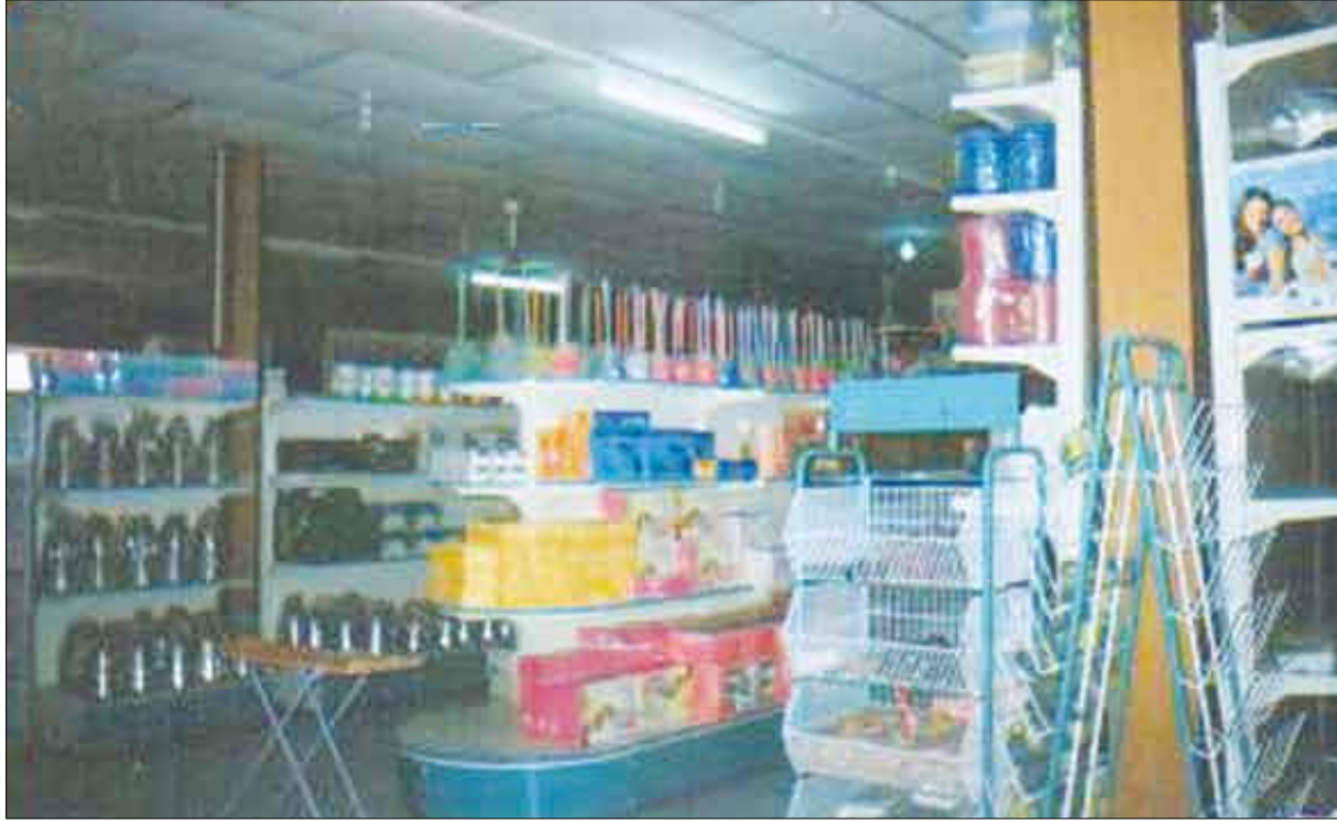
منح القروض العينية للمواطنين

إن هذه القروض تمنح لذوي الدخل المحدود وهدهما رفع المعاناة عن عائق المواطنين والابتعاد عن جنون الأسعار المرتفعة حيث دعمت المؤسسة الاقتصادية المجمع الاستهلاكي التابع لها لكي يقوم بالمهمة وتسهل على المواطن ما قد يتصعب عليه اقتناؤه من السوق وحول هذا الموضوع دارت الكثير من التساؤلات والاستفسارات ولنحجب عنها إليكم الاستطلاع التالي :