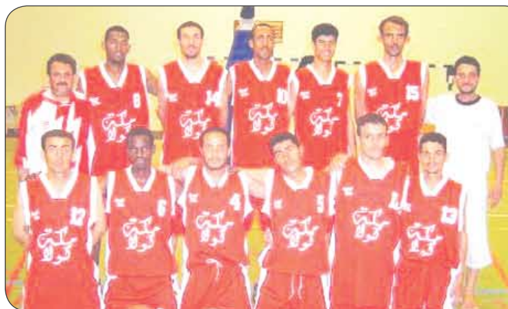
فريق أهلي صنعاء السلة