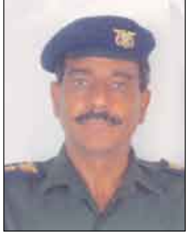
عقيد علي صالح مؤتي