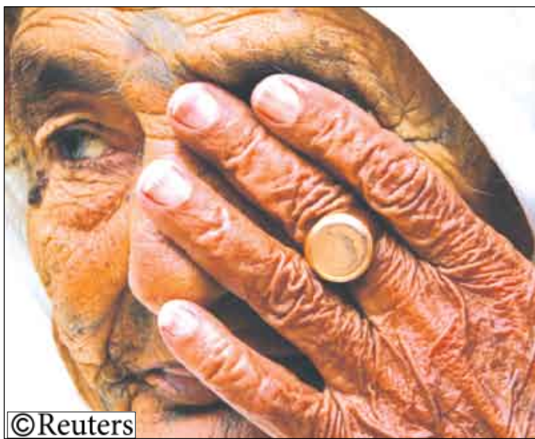
دمعة حزن على العراق

«إنها أصيبت بجلطة وكانت في حاجة إلى رعاية عاجلة في المستشفى. لو كانت بالوصول إلى المستشفى لربما بقيت على قيد الحياة». وتقول جماعات حقوق الإنسان أنها سجلت بضع حالات لمرضى فلسطينيين توفوا بسبب تأجيلات عند نقاط التفتيش للجيش الإسرائيلي منذ بداية الانتفاضة الفلسطينية في عام 2000. على صعيد آخر اتهم وزير الخارجية الفلستيني رياض المالكي إسرائيل أمس الجمعة بعدم الوفاء بالتزامات التي تعهدت بها في محادثات السلام التي أعيد إطلاقها في مؤتمر برعاية الولايات المتحدة في انابوليس بولاية ماريلاند في نوفمبر. وقال المالكي إنه «لم يحدث شيء» منذ بدء محادثات السلام داعيا لممارسة ضغوط دولية على إسرائيل. وأوضح في كلمة أمام مندوبي السلطة الفلسطينية في العواصم الأوروبية إن إسرائيل تواصل سياساتها