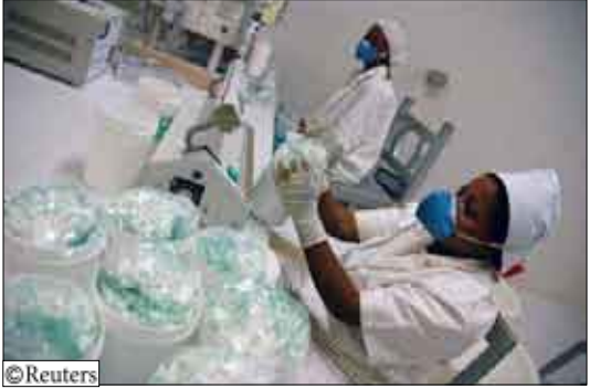
صورة ارشيفية لصنع اقراص اصلية لعلاج الملا ريا

بطن/14 أكتوبر/ رويترز: كشف العلماء والشرطة عن وجود شبكة تجارة أسبوية كبيرة تتاجر في عقاقير مزيفة لعلاج الملا ريا تمثل تهديدا للصحة ما أدى إلى مصادرة مئات الأقرص والقبض على موزع بجنوب الصين. وأعلن عن تفاصيل شبكة التجارة في هذه العقاقير الثلاثة الماضي وتلقى هذه الأنباء الضوء على المخاطر المتنامية للتجارة في العقاقير المزيفة وصعوبة مطاردة الموردين. وتعد هذه مشكلة حادة في جنوب شرق آسيا حيث اكتشف الباحثون أنواعا مزورة من عقار ارتيسونيت لعلاج الملا ريا منذ عام 1998. وكشف تحقيق منسق من قبل منظمة الشرطة الدولية (الانتربول) إن نصف أقراص علاج الملا ريا التي أخذت عيناتها في كل من فيتنام وكامبوديا ولاوس وميانمار وعلى الحدود المشتركة بين تايلاند وميانمار مزيفة.