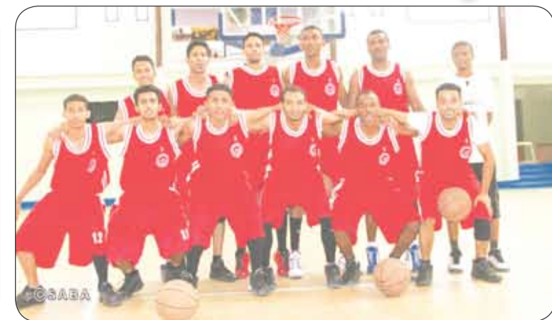
فريق التلال السلة

□ صنعاء / سبأ : وفي الجولة التاسعة لدوري الدرجة الأولى لهذه الفئة. وفي صنعاء رفع الأهلي رصيده إلى 12 نقطة بعد فوزه العريض على ضيفه شباب اب (104 / 72) ليظل الشعب عند 11 نقطة. وكانت مباريات هذه الجولة لفئة الناشئين افتتحت امس الأول بفوز صعب لفريق 22 مايو على ضيفه وحدة عدن (70 / 68) ليرفع مايو رصيده إلى 9 نقاط في محاولة منه للهرب من شبح الهبوط لكنه ظل متذبذباً للترتيب، فيما وصل رصيد وحدة عدن إلى 11 نقطة. وحقق شعب حضرموت فوزاً ثميناً على ضيفه الميناء (74 / 53) ليرفع الشعب رصيده إلى 10 نقاط فيما تجدد رصيد الميناء الذي أنهى بهذه المباراة مشواره في هذا الدوري عند 11 نقطة.