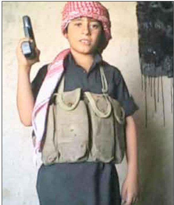
طفل عراقي يرى نفسه استشهادي