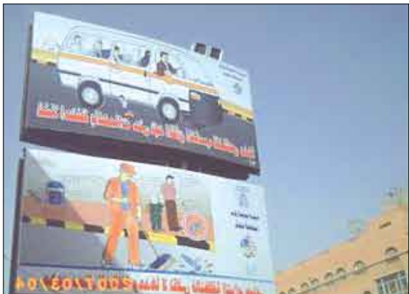
ارشادات بيئية عامة في الطرق

والعمال نحتمم فيها على ضرورة الحفاظ على النظافة والاحتفاظ بالنفايات والمخلفات الشخصية حتى أيجاد المكان المخصص للتخلص منها وهي كثيرة ومنتشرة في كل مكان من شوارع العاصمة، وفيما يخص الورش والمصانع نحتمم على ضرورة الالتزام بالتخلص من النفايات في الأماكن المخصصة لها وبطريقة سليمة حفاظاً على البيئة، كما صدر المركز بروشورات خاصة للتشخيص المؤثرة الأمن والمرور والقوات المسلحة، تم فيها تحديد ادوار كلاً منهم تجاه مجتمعة وحث المواطنين على نظافة العاصمة وأحيائها وحاراتها وشوارعها. كما تم إصدار بروشور عام يحتوي على عدة رسائل هامة موجهة لجميع أفراد المجتمع حيث أن النظافة مسؤولية الجميع.