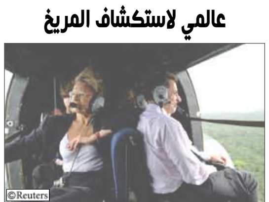
جاركوزي خلال زيارة لوكالة الفضاء الأوروبية

14 أكتوبر / رويترز: دعا الرئيس الفرنسي نيكولا ساركوزي إلى برنامج عالمي لاستكشاف المريخ يجمع الدول الأوروبية وقوى أكثر تقدماً في مجال الفضاء مثل الولايات المتحدة وروسيا. وقال ساركوزي انه سيطلب من وكالة الفضاء الأوروبية والاتحاد الأوروبي التعاون بشأن إطار عمل من أجل حوار مع واشنطن وقوى الفضاء الأخرى بشأن مبادرة مشتركة. وأبلغ ساركوزي الصحفيين أثناء زيارة إلى موقع إطلاق صواريخ أريان في جيانا الفرنسية «نظراً لأن المريخ يمكن الوصول إليه بالتكنولوجيا المتاحة للبشر لا يمكننا أن نرفض محاولة القيام بهذه المغامرة». وقال إن أوروبا لديها مهارات في الاستكشاف بالروبوت والنقل والتكنولوجيا بينما الولايات المتحدة التي لديها بالفعل برنامج لاستكشاف المريخ لديها وسائل مالية وكفاءات فنية وعلمية». وأضاف قائلا «لدي اقتناع بأن برنامجاً لاستكشاف المريخ يمكن فقط أن يكون علمياً دون تخصيص أو استحواذ من دولة واحدة أو أخرى.. سيكون بوسع الكل المشاركة بقواه وقدراته وخياراته». وطالب الرئيس الأمريكي جورج بوش إدارة الطيران والفضاء الأمريكية (ناسا) بالتركيز على إرسال رحلات مأهولة إلى القمر والمريخ لكن برنامج استكشاف المريخ في ناسا يقول إن من غير المرجح القيام برحلة مأهولة إلى الكوكب الأحمر قبل أوائل الثلاثينيات من هذا القرن.