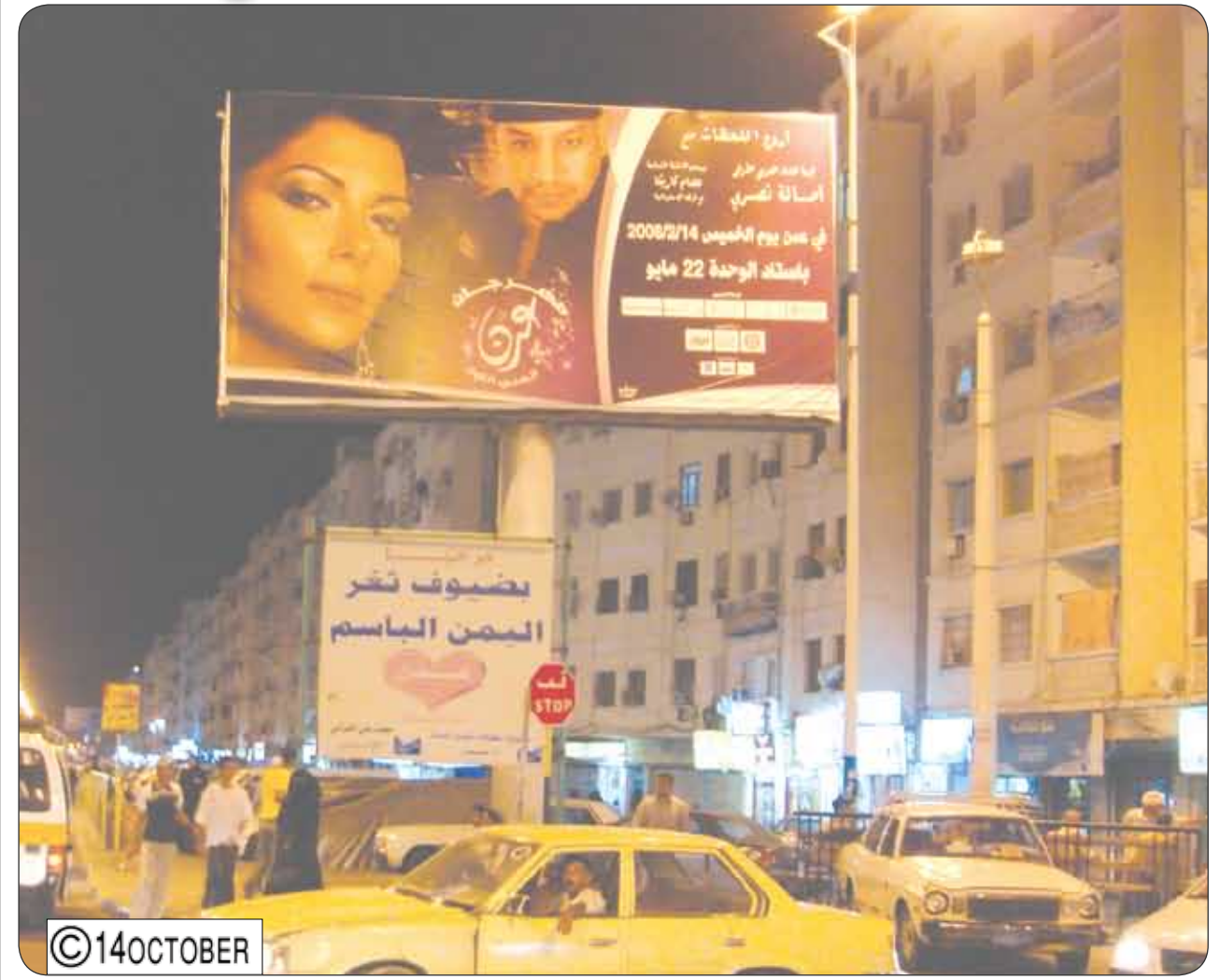
الفنانة السورية (أصالة) تصل اليوم إلى عدن استعداداً لإحياء مهرجان عدن الفني الأول، برفقة الفنان المصري عصام كاريزكا والموسيقار الدكتور خالد فؤاد الذي رافقها في حفلها الأخير بمهرجان الدوحة الغنائي الرابع. (الصورة واحدة من عشرات اللوحات الضوئية التي ترحب بأصالة في عدن.. مدينة الحب والسلام).