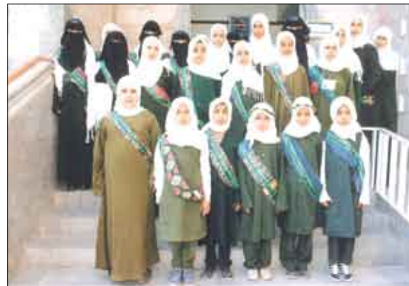
جماعة اصدقاء البيئة

يلاحظ إكم حرصون على استهداف الأطفال وطلاب المدارس بشكل واسع خلال تنفيذ مهامكم وأنشطتكم التوعوية؟ اعتقد أن الطفل وإدراكه لمعنى النظافة يكون في سن مبكرة فيكون باستطاعته أن يعي ذلك منذ سنه الأولى ويبدأ في اكتسابه تلك القيمة الجمالية والي حث عليها لدينا الخيف فإضافة من الإيمان لذلك يجب علينا جميعاً كجهات توعية الاهتمام والتكيز على الأطفال في أنشطتنا ورسائلنا التوعوية وعلى الوالدين قبل ذلك مراعاة النظافة على المستوى العام كالنظافة العامة المستوى الفردي كالنظافة الشخصية وعلى المستوى العام كالنظافة العامة ولابد من فرض رقابة مدروسة على الطفل ، فالطفل يلتقط منذ سنه الأولى كل تصرف وسلوك تسلكه معه أمه وأبيه والطفل بطبيعة الحال يحتاج منذ سنه واثته الأولى إلى أن يتعلم ، وأن يُعَمَّن من كل السلوكيات السبئية ولابد من مراعاة توفير القدوة الحسنة والسلوك سواء في الأسرة من قبل الوالدين او من قبل المعلمين على ، فالطفل يجب أن يوجه التوجيه الصحيح والسليم ، فعندما يحافظ الطفل على نظافته الشخصية في مجال النظافة المنزلي والمدرسة تصبح محافظته على نظافته على نظافة مدينته ووطنه الكبير أمراً مسلماً به فالنظافة لدى الإنسان سلوك متكامل مرتب بفضه بعضه ببعض فلابد من إلا تتعاون في زرع تلك القيمة منذ الصغر وتكوين الصير الحلقى الذي لابد منه في مراحل لاحقة حيث تتأصل وتصبح عادة من الصعب غزالتها أو تبديلها فلابد من أن تتهيأ الي تنمية سلوك أبنائنا بالحفاظ على تلك القيمة الرائعة ( قيمة النظافة ) فالعلم في الصغر كالنقش على الحجر