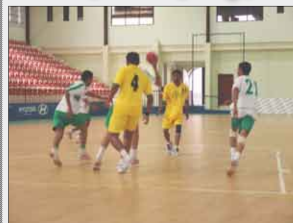
لقطة كرة اليد

من المحاضرات حول أسس وقواعد وتكتيكات التدريب الحديثة، وكل ما يتعلق بلعبة كرة اليد من نواحي التدريب. وأشار صالح إلى أن الاتحاد عاى خلال تنفيذ خطته للموسم الماضي العديد من العوقات والصعوبات المتمثلة في قلة المخصص المالي للاتحاد والأندية الذي يعد عائقاً كبيراً لتنفيذ مجمل الأنشطة، وسبباً لاتعتدال الفرق في بعض المشاركات كما حدث في بطولة الاستقلال لناشئي كرة اليد التي أقيمت في محافظة عدن. ولفت إلى أن الاتحاد يعاني كذلك من عدم توفر المتطلبات الضرورية والملحة أبرزها عدم توفير منشآت وصلات رياضية في أندية المحافظات للتدريب والممارسة، وإقامة البطولات المحلية، وعدم توفر وسائل المواصلات والنقل سواء لأعضاء الاتحاد أو لاعبي الأندية بالمحافظات أثناء إقامة بطولات في محافظة أو أخرى، إضافة إلى نقص في بعض الأدوات الخاصة باللعبة. وتضمن الأمين العام من الجهات المعنية بوزارة الشباب توفير كافة سبل الدعم من أجل البرنامج العام لنشاط الاتحاد للموسم الجديد لما من شأنه تطوير ورقي لعبة كرة اليد في بلادنا.