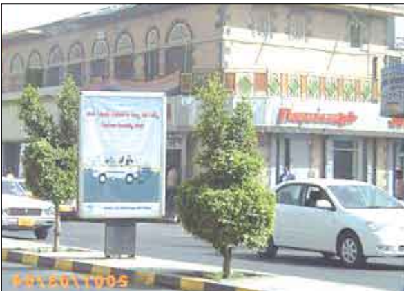
صورة توضح ارشادات التوعية

وقد لعبت هذه الوسائل مجتمعة دوراً فعالاً وهاماً في رفع مستوى الوعي البيئي لدى الكثير من المواطنين ويوضح ذلك من خلال تجاوبهم والتزامهم بوضع المخلفات في أماكنها المخصصة وإخراج المخلفات في أوقاتها المحددة إلا أن القلة القليلة منهم والذين لا يتعرفون بهذه المسؤولية وأهمية الحفاظ على النظافة، ونحن سنستمر في عملنا بكامل إمكاناتنا وجهودنا المستمرة والمتواصلة حتى نحقق الهدف المنشود وهو الارتقاء بالوضع البيئي لأمانة العاصمة والتزام الجميع دون استثناء بوضع المخلفات في أماكنها المخصصة وبصيح ذلك سلوك يومي اعتيادي لدى كل مواطن مع التوسع العمراني وزيادة السكان وما يخلفه هذا التوسع من تأثير بيئي كيف يعملون في هذا التوسع؟ تقوم الأمانة ممثلة بالإدارة العامة للحدائق بقطاع النظافة في زيادة الساحات الخضراء كزراعة الشوارع الرئيسية بالأشجار واستصلاح المثلثات والتقاطعات بالشوارع الرئيسية وأيضاً تعمل على تهيئة العديد من الحدائق الصغيرة والموجودة بالأحياء السكنية.