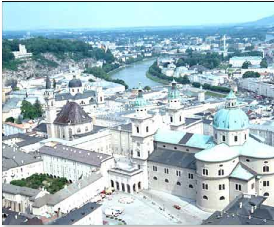
جانب من (سالزبورغ) .. مدينة الأحلام