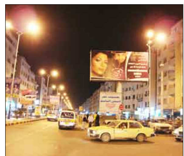
لوحة إعلانية في أحد شوارع عدن

وأريد أن انوه بأنه سيحضر المهرجان عدد من الشخصيات السياسية والدبلوماسية المعتمدة في محافظة عدن وخارجها وكذا الشخصيات البارزة في المجتمع اليمني في مختلف محافظات.