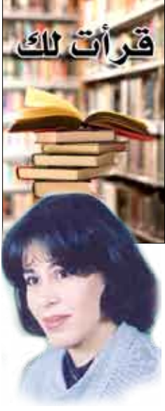
الشاعرة المصرية شريفة السيد

هي ذي أنا بشهادة الرائي لا أخنو، ولا أدنو، ولا وقت لدي أتحدين الفرص المسافة وانسحاب الروح لحظة خلوتي ليدائني قلبي علي وأراقب الكذب المؤقر تحت جلدي وهو في صمته يداعب ناظري ويمر في صبر على مائي كما يخطو على الماء الولي.