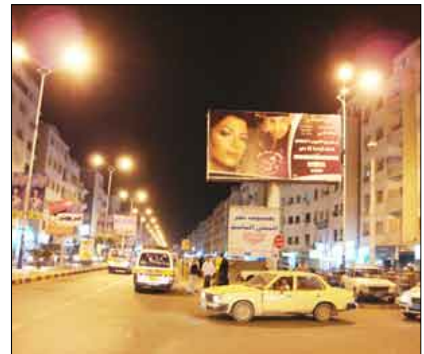
لوحة إعلانية في أحد شوارع عدن