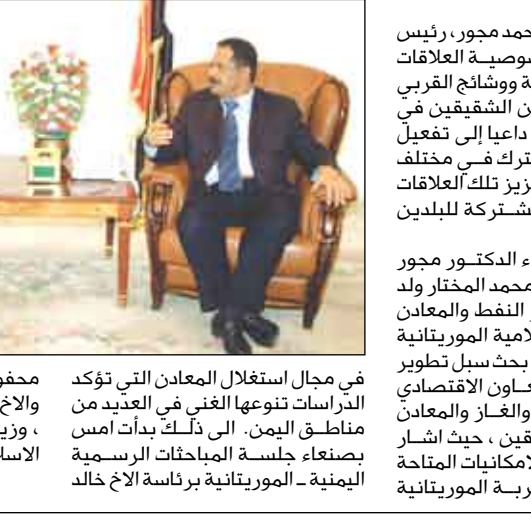
محفوظ بجاح، وزير النفط والمعادن، والأخ محمد المختار ولد محمد الحسن وزير النفط والمعادن بالجمهورية الإسلامية الموريتانية.

صنعاء / سبأ: أكد الدكتور علي محمد مجبور، رئيس مجلس الوزراء خصوصية العلاقات الاجتماعية والتاريخية ووشائج القرابي التي تربط الشعبين الشقيقين في اليمن.. وموريتانيا، داعياً إلى تفعيل أدوار العمل المشترك في مختلف القطاعات لما فيه تعزيز تلك العلاقات وخدمة المصالح المشتركة للبلدين والشعبين.