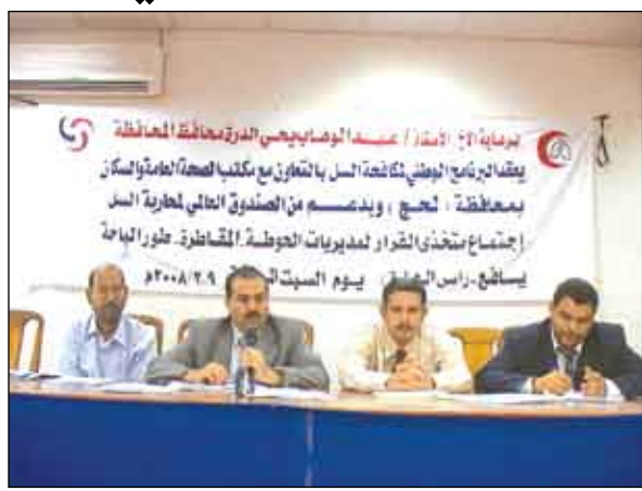
العوطة / عادل قائد

اختتم أمس في لحج اجتماع متخذ القرار لمديرية الحيوطة والمقاترة وطور الباحة ويقع برأس العار التي نفذه البرنامج الوطني لمكافحة السل بالتعاون مع مكتب الصحة في محافظة لحج وبدعم من الصندوق العالمي لمحاربة السل .