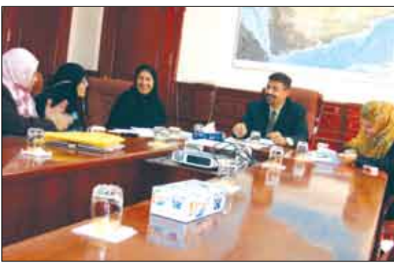
عدن / واد شيبي

تم أمس في عدن استعراض ومناقشة مختلف جوانب مشروع الحكم الجيد الذي تنفذه اللجنة الوطنية للمرأة خلال العام الجاري 2008م بدعم من منظمة أوكسفام البريطانية ويشمل محافظات عدن ، حضرموت والحديدة والذي يهدف إلى إدماج مكون تعليم الفئات في إستراتيجية تنمية المرأة وكذا خطط وبرامج ومشاريع التعليم في كل محافظة .