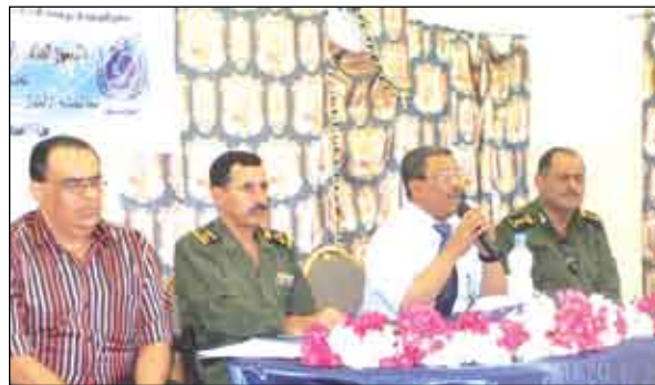
عدن / أثمار هاشم

بدأت صباح أمس في قاعة نادي ضباط الشرطة في محافظة عدن أعمال الدورة التأسيسية الثانية لتأهيل ضباط التوعية بحقوق الطفل ضمن برنامج التوعية لدعم قضاء الأحداث والحماية القانونية للطفل في الشرطة والتي نظمت بالتعاون بين وزارة الداخلية ومنظمة اليونيسيف .