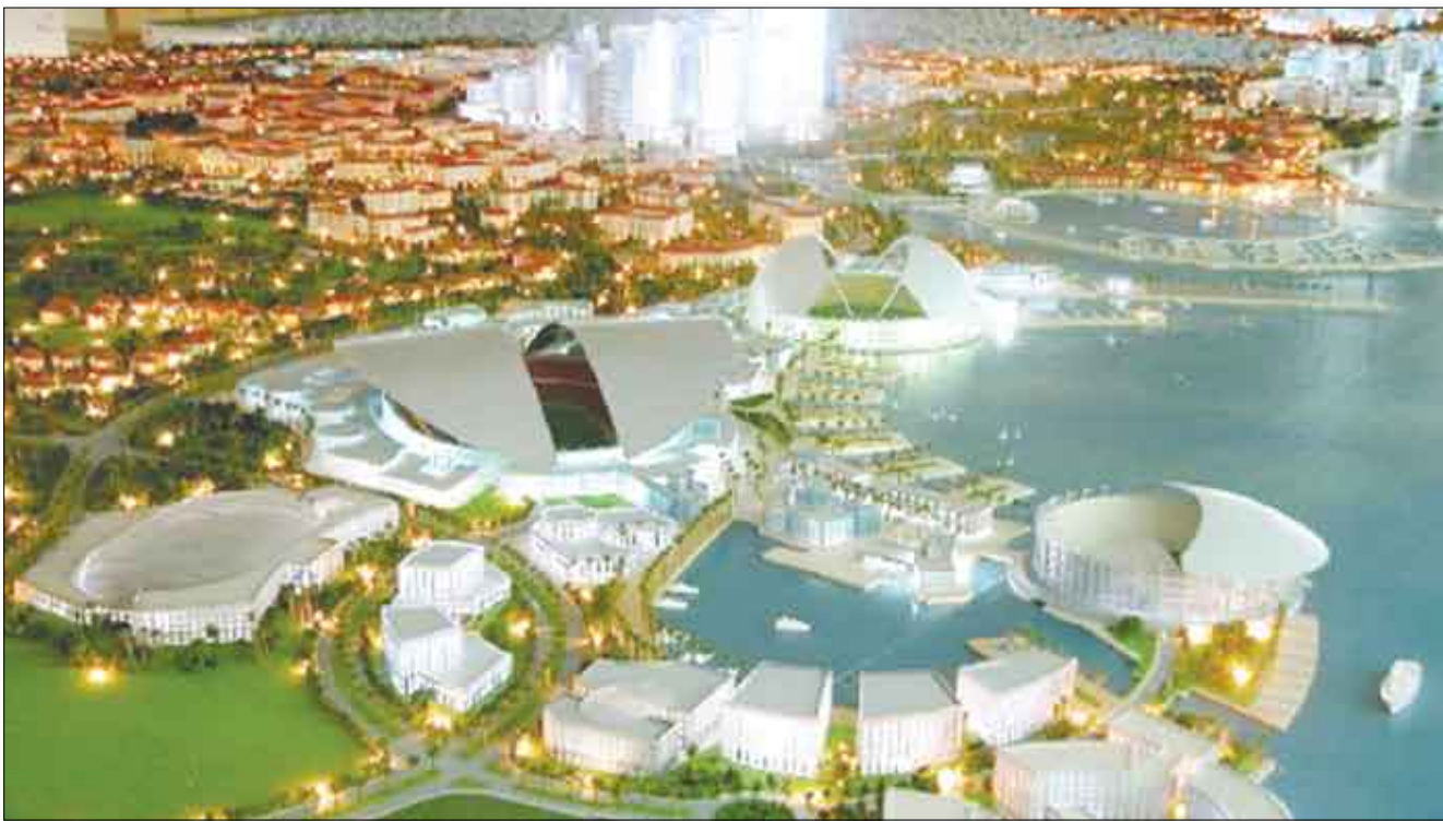
المدينة اليابانية أوتا