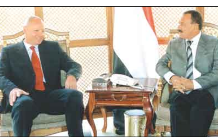
وقد أكد فخامة الأخ الرئيس حرص اليمن على تعزيز وتطوير علاقاتها مع ألمانيا.. مشيداً بما تقدمه جمهورية المانيا الاتحادية من مساعدات لدعم مسيرة التنمية والديمقراطية في اليمن.. حضر اللقاء أمين عام رئاسة الجمهورية عبدالله حسين البشير.

صنعاء / سبأ: استقبل فخامة الأخ الرئيس علي عبدالله صالح رئيس الجمهورية أمس ميشيل كلور بير شتولده سفير جمهورية المانيا الاتحادية بصنعاء، حيث جرى تناول العلاقات ومجالات التعاون المشترك بين اليمن والمانيا بالإضافة إلى بحث ترتيبات الزيارة التي من المقرر ان يقوم بها فخامة الأخ الرئيس علي عبد الله صالح رئيس الجمهورية إلى المانيا في أواخر شهر فبراير الحالي، وبما يكفل لها النجاح وتحقيق الأهداف المنشودة منها وتعزيز العلاقات الثنائية والدفع بمجالات التعاون المشترك بين البلدين.