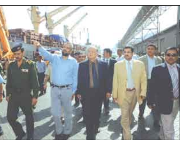
عدن / 14 أكتوبر / سبأ: زار الأخ / عبديبه منصور هادي نائب رئيس الجمهورية أمس عدداً من مواقع العمل في أحياء ومناطق العاصمة الاقتصادية والتجارية عدن من مشاريع الرصف والشق والسفلة ومختلف التحسينات والإصلاحات والتي تجاوزت قيمتها ملياراً ريالاً.

وشملت زيارته ميناء عدن الكائن بمديرية العملا، وميناء التواهي - الرصيف السياحي - ورصيف خفر السواحل - ومدينة عدن «كرتير» ومدينة المنصورة، حيث استمع خلال جولته إلى شرح حول نشاطات ميناء عدن والأعمال الجارية في رصيف خفر السواحل والاستخدامات الجديدة في ميناء التواهي، وسير العمل في رصيف شوارع مدينة عدن والأعمال الجارية في ميناء المنصورة، ووجه خلال زيارته لمدينة المنصورة بتنفيذ مشروع الإصلاحات الكهربائية للمدينة وإنجاز العمل في زمن لا يتجاوز العشرة أشهر، لافتاً إلى أن هذه النشاطات التي تشهدها مدينة عدن بصورة واسعة وكبيرة قد أحدثت نقلة كبيرة من حيث التوسع العمراني والتحسينات والتجديد.