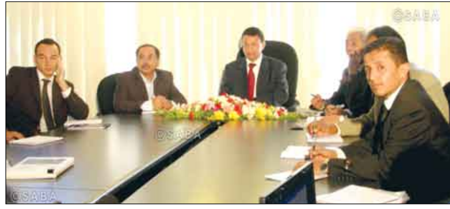
صنعاء / سبأ

ناقشت اللجنة الفنية الخاصة بإعداد الآلية التنفيذية للتوسع في زراعة الحبوب في اجتماعها أمس برئاسة وزير الزراعة والري الدكتور منصور أحمد الحوشي الإجراءات المتعلقة ببرنامج تنمية إنتاج الحبوب الغذائية في اليمن .