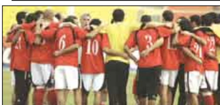
تأمل مصر المصدفة عن اللقب أن يساعدها أسلوب لعبها الأمريكي الجنوبي على تحقيق النجاح عندما تلاقى الكاميرون مجدداً في المباراة النهائية لبطولة كأس الأمم الإفريقية لكرة القدم في أкра اليوم الأحد.