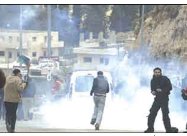
عمان / 14 أكتوبر / رويترز / وكالات: قال الأردن أمس السبت ان حركة المقاومة الإسلامية (حماس) صادرت قافلة مساعدات إنسانية تم توصيلها إلى قطاع غزة للفلسطينيين المحتاجين الذين برزحون تحت الحصار الإسرائيلي.