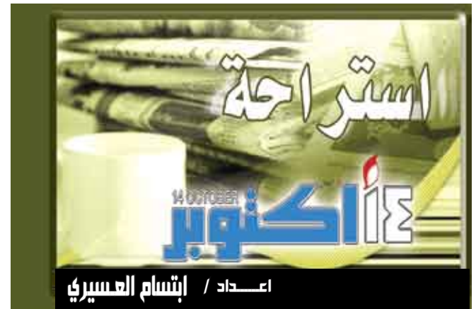
اعداد / إستقام العسيري

شيكاغو / متابعات طور باحثون من أميركا الشمالية نموذجاً أولياً لألة شحن كهربائي يتم ربطها إلى الركبة فتنتج طاقة كهرباء عند المشي تكفي لشحن بطارية الهاتف الخليوي. وهذه الألة تتضمن مولداً صغيراً للكهرباء ينتج طاقة كهربائية كلما عادت الساق إلى الورا، ويشبهه مخترعو هذا الشاحن آلية عمله بتلك التي تسير وفقاً للمحركات ذات الهجينة التي تعمل بالكهرباء والتي تستعيد الطاقة الناتجة عن استخدام المكابح. وقال آرتور كيو أحد القيمين على هذا المشروع والاستاذ المساعد في الهندسة الميكانيكية في جامعة ميتشيجان هناك طاقة يمكن جمعها في أنحاء عدة من جسم الإنسان وهذا الأمر يمكن استخدامه لتوليد الكهرباء. وخلال التجارب الأولية لهذا الجهاز تمكن المتطوعون الذين ربطت إلى ركبهم نماذج أولية من هذا الجهاز من توليد طاقة كهربائية بلغت