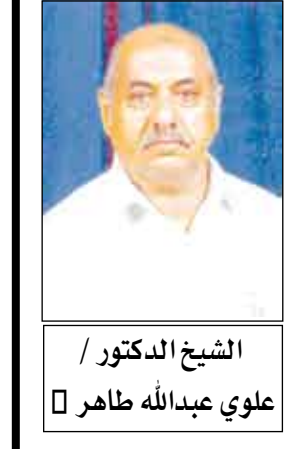
الشيخ الدكتور / علوي عبدالله طاهر