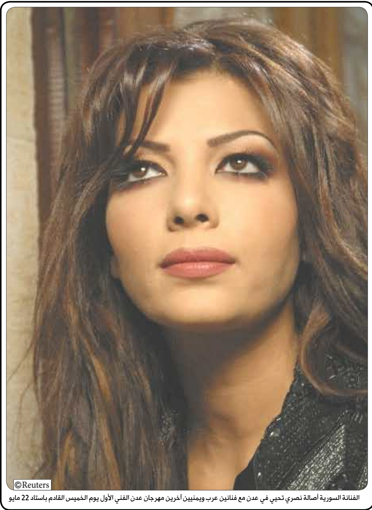
الفنانة السورية أصالة نصري تحيي في عدن مع فنائين عرب ويمينيين آخرين مهرجان عدن الفني الأول يوم الخميس القادم باستاد 22 مايو