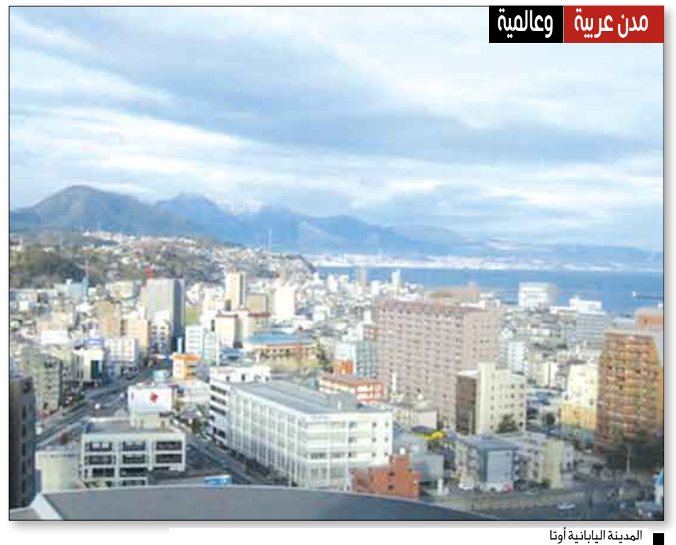
مدن عربية وعالمية