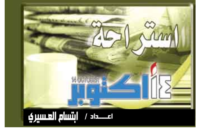
اعداد / إنشام العسيري

بوسطن / مناجيات : بيّنت دراسة أميركية أن مادة الفلافونويد التي تعطى الغريبفروت النارينجينين طعمه المرقد تبطئ تطور التهاب الكبد الوبائي من النوع "سي" . وتقتصر الدراسة ان النارينجينين وهو مضاد للأكسدة يخفض الكولسترول وقد يساعد على تنظيف الكبد من فيروس HCV . وقال الباحثون ان ال "HCV" يرتبط بالكولسترول LDL وينتقل معه لدى إفرازه في خلايا الكبد . وقال المشرف على الدراسة ياكوف ناحماس من مستشفى ماساشوستيس العام عندما وجدنا ان ال HCV يتم إفرازه من الخلايا المصابة من خلال