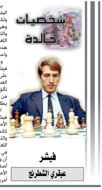
فيشر عبثي الشطرنج

تمكن من انتزاعه الطفل هيكارو ناكامورا عام 2003م، كما أصبح بعد ذلك أصغر أسنان دولي كبير في اللعبة، إلى أن قامت الطفلة المجرية جوييت بولغار بانتزاع اللقب منه في عام 1991م. بدأ فيشر يتقن عالم الشطرنج بقوة فحقق العديد من الإنجازات، في عام 1959م اشترك في تصفيات بطولة العالم والذي حقق فيه الكثير من النتائج المبهرة، وفي عام 1962م اشترك في تصفيات بطولة العالم وحصل فيها على المركز الرابع، وفي عام 1965م رفض فيشر المشاركة في بطولة العالم احتجاجاً على الأوضاع السوفيتي في بطولة وفي عام 1969 نجح فيشر في الفوز على أبطال الاتحاد السوفيتي الثلاثة في الشطرنج، هذا بالإضافة لفوزه على بطل العالم السابق تيجران بتروسيان الأمر الذي ألهه ليصبح في مواجهة مع بطل العالم بوريس سباسكي، وقد جرت هذه المباراة في عام 1972م بأيسلندا هذه المباراة التي ترقبها العالم بمتى الشغف، نظراً لوقوعها أثناء الحرب الباردة بين كل من أمريكا والاتحاد السوفيتي، وتمكن فيشر بالفوز في هذه المباراة وأصبح أول أمريكي يفوز ببطولة العالم للشطرنج. في عام 1975م قرر فيشر الاعتزال في