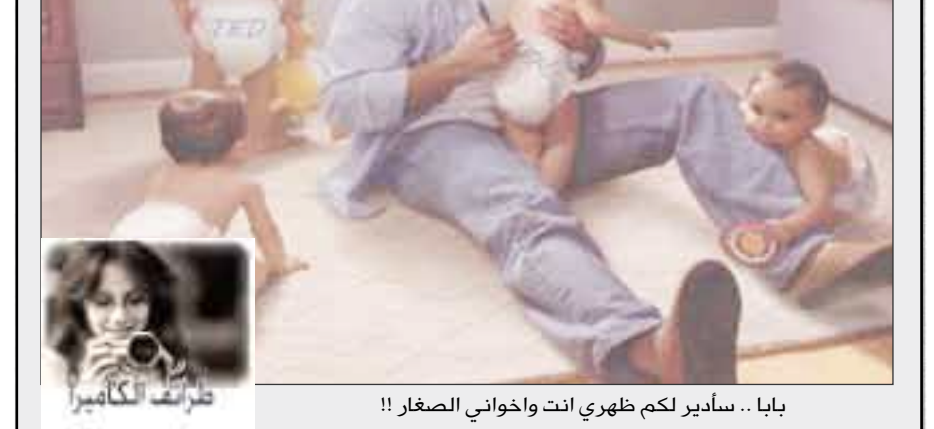
بابا .. سادير لكم ظهري انت واخواني الصغار !!

ويل لأمة تلبس مما لا تنسج وتاكل مما لا تزرع وتشرب مما لا تعصر. جبران خليل جبران