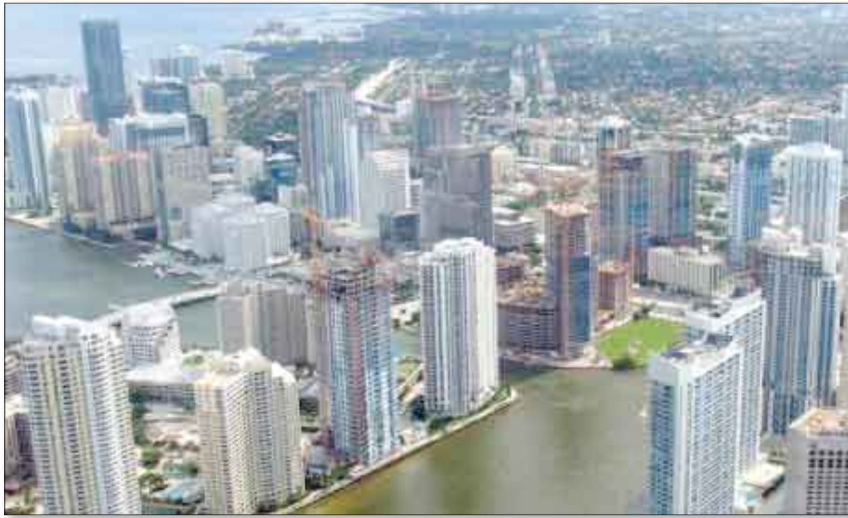
مدينة واشنطن الأمريكية

واشنطن ولاية تقع على الشاطئ الغربي للولايات المتحدة الأمريكية ، واشطنون هي عاصمة الولايات المتحدة الأمريكية ، وترمز الحروف D.C إلى District of Columbia أو قطاع كولومبيا ، وهو قطاع اتحادي (فيدرالي) تحت سلطة الحكومة الفيدرالية مباشرة وليست أي ولاية من الولايات. وقد أطلق عليها اسم واشنطن تيما بجورج واشنطن القائد العسكري للثورة الأمريكية وأول رئيس للولايات المتحدة. ومن الشائع الإشارة إلى المدينة بـ D.C the District أو فقط واشنطن. وتاريخيا كان يطلق عليها المدينة الفيدرالية أو مدينة واشنطن ، وذلك لتجنب الخلط بينها وبين ولاية واشنطن التي تقع بعيدا عنها تماما شمال غرب الولايات المتحدة على شاطئ محيط الباسيفيك (المحيط الهادي) ، وهي تقع على الحدود بين ولايتي ميريلاند وفيرجينيا. من أبرز معالمها مدينة السينما لوس أنجلوس وملعب لوس أنجلوس ليكرز وملعب كوبي براينت وفندق فئة أربع نجوم الاسعار تبعد 169 دولار لهذا الواحد. وهذا الفندق يأخذ طابع مدينة البنديقه الايطاليه بمراته المائيه الرائعه ومطاعمه الايطاليه المختلفه. ويعرض الفندق العديد من الانشطة مثل تأجير القوارب و التسوق على الطريقة الايطاليه كما انه يحتوي على متحف الشمع يشبه متحف مدام تيسو في لندن فندق فئة أربع نجوم. الاسعار تبدأ من 89 دولار لليلة كعرض خاص من الثالث عشر من يونيو الى السابع من يوليو وفندق علاء الدين ذو طابع عربي اوروبي يحتوي على انشطه متعدده و يحتوي على مسرح للعرض بالاضافه الى احواض السباحه والنوافير المائيه وغيرها .