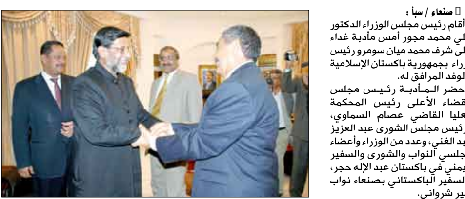
أقام رئيس مجلس الوزراء الدكتور علي محمد مجور أمس مأدبة غداء على شرف محمد ميان سومرو رئيس وزراء جمهورية باكستان الإسلامية والوفد المرافق له.