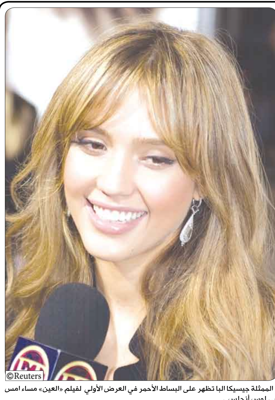
الممثلة جيسكا البيا تظهر على البساط الأحمر في العرض الأولي لفيلم «العين» مساء امس في لوس أنجلوس .