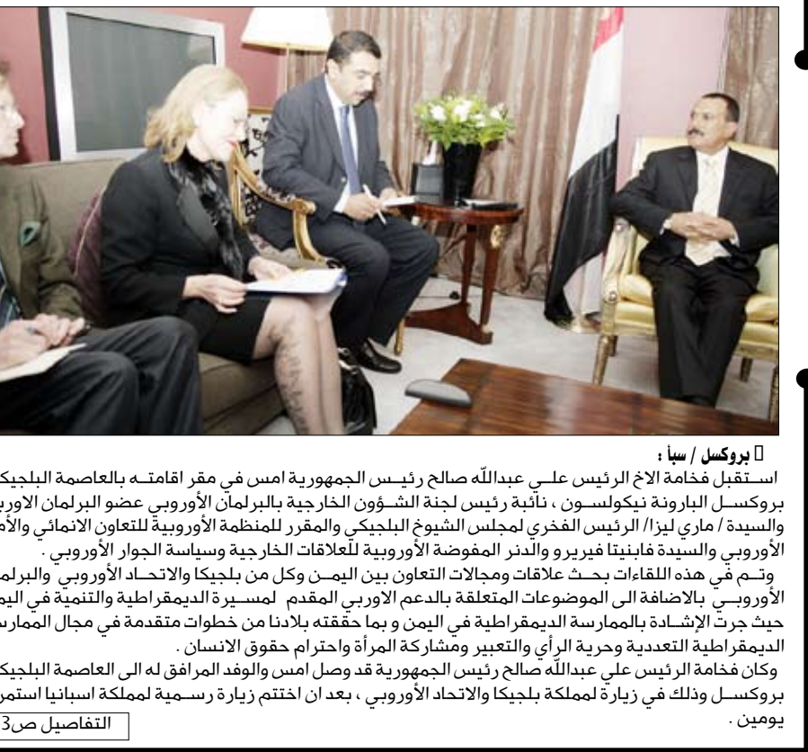
استقبل فخامة الاخ الرئيس علي عبدالله صالح رئيس الجمهورية امس في مقر اقامته بالعاصمة البلجيكية بروكسل البارونة نيكولسون ، نائبة رئيس لجنة الشؤون الخارجية بالبرلمان الأوروبي عضو البرلمان الأوروبي والسيدة / ماري ليزا/ الرئيس الفخري لمجلس الشيوخ البلجيكي والمقرر للمنظمة الأوروبية للتعاون الانمائي والأمن الأوروبي والسيدة فاينيتا فيريرو والندر المفوضة الأوروبية للعلاقات الخارجية وسياسة الجوار الأوروبي . وتم في هذه اللقاءات بحث علاقات ومجالات التعاون بين اليمن وكل من بلجيكا والاتحاد الأوروبي والبرلمان الأوروبي بالإضافة الى الموضوعات المتعلقة بالدعم الأروبي المقدم لمسيرة الديمقراطية والتنمية في اليمن حيث جرت الإشادة بالممارسة الديمقراطية في اليمن وبما حققته بلادنا من خطوات متقدمة في مجال الممارسة الديمقراطية التعددية وحرية الرأي والتعبير ومشاركة المرأة واحترام حقوق الانسان . وكان فخامة الرئيس علي عبدالله صالح رئيس الجمهورية قد وصل امس والوفد المرافق له الى العاصمة البلجيكية بروكسل وذلك في زيارة لمملكة بلجيكا والاتحاد الأوروبي ، بعد ان اختتم زيارة رسمية لمملكة اسبانيا استمرت يومين .

وكان الدكتور مجور، قد التقى امس في الدوحة عددا من أبناء الجالية اليمنية المقيمين بدولة قطر الشقيقة ، حيث جرى اطلاعهم على جملة التطورات على الساحة الوطنية بما في ذلك الاجراءات التي اتخذتها الحكومة لتطوير المناخ الاستثماري العام ، كما تم مناقشة مختلف القضايا والمواضيع التي تهم المغتربين.