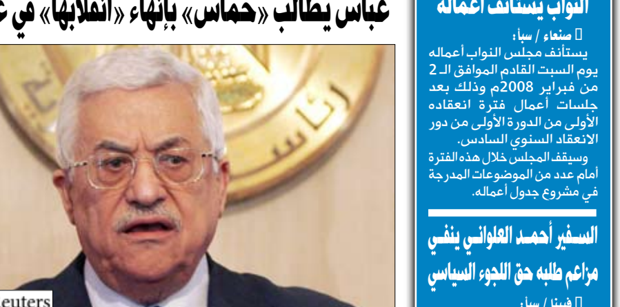
الرئيس الفلسطيني عباس

مصر لشراء السلع التي يعانون من نقص فيها. وحصل عباس الذي اجتمع في القاهرة امس مع الرئيس المصري حسني مبارك ومسؤولين مصريين آخرين على مساندة أمريكية وأوروبية وعربية في شأن سيطرة السلطة الفلسطينية التي يرأسها على معبر رفح الحدودي وهو ما يعني استبعاد الآلاف من سكان غزة بالتدفق على