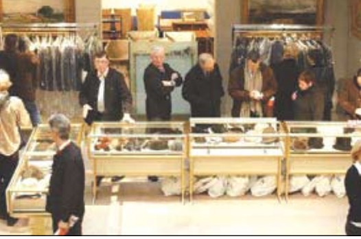
زار بشاهون الملابس والمعلقات الشخصية للرئيس الفرنسي الراحل فرانسوا ميتران