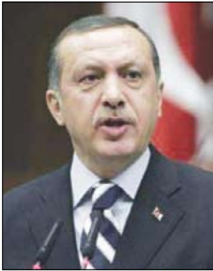
رجب طيب أردوغان

أنقرة 14 أكتوبر / رويترز - كشف حزب العدالة والتنمية التركي الحاكم والقوميون المعارضون عن خطط لتخفيف حظر على ارتداء الحجاب في الجامعات.