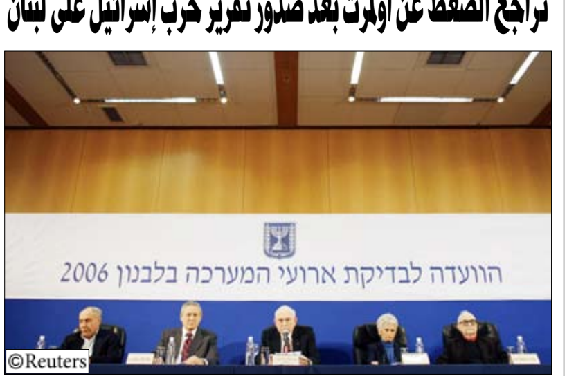
لجنة تقرير فينوجراد حول الحرب الاسرائيلية على لبنان

مكثف شنه في الأيام الأخيرة. وأشار أوفيد بحزقيل المسؤول بالحكومة إلى أن أولمرت تقبل النقد ولكنه لا يعترف بالاستقالة. وقال "إن تحمل المسؤولية يعني البقاء والتحسين والاستمرار في القيادة على الطريق إلى الامم". وقال ايلان مزراحي مستشار الأمن القومي الذي تقاعد إلى هدنة "كان ضروريا تقريبا". وتعرض أولمرت لانتقادات شديدة بسبب الخسائر التي تكبدتها إسرائيل خلال الحرب، ولكن فينوجراد قال في الاشارة الوحيدة لرئيس الوزراء انه تصرف بناء على "تقييم صادق" من الصيادين اليمنيين.