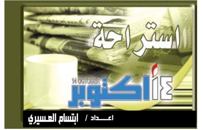
اعداد / ابتسام العسيري

واشنطن / متابعات : قال مسؤولون أن برامج مراقبة التدخين في الولايات المتحدة فعالة في الحد من عدد المدخنين وأن الولايات التي تنفق مبالغ مالية أكبر تحقق أفضل النتائج. وتشير دراسة نشرت في الدورية الأمريكية للصحة العامة إلى أن التراجع في معدلات التدخين بين الأمريكيين مرتبط بشكل مباشر بزيادات في نصيب الفرد من الاستثمارات في الولايات في برامج السيطرة على التبغ والإقلاع عن التدخين. وحلل باحثون بمراكز السيطرة والوقاية من الأمراض ومعهد بحوث مستقل بيانات بشأن معدلات التدخين والاتفاق على التبغ في الولايات الأمريكية الخمسين من عام 1995 إلى 2003. وقالت جماعة الحملة من أجل أبناء لا يدخنون أن الولايات ستنتفع 717 مليون دولار في العام المالي 2008 على برامج السيطرة على التبغ والإقلاع عن التدخين. وتتضمن هذه البرامج إعلانات عن مخاطر التدخين وجهود مكافحة التدخين التي تستند إلى المدارس والمجتمع وأجراءات مثل استحداث خطوط هاتفية