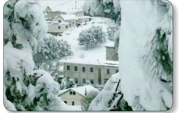
صور تان لمدينة عين دراهم والقرى المنتشرة في معتمدية عين دراهم.

عين دراهم أحد مدن ولاية جنوبية التونسية وثالث أهم موقع سياحي في الولاية بعد مدينة طبرقة الساحلية ومدينة جنوبية مركز الولاية. يحد معتمدية عين دراهم كل من معتمدية فرنانة جنوبا وطبرقة شمالا وبالطما شرقا والجزائر غربا. وترتفع المدينة 1000 متر فوق سطح البحر وتغطي الثلوج كل فصل شتاء جبال الشمال الغربي وقد سجلت عين دراهم رقما قياسيا في تونس من حيث سماكة الثلوج التي وصلت قرابة المترين سنة 2005 وطمرت أجزاء كبيرة من المدينة تحت الثلوج. أما الجزء الأجل في عين دراهم فيتمثل في قرأها الجميلة المحاذية للجبال ومنازلها المعلقة في قمم جبال الكرومي ذات الغابات الكثيفة بأشجار الصنوبر والبلوط والقيقين والزان