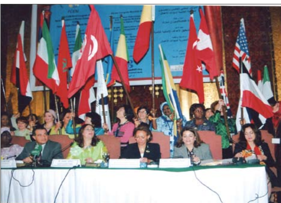
خلال المؤتمر العالمي الخامس والخمسون للجمعية العالمية لسيدات الأعمال

الساحة الاقتصادية بكل جرأة وعدم وجود الخوف والعيب بل أكثرهم تكلمن عن تجاربهن التي بالفعل تستحق الاحترام والتقدير وهذا أعطاني حافز كبير في مراجعة كل حساباتي وعدم الخوف من المصاعب التي قد تواجهنا في حياتي المهني والاجتماعية والخوف من الفتنه والنظرة الذكورية للمرأة سيدة عمل التي تملك موتيلا ومطلعا عماله كلهم رجال في البداية دخلت أدير المطعم والموتيل تم تازعت الأوضاع بسبب عوامل كثيرة كنت اعتقد أنها هي السبب الحقيقي في إعطاء زوجي هذا المهام لأختي خلفه واحتمى من المجتمع علما إنني المالك الوحيد لممتلكاتي.