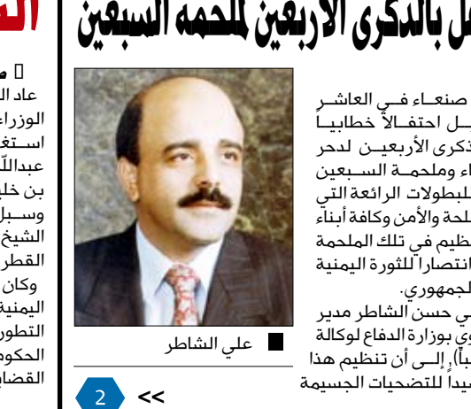
تشهد العاصمة صنعاء في العاشر من فبراير المقبل احتفالاً خطابياً كبيراً بمناسبة الذكرى الأربعين لحرر الضار عن صنعاء وحملة السبعين يوماً وذلك تخليداً للبطولات الرائعة التي سجلتها القوات المسلحة والأمن وكافة أبناء الشعب اليمني العظيم في تلك الحملة التاريخية العظيمة انتصاراً للثورة اليمنية ودفاعاً عن النظام الجمهوري.