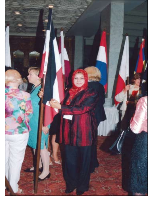
من فعاليات المؤتمر

نظم المؤتمر حلقات نقاش ساهمت في وضع القضايا التي تفت عائق أمام سيدات الأعمال وضرورة مشاركة الحكومة والموارد والتشبيك مشيرة في حديثها إلى «أن هناك الكثير من نساء أعمال من مختلف الأعمار واللواتي بالفعل يحفرن الحجر وهن يدخلن