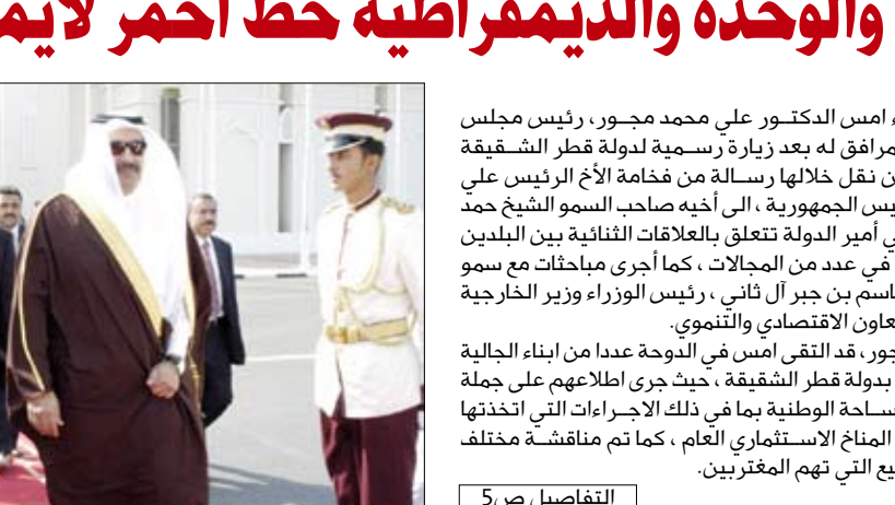
عاد إلى صنعاء امس الدكتور علي محمد مجور، رئيس مجلس الوزراء والوفد المرافق له بعد زيارة رسمية لدولة قطر الشقيقة استغرقت يومين نقل خلالها رسالة من فخامة الأخ الرئيس علي عبدالله صالح رئيس الجمهورية، إلى أخيه صاحب السمو الشيخ حمد بن خليفة آل ثاني أمير الدولة تتعلق بالعلاقات الثنائية بين البلدين وسبل تعزيزها في عدد من المجالات ، كما أجرى مباحثات مع سمو الشيخ حمد بن جابر آل ثاني ، رئيس الوزراء وزير الخارجية القطري حول التعاون الاقتصادي والتقني.

وكان الدكتور مجور، قد التقى امس في الدوحة عددا من أبناء الجالية اليمنية المقيمين بدولة قطر الشقيقة ، حيث جرى اطلاعهم على جملة التطورات على الساحة الوطنية بما في ذلك الاجراءات التي اتخذتها الحكومة لتطوير المناخ الاستثماري العام ، كما تم مناقشة مختلف القضايا والمواضيع التي تهم المغتربين.