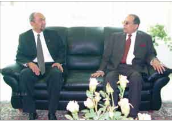
... ويقدم التعازي في السفارة الاندونيسية

بتكليف من فخامة الاخ الرئيس علي عبدالله صالح رئيس الجمهورية، قام مستشار رئيس الجمهورية عبدالقادر باجمال بتقديم التعازي بوفاء الرئيس الاندونيسي السابق محمد سوهارتو وكذا بوفاء المناضل جورج حبش رئيس الجبهة الشعبية لتحرير فلسطين.