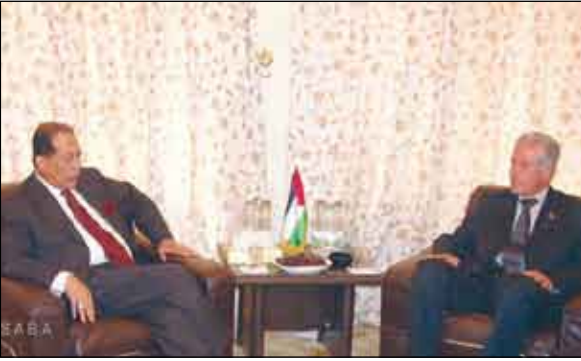
باجمال يقدم التعازي في السفارة الفلسطينية