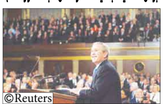
الرئيس الأمريكي جورج بوش يلقي خطابه عن حالة الاتحاد أمام الكونجرس بواشنطن

بوش: الخلايا الجذعية المأخوذة من الجلد تطور مهم