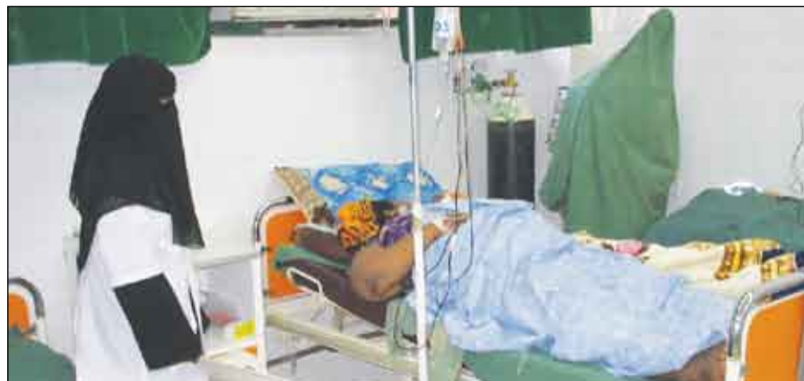
في إحدى المستشفيات

مستشفيات تقف على كفة عفريت وزملاء مهنة يعرضون للتشخيص الخاطيء