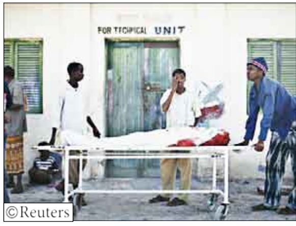
جثة الصحفي المقتول في الصومال