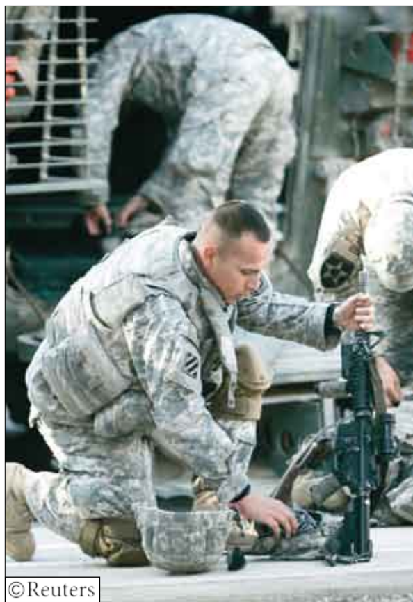
بعض من الجنود الأمريكيين في العراق

وأضاف ان «القاعدة تفننوا بوسائل القتل التي لم يشهد لها التاريخ مثيلاً حيث فخذوا الحيوانات لتفجر على الناس وفخذوا جثث الشهداء بعد رفعهم منه