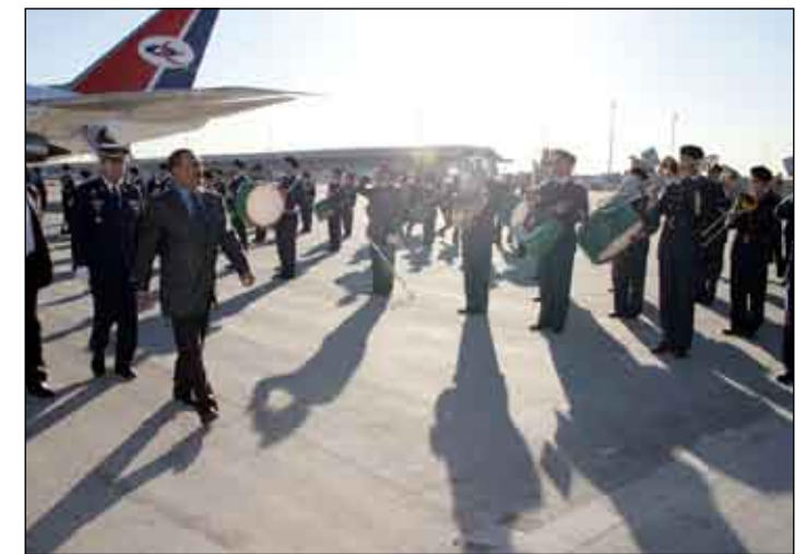
الرئيس يستعرض حرس الشرف