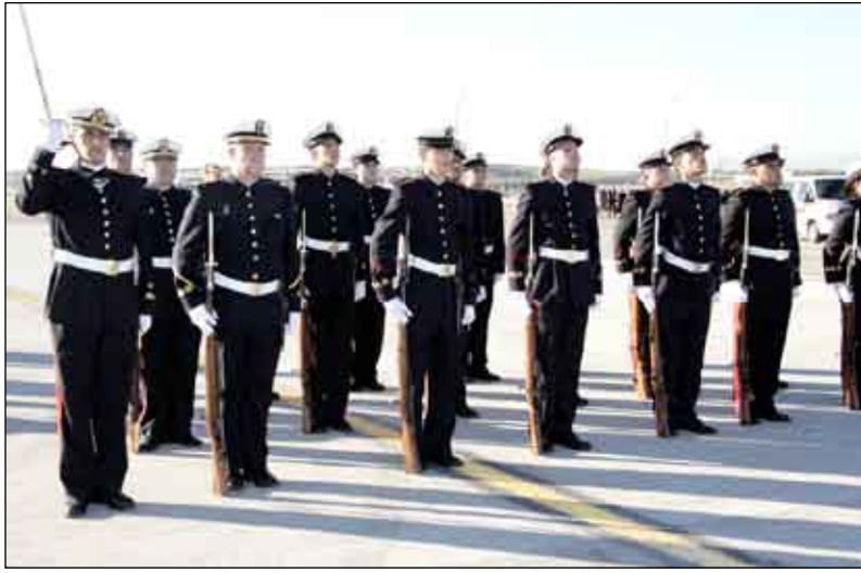
ثلة من حرس الشرف