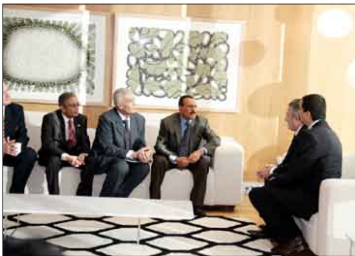
.. في قاعة الاستقبال بمطار مدريد

وما الجديد عن البردوني، والذي قيل بعد وفاته بإيام أنه سيخرج هذا الرجل الفذ؟