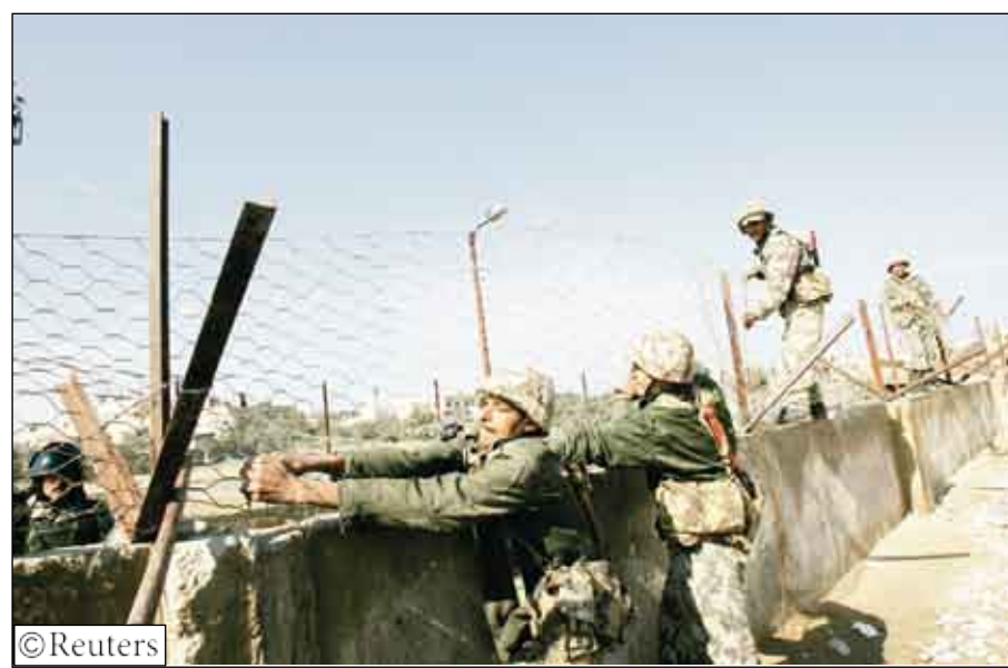
السور العازل بين غزة ورفح المصرية

ولكن مسئولين أوروبيين وغربيين متمركزين في