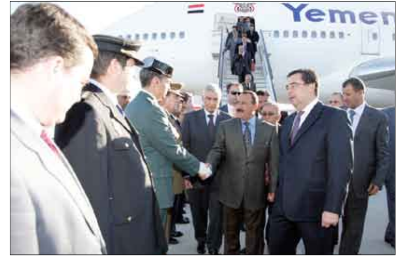
رئيس الجمهورية لدى وصوله مطار مدريد