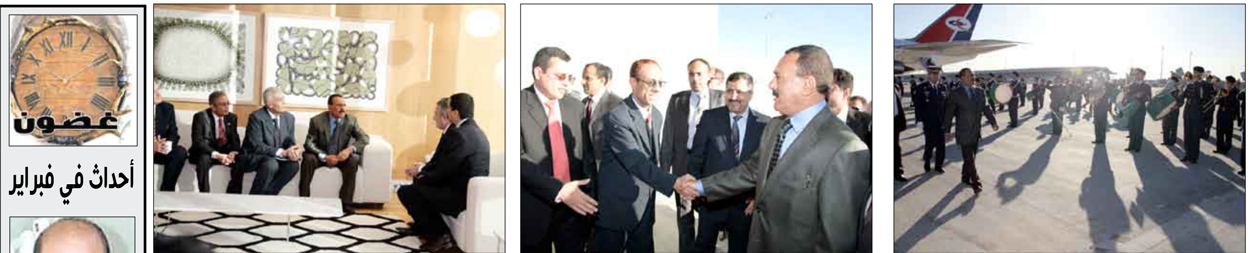
الرئيس يستعرض حرس الشرف