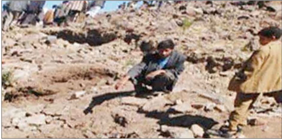
موقع اثرى - اب