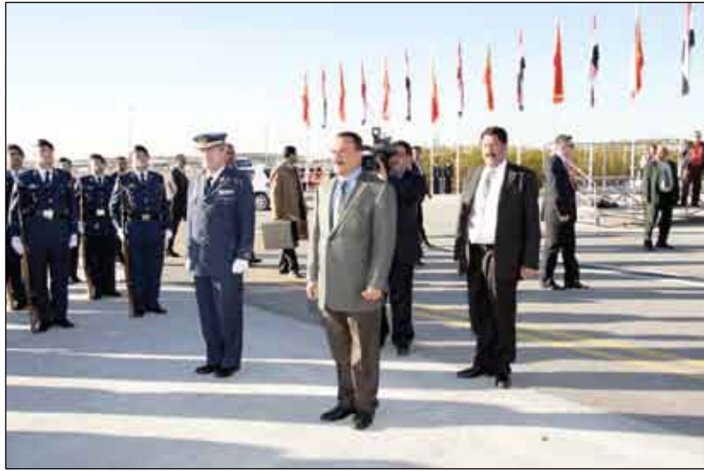
الرئيس يستعرض حرس الشرف