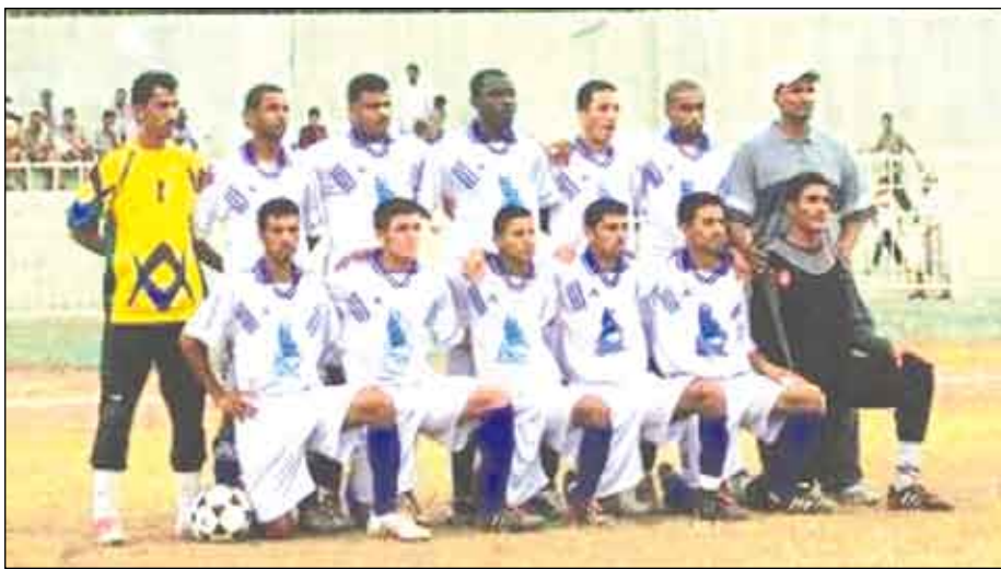
فريق وحدة صنعاء