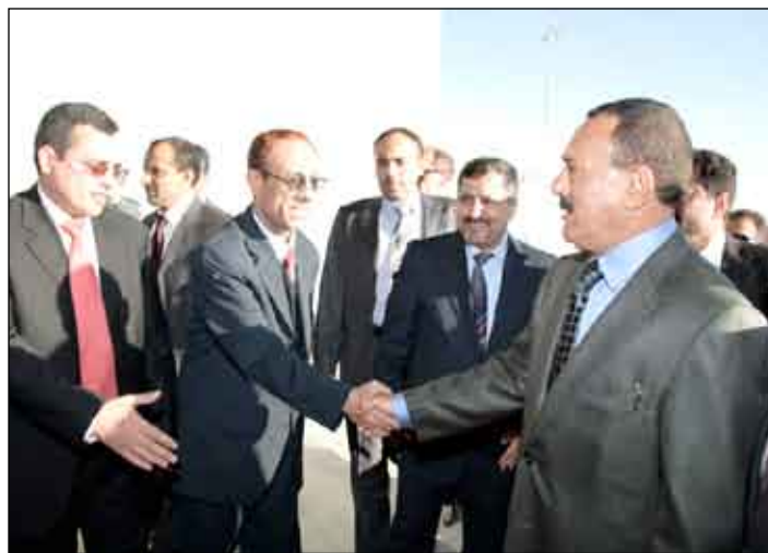
.. ويسلم على طاقم السفارة اليمنية في المطار