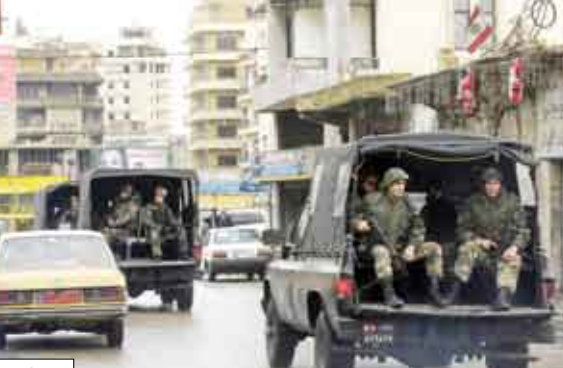
حدثت ماطلة فسيكون هناك

حدثت ماطلة فسيكون هناك حديث عربي آخر. ولم يوضح موسى طبيعة الإجراءات التي قد تتخذها الدول العربية، لكن مصادر دبلوماسية عربية قالت إنه ما لم يتم تسوية الأزمة اللبنانية قبل القمة العربية المقبلة التي تقرر عقدها في 29 و30 مارس المقبل فسينعكس ذلك على الحضور العربي في هذه القمة.