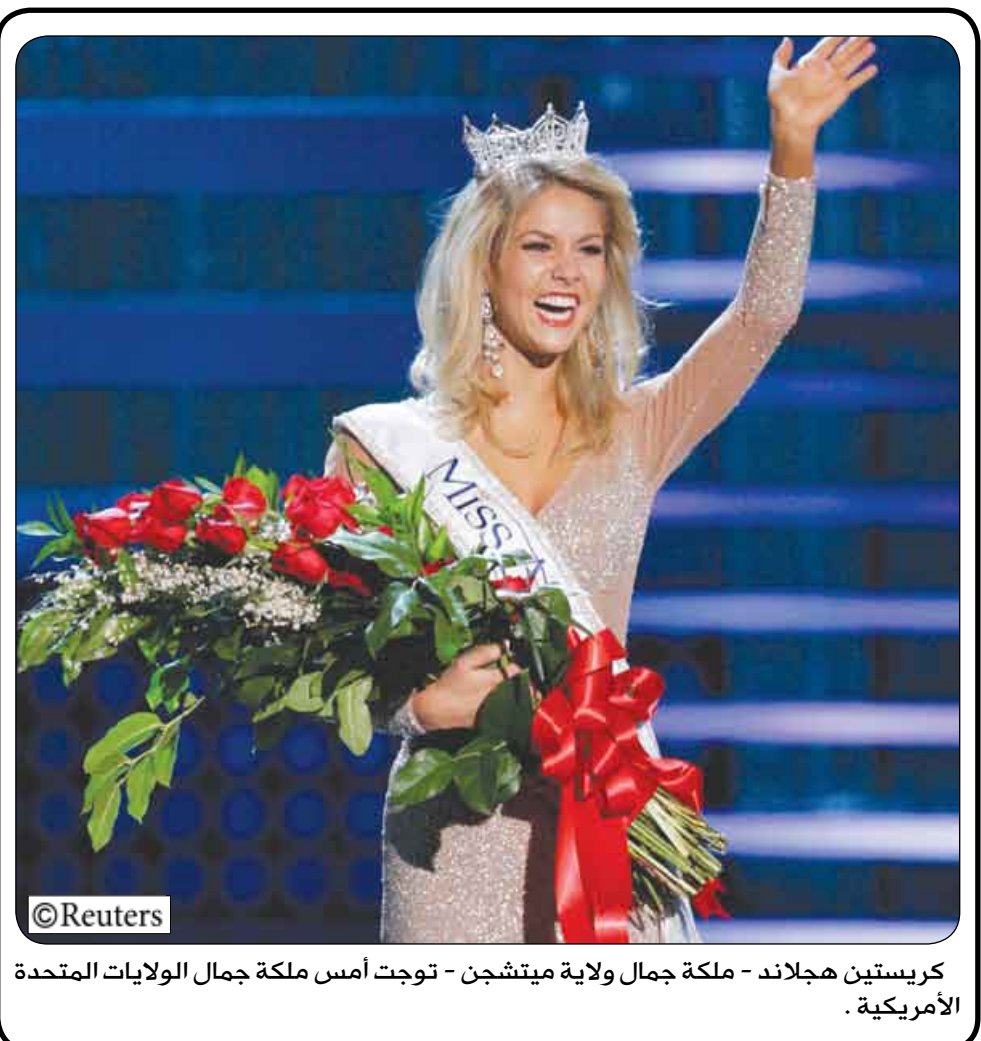
كريستين هجلاند - ملكة جمال ولاية ميتشجن - توجت أمس ملكة جمال الولايات المتحدة الأمريكية .

مستشار رئيس الجمهورية في برقية عزاء : القائد جورج حبش تتلمذ على يديه الكثير من الأحرار في الوطن العربي 14 أكتوبر ، بعث الأخ سالم صالح محمد مستشار رئيس الجمهورية برقية عزاء ومواساة إلى سفير دولة فلسطين ، رفع خلالها التعازي الحارة إلى الشعب الفلسطيني والقيادة الفلسطينية بوفاء المناضل الفلسطيني الكبير الدكتور جورج حبش . ووصف مستشار رئيس الجمهورية في برقية العزاء والمواساة الفقيه بالقائد الذي تتلمذ على يديه الكثير من الأحرار في الوطن العربي وعاش مقاتلاً ومفكراً ومناضلاً من أجل تحرير فلسطين . كما بعث مستشار رئيس الجمهورية برقية عزاء ومواساة إلى قيادة وكوادر الجبهة الشعبية لتحرير فلسطين .. تمنى خلالها للفقيه الخلود وللشعب الفلسطيني العظيم الانتصار المظفر .