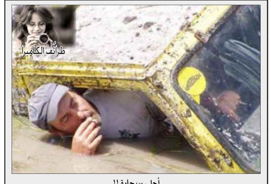
أحلى سيجارة !!