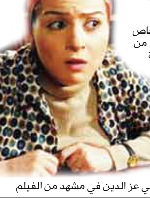
مي عز الدين في مشهد من الفيلم