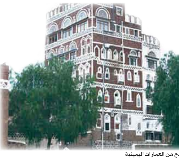
نموذج من العمارات اليمنية