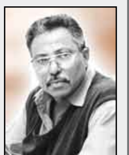
إقبال علي عبدالله

ومن نافل القول وأثناء متابعتي المتاملة لهذه الأوضاع المأساوية واتساع رقعتها مع كل ساعة زمن يكون الإنسان الفلسطيني صاحب الحق هو الدافع لفاتورة العدوان الإسرائيلي والصمت العربي والإنحياز الدولي.. أقول إنه تأكد لي بأن استمرار دعوة فقامة الأخ الرئيس علي عبدالله صالح رئيس الجمهورية لأشقائه القادة الفلسطينيين بضرورة الوحدة الوطنية ونبذ الخلافات داخل البيت الفلسطيني لتفويت الفرصة أمام الإحتلال الإسرائيلي لتمزيق الوحدة الفلسطينية وإنهاء مشروع قيام الدولة الفلسطينية المستقلة وعاصمتها القدس الشريف. هذه الدعوة الرئاسية اليمنية في زمن- وللأسف نقولها- كان الصمت العربي أكثر وضوحا من السابق الأمر الذي دفع الدول الأوروبية وكذا الولايات المتحدة الأمريكية إلى تسوية القضية الفلسطينية وتغذية الخلافات الفلسطينية - الفلسطينية، وهو ما يجري اليوم بين رفاق السلاح والمصير الواحد حركة فتح