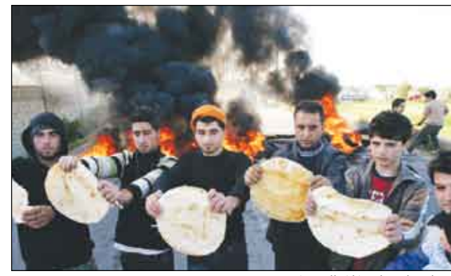
إضراب على غلاء المعيشة