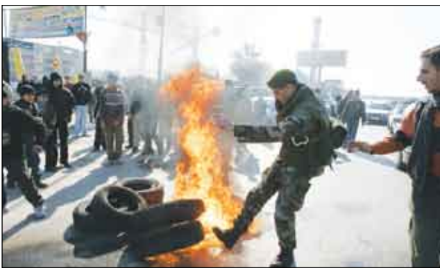
جانب من مظاهر الإضراب

وتزيد الأزمة السياسية في لبنان من صعوبة الأوضاع الاقتصادية. فبيما تزداد نسبة التضخم، ارتفعت أسعار المواد الاستهلاكية بنسبة 3.7% بين يناير وأكتوبر 2007 لا سيما أسعار المواد الغذائية (8%)، حسب دراسة لمعهد البحث والاستشارات. كما ارتفعت أسعار المحروقات بنسبة كبيرة.