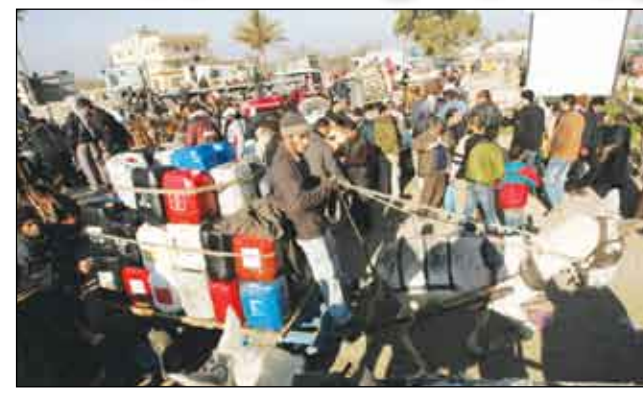
احتجاجات الإنسانية والتومية تندفق من العريش ورفح

أن جهود إسرائيل لفك الارتباط بغزة مستمرة «بمعنى تزايد وقف مدهم بالهزباء، ووقف مدهم بالمياه والدواء حتى يجيء من جهة أخرى». ومضى يقول «نحن مسؤولون عن القطاع ما دام لم يكن هناك بديل، مشيرا إلى أن إسرائيل التي احتلت قطاع غزة عام 1967، بدأت فك الارتباط بينها وبين القطاع حين سحبت جنودها ومستوطناتها عام 2005، فيما ما زالت تسيطر على حدود غزة الشمالية والشرقية كما تسيطر على أجوائها وسواحلها».