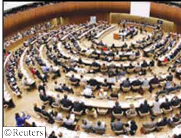
مجلس حقوق النسان

جنيف / سبغاني سبيها / رويترز: طالب مجلس حقوق الإنسان بالأمم المتحدة أمس الخميس إسرائيل برفع حصارها لغزة المستمر منذ أسبوع وعنف الدولة اليهودية بسبب وقوع انتهاكات في الأراضي الفلسطينية للمرة الثالثة منذ إنشاء المجلس عام 2006. وأقر المجلس الذي يضم 47 عضوا قرارا قدمته دول عربية وإسلامية بتأييد 30 دولة واعتراض دولة واحدة وامتناع 15 عن التصويت، وتعبير وفد واحد عن الجلسة. وقال محمد أبو كوش السفير الفلسطيني لدى الأمم المتحدة بجنيف خلال المحادثات التي جرت في جلسة طارئة خاصة عقدت لمناقشة الأوضاع في الأراضي الفلسطينية إن حصار إسرائيل لغزة وغارتها الجوية هي «جرائم حرب». ومضى يقول «أمل أن يساعد القرار على حشد ضغوط دولية واتخاذ إجراءات لرفع الحصار الإسرائيلي وإعادة