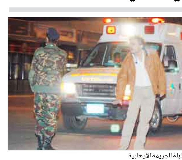
سيارات اسعاف تنقل الضحايا ليلية الجريمة الارهابية

العمل الإرهابي لن يثني السياحة عن التطور