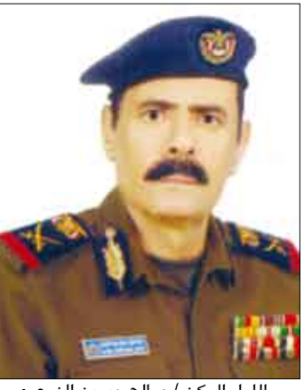
اللواء الركن / صالح حسين الزوعري

منع حمل السلاح حد من الجرائم والحوادث الأمنية و جرائم القتل والثأر