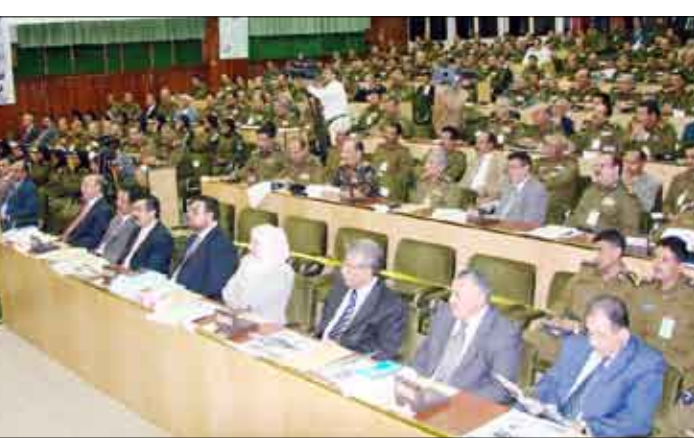
مخالفيين لقانون هيئة الشرطة واندما .

ورفع الجاهزية و الروح المعنوية العالية لرجال الشرطة . الشرطة المجتمعية أسلوب جديد فعلاً نحن نؤمن أن الشرطة في خدمة المجتمع وهذا شعار معروف ولكن الشرطة المجتمعية تعني المشاركة مع المواطن في أمور الأمن ولكنها ليست جهازاً جديداً وإنما عقلية جديدة وتعامل و