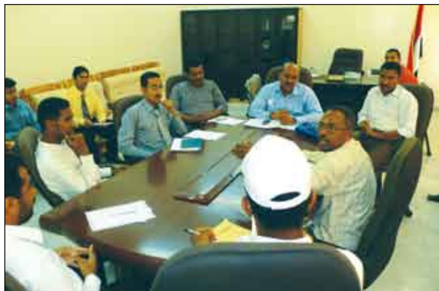
اجتماع مكتب الشباب والرياضة

لعدن / 14 أكتوبر / خاص : عقد مكتب الشباب والرياضة أمس الاجتماع الموسع لقيادات منظمات الدفاع المدني الشبابية وبدن ذلك برعاية الأخ / أحمد محمد الكلثاني ، محافظ محافظة عدن . رأس الاجتماع الأخ / جمال اليماني ، مدير عام مكتب الشباب والرياضة وحضره الأخوة / عصام وادي ، مدير إدارة الجمعيات وممثل عن مجلس شوري الشباب والمدرسة الديمقراطية ومدير عام التدريب والتأهيل الإعلامي فرع عدن والمنظمات المانحة . وتطرق الاجتماع إلى مناقشة عدد من القضايا المتعلقة بتفعيل دور الشباب وعملية إشراكهم في النشاطات التي تعود عليهم بالنفع وذلك في الجوانب الخاصة بقدراتهم وتمييزها بالإضافة إلى تنسيق النشاطات الشبابية ورعايتها بشكل صحي انسجاما وتنفيذا لتوجهات الراعي الأول للشباب فخامة الأخ الرئيس / علي عبدالله صالح رئيس الجمهورية وبرعايته الكريمة. وفي نهاية الاجتماع أدان الحاضرون الحملة الظالمة التي يتعرض لها الشعب