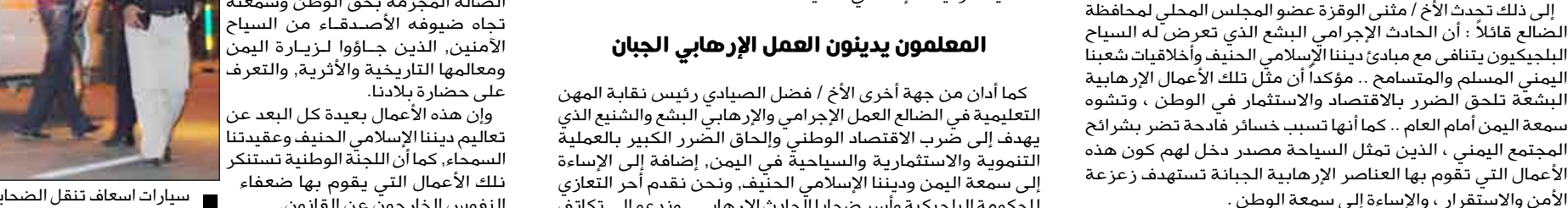
سيارات اسعاف تنقل الضحايا ليلية الجريمة الارهابية