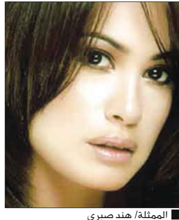
الممثلة/ هند صبري