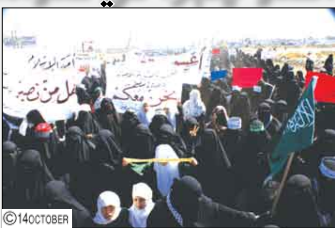
يشجع المعتدي على عدوانه فلنرفع صوتنا عالياً متوحدين جميعاً فلسطينيين وعرب متضامنين.»

وشدد بيان نساء اليمن على ضرورة القيام بضغوط عربية وإسلامية ودولية وأمنية لإرغام الكيان الصهيوني بالكف عن جرائم الحرب الإرهابية ضد الشعب الفلسطيني، وطالبت نساء اليمن بالإيقاف السريع للصف البحري والبري والجوي وراهاب الكيان الإسرائيلي والمجازر التي تمارس الآن في غزة، وتفعل دور الجامعة العربية للوقوف ضد الصلف الصهيوني وتوحيد الكلمة، بالإضافة إلى تفعيل المقابلة للعدو الصهيوني عند كافة الشعوب العربية والإسلامية، والسماح للمرضى كحالة استثنائية بالخروج لتلقي علاجاتهم.