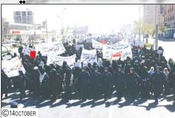
بامتصاص غضب الجماهير المحتشدة، واعدة إياهم بتسليم رسالة احتجاجهم للأمن العام للأمم المتحدة.