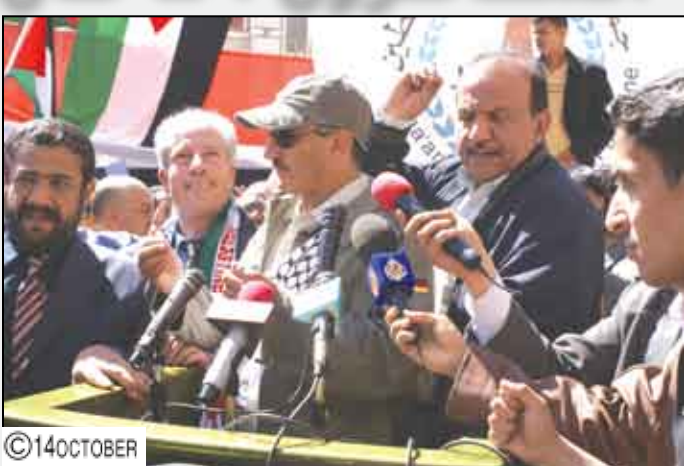
صنعاء / سبأ / تصوير/ توفيق العبيسي

وفي كلمة قصيرة للممثل القيم للأمم المتحدة بصنعاء أشارت / فلافيا بنيسري إلى وجود حالات استثنائية طارئة في غزة لا بد من معالجتها، لكن كلمتها لن تفي