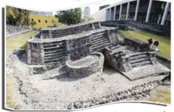
أثار من حضارة الأزتيك

اكتشف علماء آثار «هرم من حضارة الأزتيك» عمره 800 عام وارتفاعه نحو 36 قدماً (11 متراً) وسط العاصمة المكسيكية، يؤكد ذلك أن المدينة القديمة أقدم بنحو 100 عام على الأقل عما هو معتقد.