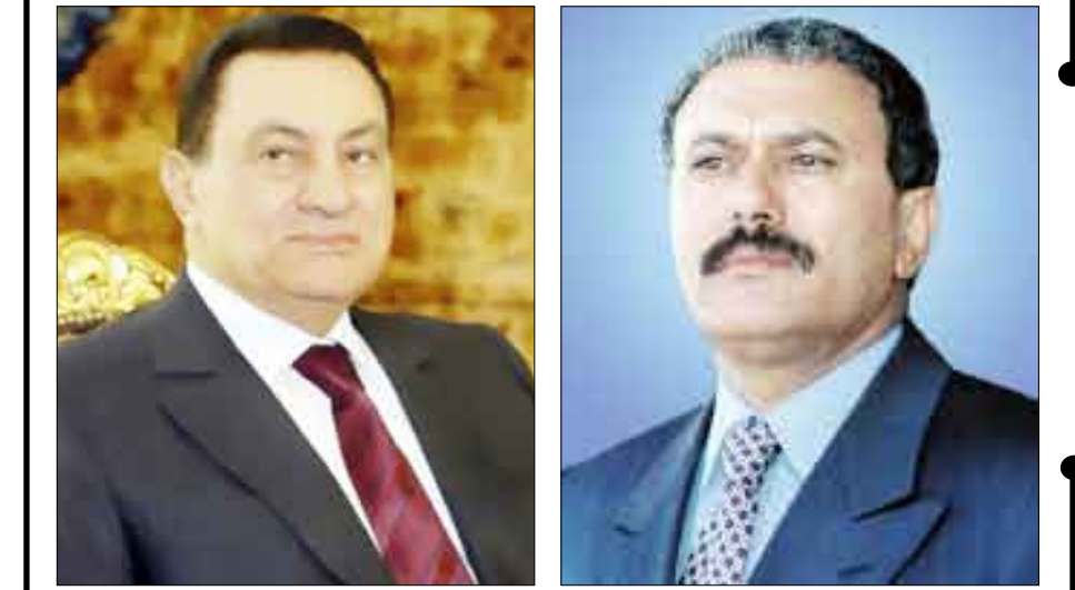
صنعاء / سيا

مواقيت الصلاة: فجر 5:09 | شروق 6:25 | الظهر 12:12 | العصر 3:29 | المغرب 5:56 | العشاء 7:01 حسب التوقيت المحلي لمدينة عدن