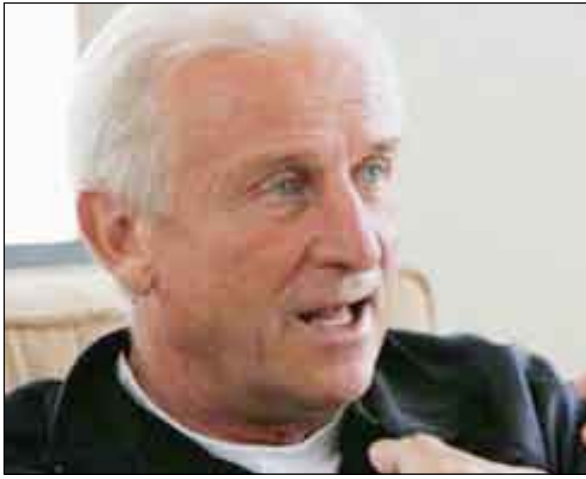
المدرّب الإيطالي المخضرم جيوفاني تراباتيوني