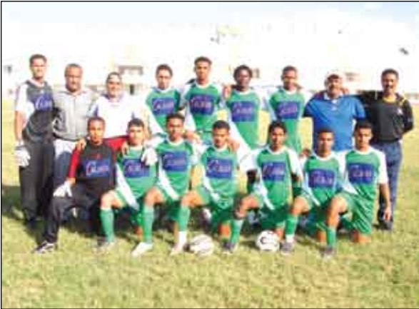
التسجيل، يلتقي اليوم الميناء و حسان والتلال * ضمن فعاليات البطولة ذاتها مع المنصورة .