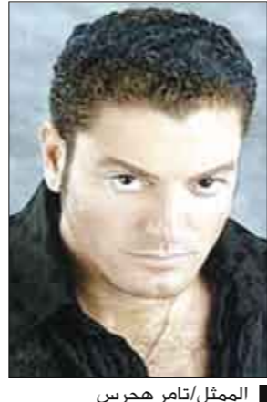
الممثل تامر هجرس

يستعد الممثل الشاب تامر هجرس لبطولة الفيلم السينمائي الجديد «البلد فيها حكومة» تأليف طارق همام، ومن إخراج عبدالعزيز حشاد. يجسد هجرس في الفيلم ثلاث شخصيات مختلفة لضابط شرطة، حيث يناقش الفيلم عدة قضايا مثيرة تخص المجتمع والحكومة والمواطن، ويشارك في بطولة الفيلم الممثلة الشابة هادي كرم، وعادة عبدالرازق، وعزت أبو عوف، ومحمد القطعي. علي جانب آخر ينتظر هجرس عرض فيلمه السينمائي الجديد «عمليات خاصة» الذي يشاركه بطولته المطرب خالد سليم، والليثانية نيكول سابا، والفنان مصطفى فهمي، وأمير كرار، والفيلم من تأليف عمرو طاهر، وأحمد عيسى، وإخراج عثمان أبو لين.