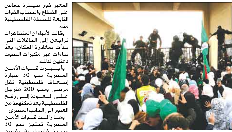
جانب من اقتحام مئات الفلسطينيين لبوابة معبر رفح