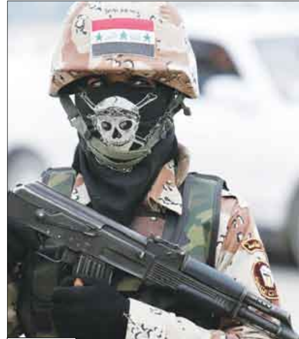
جندي عراقي يحمل علم العراق في خوذته العسكرية