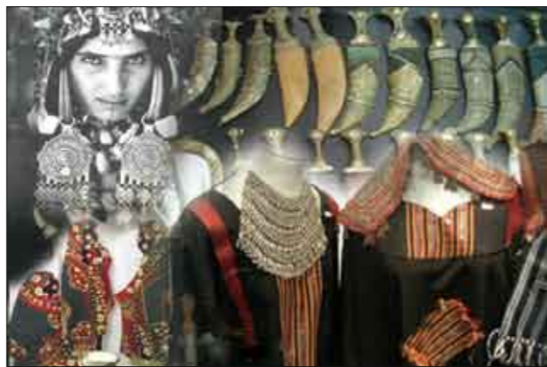
أزياء وحلي يمنية قديمة

وعُثر الأثريون على تمثال ربما يكون لإله الأمطار «تلالوك» أو اله السماء والأرض «تيزكاتليبوكا» عند الأزتيك. وكشف الحفر أيضاً عن خمس مجامع ومجموعة من الغرف قرب الهرم يعود تاريخها للعام 1431.