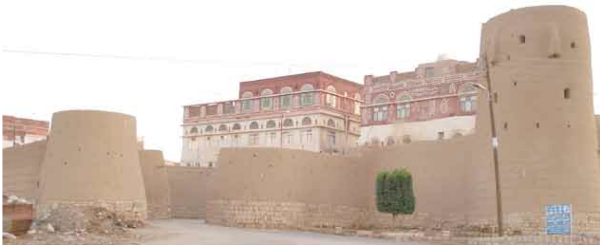
باب نجران بصعدة

المحتوية في الصخر لخرن الحبوب بالاطافة إلى مسجد وأكثر من 30 منزلاً حيث كان الحصن بمثابة مدينة مسورة بسور من الحجر ذو باب واحد يسمح بعملية الدخول والخروج من الحصن... يذكر المؤرخون أن قبائل خولان بنى عامر اعصمت بهذا الحصن عند غزواه الأشرم مكة في حملته المعروفة لهدم الكعبة.. كما يوجد في الحصن بعض النصوص المكتوبة بخط المسند والتي تحكي دعوة الوالي الحميري صنع بن حبش بن أبناء قبائل الجنوب وبشمان لبناء سدین للمياه؟؟؟