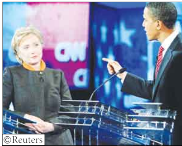
مشادة بين مرشحي الرئاسة الأمريكية كليتون واوباما

الأمريكي السابق بيل كليتون لشنه هجمات كاذبة على سجنه. وقال ان هذا النقد «مزعج» لكنه مستعد للقتال والتصدي له، وحين تحدث اوباما عن زوج كليتون قالت سناتور نيويورك «لا يجب ان يتحدث في غيبته». ورد اوباما بدوره معلفا «في احيان لا أعرف من الذي أخوض معه السباق». ويتنافس اوباما وكليتون للفوز بترشيح الحزب الديمقراطي في انتخابات الرئاسة الأمريكية التي تجري في نوفمبر تشرين الثاني لخلافة الرئيس جورج بوش. وفي الانتخابات الأولية التي أجريت في الان فاز اوباما في ولاية أيوا بينما فازت كليتون في نيوجامبوز وبنفادا. وقال اوباما الذي جاء في المرتبة الثالثة بفارق كبير بأنه سيواصل السباق. وانتقد اوباما في المناظرة الثلاثية التي أجرتها