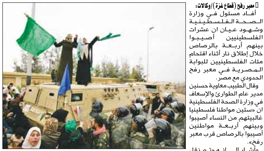
مواجهة بين الفلسطينيين والقوات المصرية في البوابة المصرية

المعبر فور سيطرة حماس على القطاع وانسحاب القوات التابعة للسلطة الفلسطينية منه. وقالت الأنباء ان المتظاهرات تراجعن إلى الحفلات التي بدأت بمغادرة المكان، بعد نداءات عبر مكبرات الصوت دعتهن لذلك. وأجبرت قوات الأمن المصرية نحو 30 سيارة إسعاف فلسطينية تقل مرضى ونحو 200 مترجل على العودة إلى رفح الفلسطينية بعد تمكنهم من العبور إلى الجانب المصري. وهما زالت قوات الأمن المصرية تحتجز نحو 30 سيدة فلسطينية رفضن العودة إلى رفح الفلسطينية، بعدما كسرن بوابة المعبر ودخلن الأراضي المصرية عقب مظاهرات تم تنظيمها للسماح بدخول الجرحى الفلسطينيين إلى مصر. وشارك عشرات المواطنين وقبائديون من فصائل منظمة التحرير الفلسطينية (فتح) في تظاهرة نظمها هيئة العمل الوطني التابعة للمنظمة في اعتصام أمام مقر منسق الأمم المتحدة بغزة وظالبوا برفع الحصار والإغلاق عن القطاع. وشهد إبراهيم أبو النجا القيادي في حركة فتح في كلمة أمام المعتصمين على ضرورة رفع الحصار والإغلاق عن قطاع غزة.