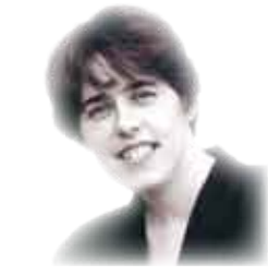
الشاعرة الأمريكية مادلين ماري سلافيك صاحب المدينة ..