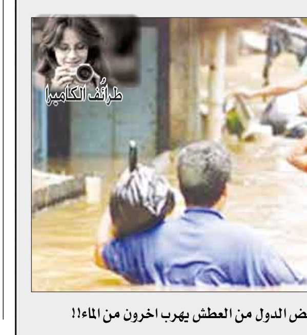
بينما يموت الناس في بعض الدول من العطش يهرب آخرون من الماء!!