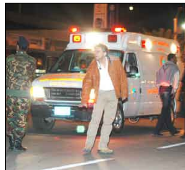
سيارة الإسعاف التي نقلت السياح الأجانب

وعلى ذات السياق يقول الأخ المهندس علي عبد الملك الشرجي : إننا نستنكر وندين العمل الإرهابي الذي قاده مجموعة من الزنادقة المنحليين دينيا وأخلاقيا ونقول لهم هيهات لكم أن تشوهوا الوجه الجميل للجمهورية اليمنية أو تفجروا المسيرة الديمقراطية والتنمية التي يقودها فخامة الأخ علي عبد الله صالح رئيس الجمهورية، ونشيد برجال الأمن الأبطال الذين يتصدون مثل هؤلاء المجرمين الضالين المخربين أينما وجدوا على أرض الوطن الحبيب، وإن مثل هذه الأعمال الإرهابية لا تمت إلى وطننا بصلة ولا إلى حضارة وتاريخ شعبنا اليمني الأصيل وبنيته ومنها كل وطني شريف غيور على وطنه وعروبته ودينه ، ونود أن نؤكد