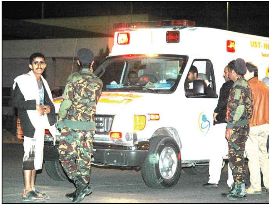
سيارة الإسعاف التي نقلت السياح الأجانب

وينتشر الفيروس أيضا إلى مناطق جديدة داخل الأقاليم التي ظهر بها المرض وتجد السلطات صعوبة في احتوائه. وقالت سانجيتا باكشي مديرة الخدمات الصحية بولاية البنغال الغربية لرويترز "هناك صعوبات والفيروس ينتقل من مكان إلى آخر".