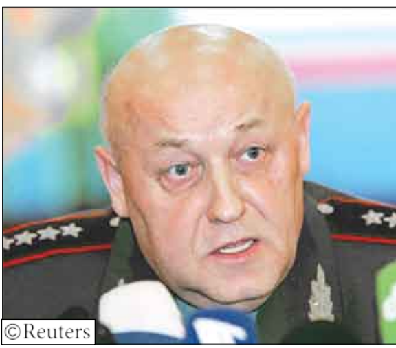
رئيس هيئة أركان القوات الروسية