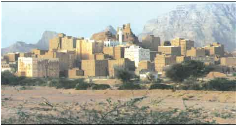
■ جانب من المدن التاريخية في شبوة