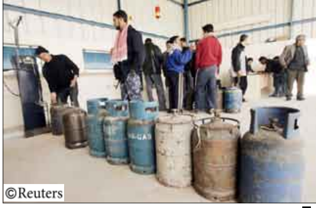
الفلسطينيون في غزة يقفون طوابير لشراء الغاز

خلال جلستهم الأسبوعية الحصار المفروض على قطاع غزة وقرروا الإبقاء على هذا الضغط. من جهته أعلن المتحدث باسم وزارة الخارجية ارييه ميكيل «لم يحصل أي تغيير يتعلق بالوضع في هذا القطاع وإسرائيل