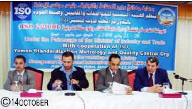
المستهلكين داخلية وخارجية. وأكد الأخ وزير الصناعة والتجارة حرص الحكومة ممثلة بوزارة الصناعة أهمية القرارات والإجراءات الصادرة من الوزارة والمربطة بمعالجة الوضع التوموني وتكثيف عمليات الرقابة على الأسواق للمساهمة في حماية المستهلك.

ع/عن/ ذكرى جوهر: دعا الأخ/ يحيى بن يحيى المتوكل وزير الصناعة والتجارة وأرباب العمل في القطاعات الإنتاجية المختلفة إلى العمل على رفع مستوى الجودة والكفاءة والإنتاجية والالتزام بالمعايير والمواصفات واتباع الوسائل العلمية والتطوير والتحسين المستمر بما يمكنهم من المنافسة والانتشار وكسب ثقة