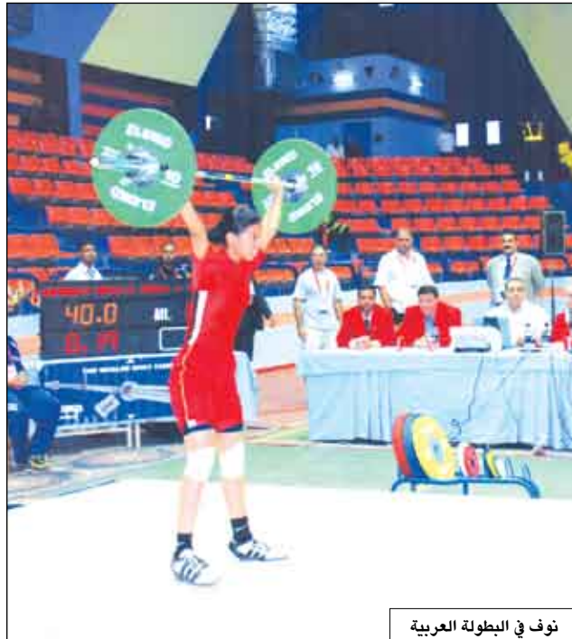
نوف في البطولة العربية