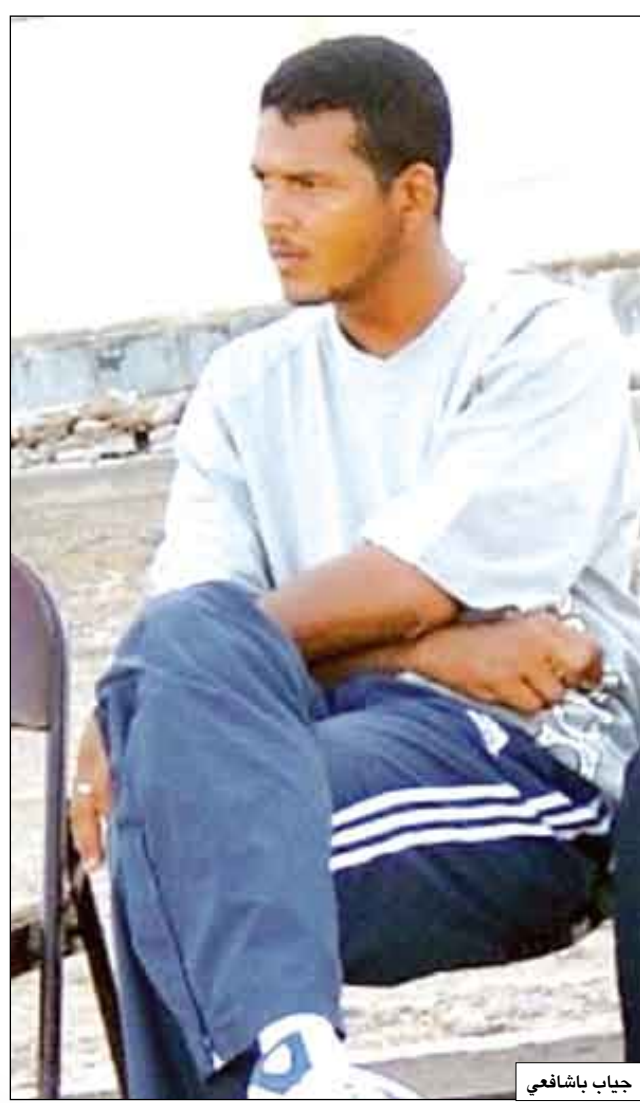
جيب باشا فني

من مرة ولقب اللاعب المثالي في أكثر من مرة ، بالإضافة إلى الجهود التي قدمها في صفوف المنتخب الوطنية التي تدرج في مراحلها العمرية المختلفة وصولاً إلى صفوف المنتخب الأول ومشاركاته الطيبة معه. وستجمع مباراة مهرجان الاعترال الضيف الزمالك ، وفريق هلال