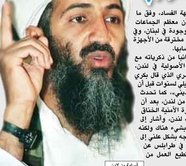
أسامة بن لادن