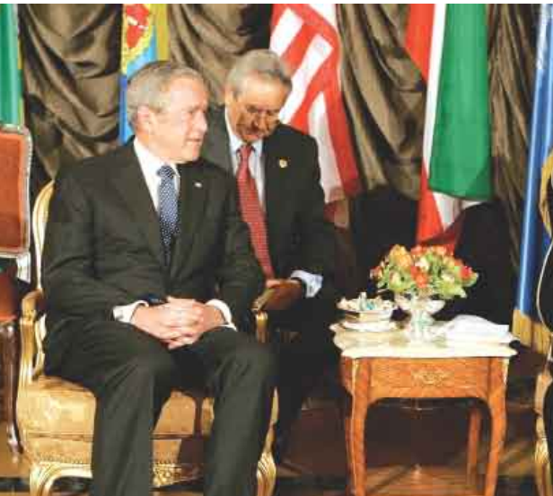
بوش مع أمير الكويت أس