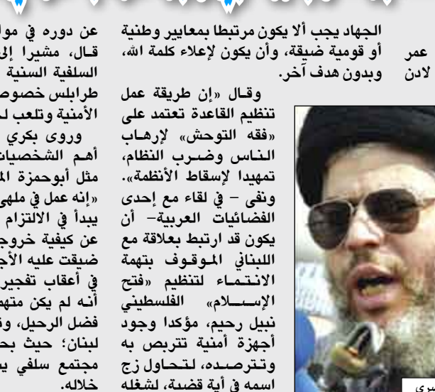
أسامة بن لادن