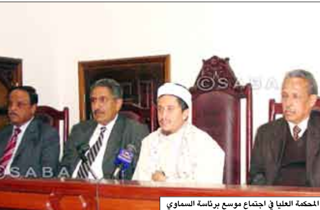
المحكمة العليا في اجتماع موسع برئاسة السماوي